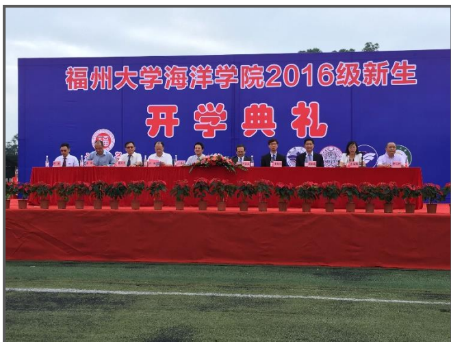
照片 1：福州大學海洋學院 2016 級新生開學典禮。