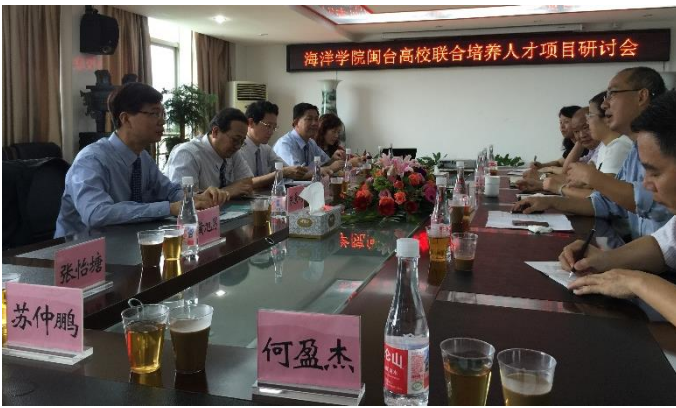
照片 4：與海洋學院閩臺高校聯合培養人才項目研討會