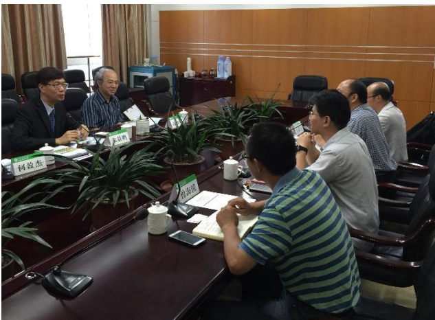
照片 5：拜會姊妹校福建農林大學與交流會談