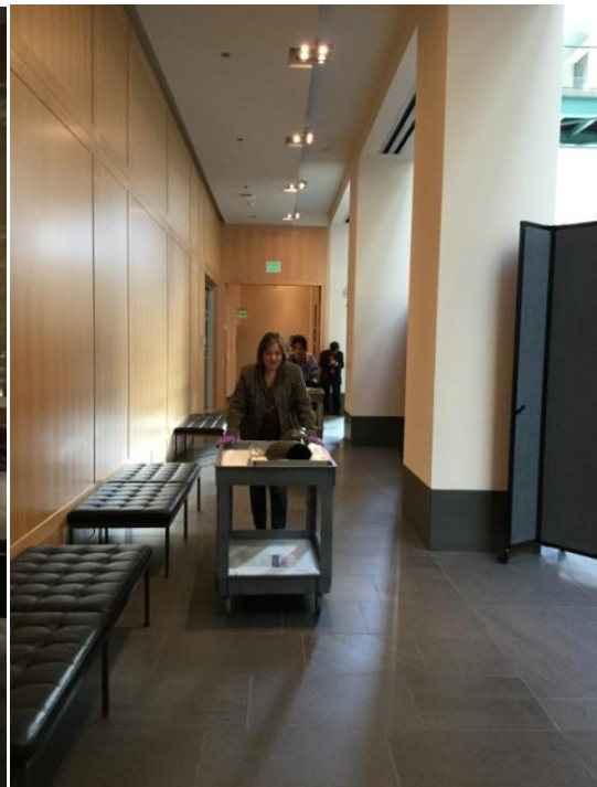
圖四、運送文物入庫點交