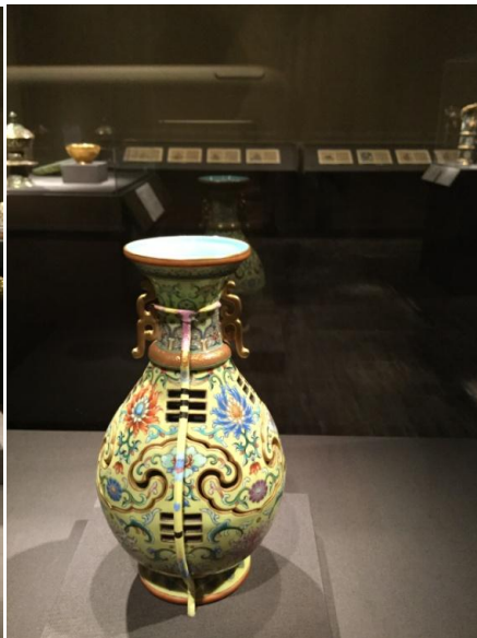
圖十一、上彩的鐵支架