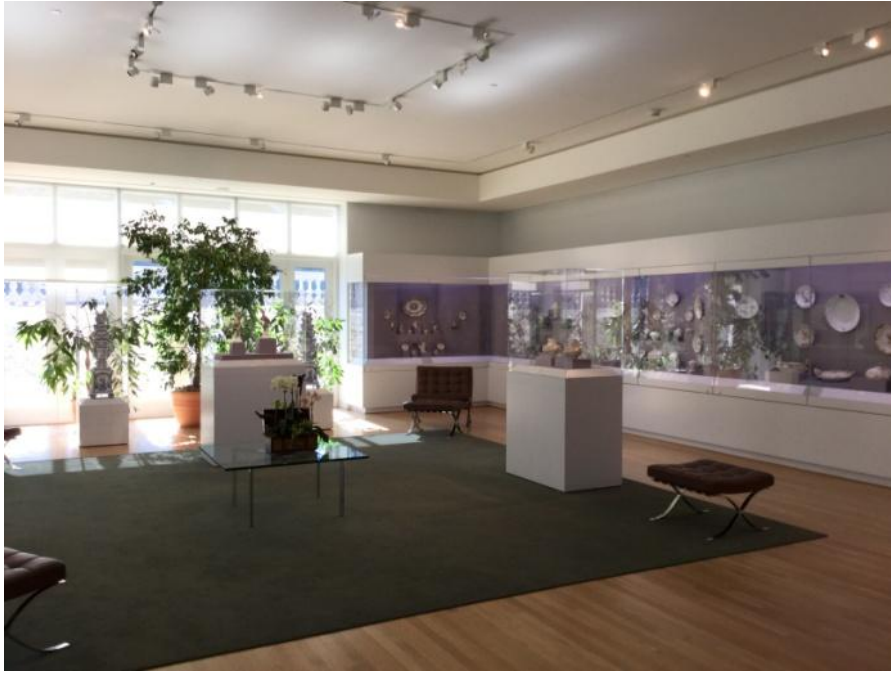
圖十二、Honneur et Patrie 陳列室