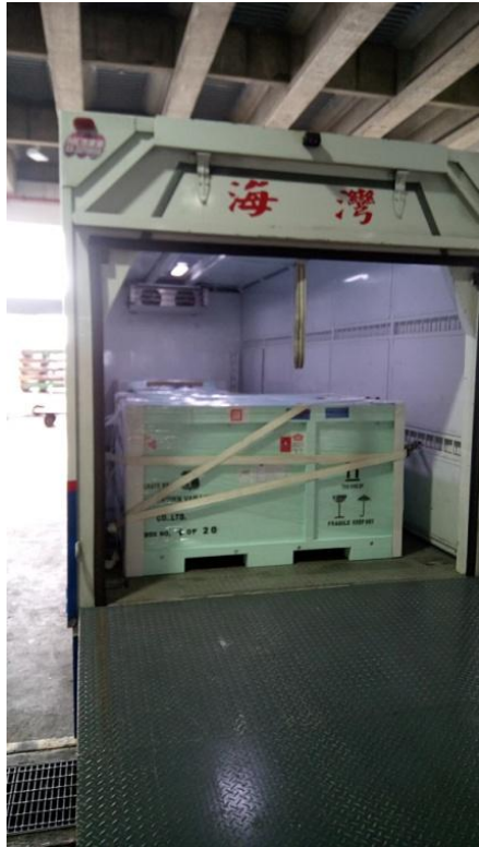
圖九、返院運送、封條、震動偵測儀