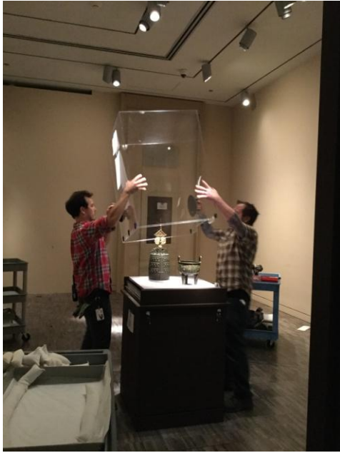
圖五、陳列室撤展狀況