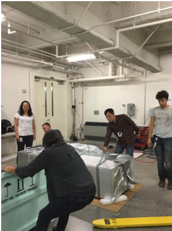
圖七、真空包裝工作實景