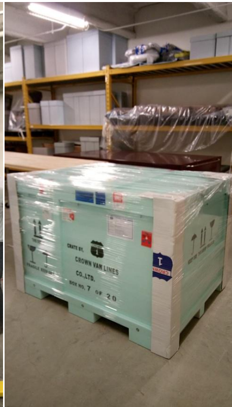
圖八、外箱防水保鮮膜圖