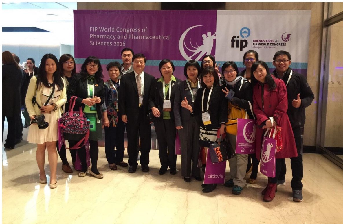
圖四、臺灣代表團團員於會場合影留念。