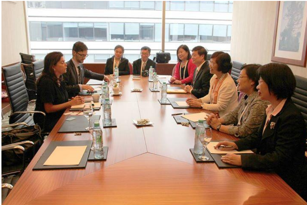
圖二、拜會FIP理事長Dr Carmen Peña及秘書長Mr Luc Besançon。