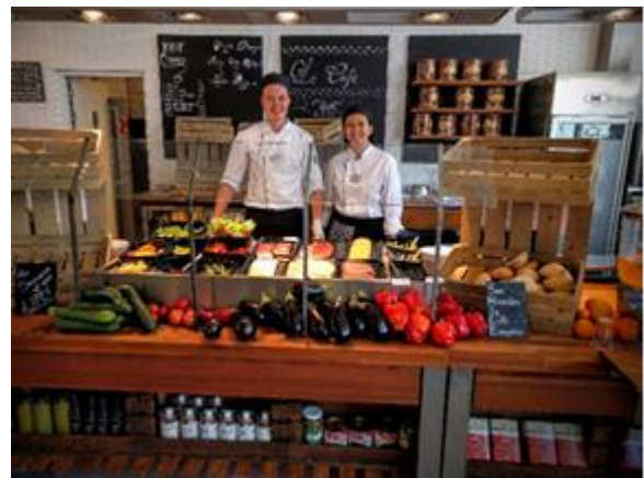
↑圖：荷蘭海牙旅館管理學院 (學生餐廳-海牙校區)