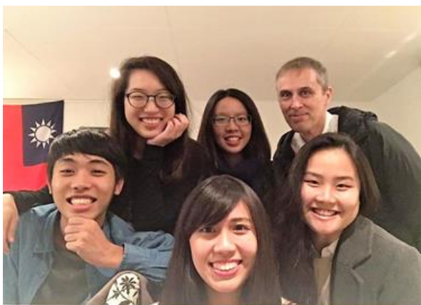
↑圖：本校 5 位赴荷蘭海外研修生