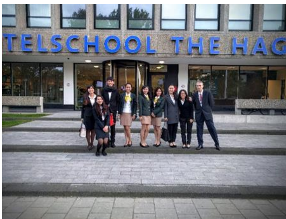
↑圖：荷蘭海牙旅館管理學院 (阿姆斯特丹校區)