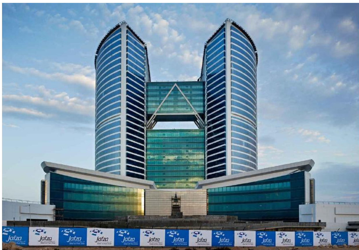
圖 育成中心位於「杰貝阿里自由貿易區」Jafza One 大樓 22 樓