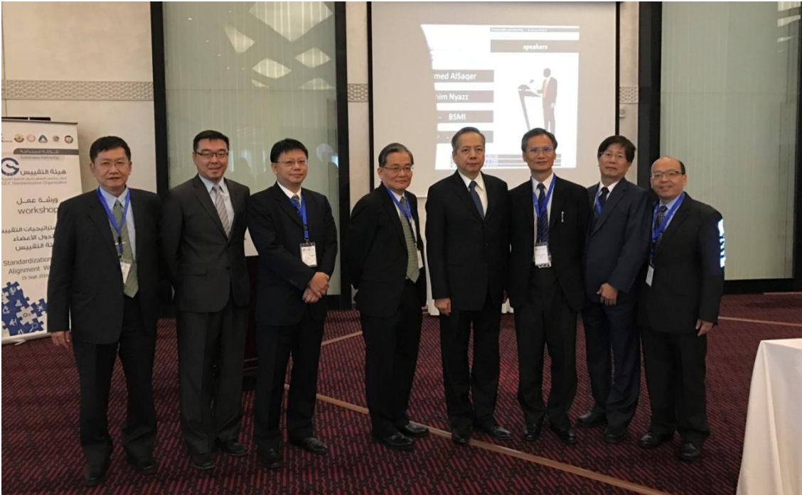
圖 我國本次出席 GSO 策略會議代表