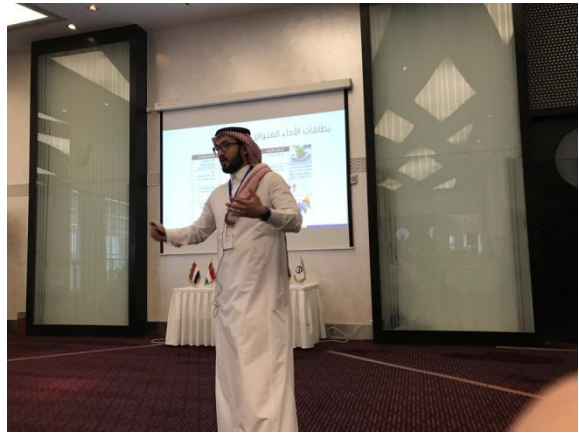
圖 海灣國家講者簡報整體策略進展與執行工具