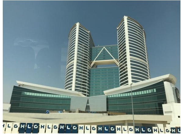
圖 育成中心大廳與外觀