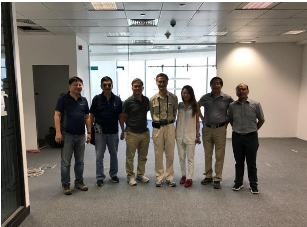
圖 參訪臺商中心辦公室公共區預定地