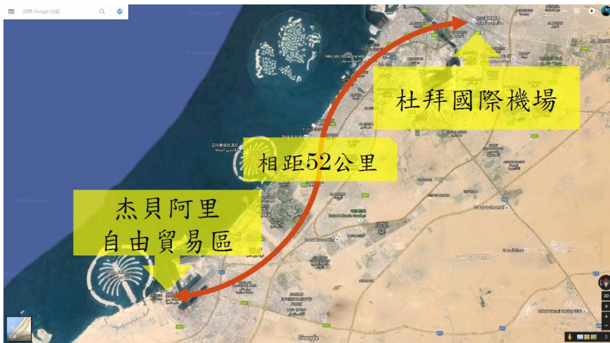
圖 育成中心(位於杰貝阿里自由貿易區)與杜拜要點相對位置