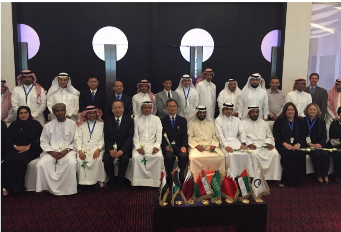
圖 GSO 策略會議主要參與單位會後合影