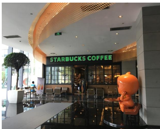
圖 4-8：園區內餐飲商店