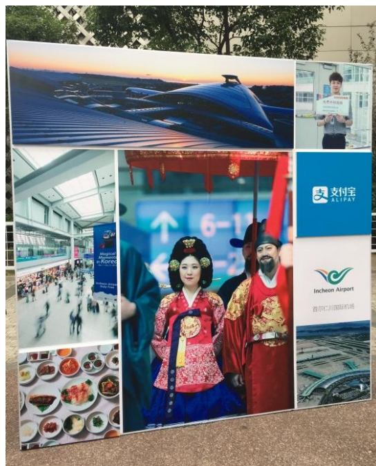
圖 3-9：韓國首爾仁川國際機場傳播特色的現場活動背板。