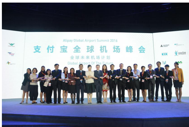
圖 3-20：各機場代表與螞蟻金服集團代表於會後合影。