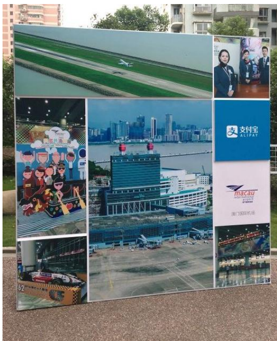
圖 3-8：澳門國際機場傳播特色的現場活動背板。