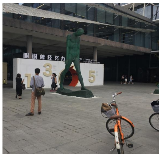
圖 4-4、4-5：園區內免費腳踏車借用服務