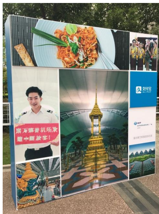
圖 3-5：泰國曼谷素萬那普國際機場傳播特色的現場活動背板。