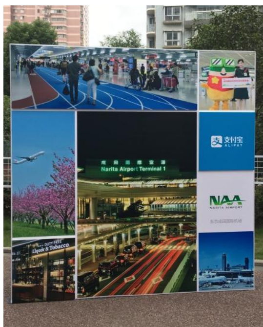
圖 3-6：東京成田國際機場傳播特色的現場活動背板。