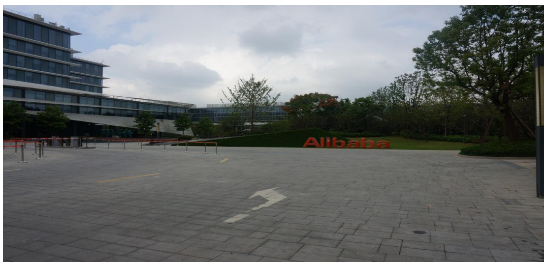
圖 4-1：杭州阿里巴巴園區

阿里巴巴集團由曾擔任英語教師的馬雲為首的 18 人，於 1999 年在中國杭州創立。阿里巴巴是一間提供電子商務線上交易平台的公司，業務包括 B2B 貿易、網上零售、購物搜尋引擎、第三方支付和雲計算服務。集團的子公司及關聯公司有淘寶網、天貓、一淘網、阿里雲計算及螞蟻金服。旗下的淘寶網和天貓在 2012 年銷售額達到 1.1 萬億人民幣，超過亞馬遜公司和 eBay 總和。於 2015 年度商品交易總額已超過 3 萬億元人民幣，是全球最大零售商。