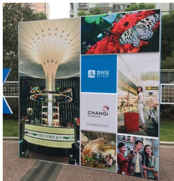
圖 3-3：新加坡樟宜國際機場傳播特色的現場活動背板。