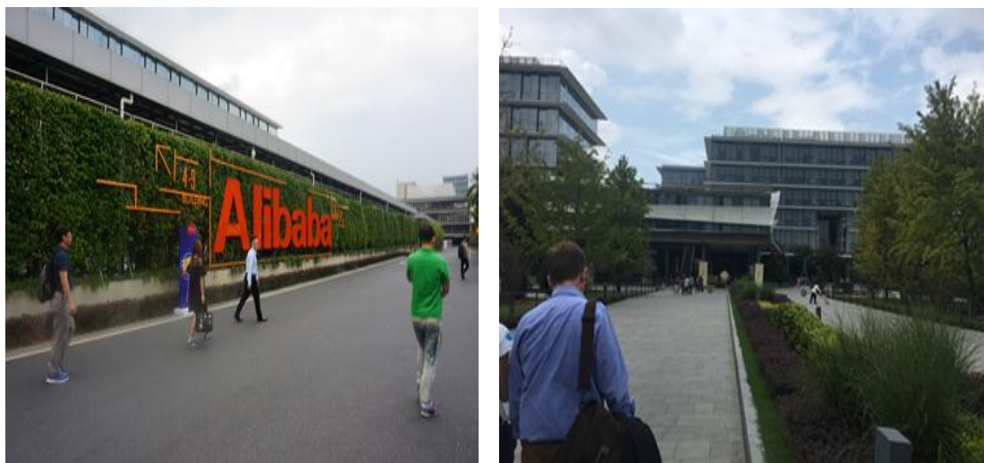
圖 4-2、4-3：阿里巴巴園區一景

阿里巴巴在 2003 年 5 月，投資一億元人民幣建立淘寶網。2004 年 10 月，阿里巴巴投資成立支付寶公司，提供中國電子商務市場交易的中介服務。2012 年 7 月 23 日，阿里巴巴宣布調整淘寶、一淘、天貓、聚划算、阿里國際業務、阿里小企業業務和阿里雲為七大事業群，組成集團。