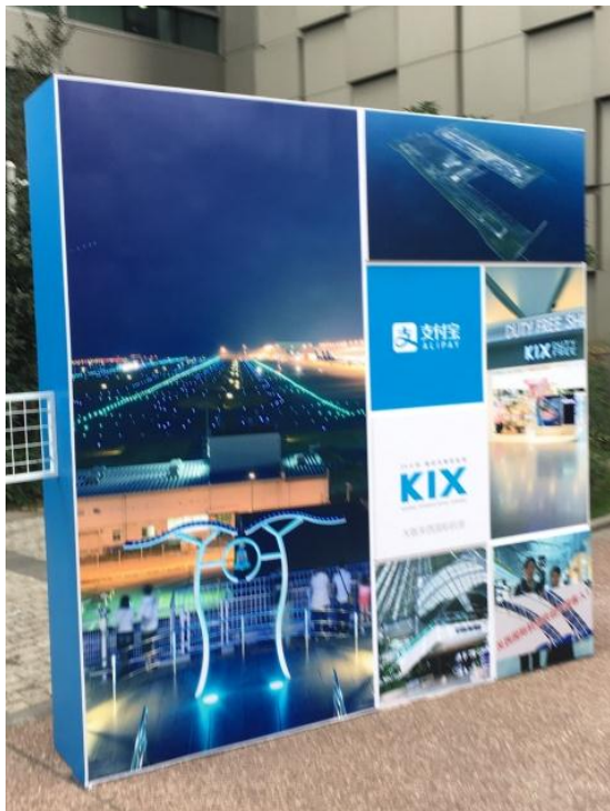
圖 3-10：大阪關西國際機場傳播特色的現場活動背板。