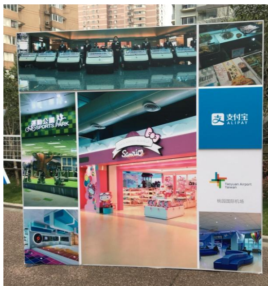
圖 3-2：桃園國際機場傳播特色的現場活動背板。