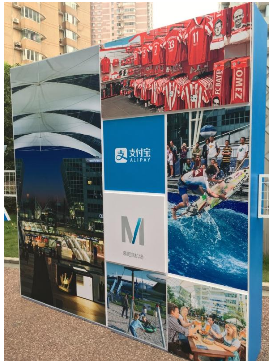
圖 3-11：德國慕尼黑機場傳播特色的現場活動背板。