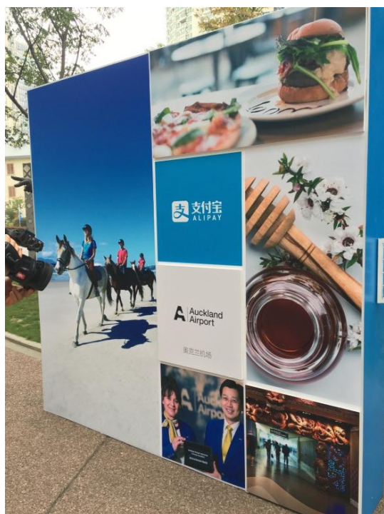
圖 3-4：紐西蘭奧克蘭機場傳播特色的現場活動背板。