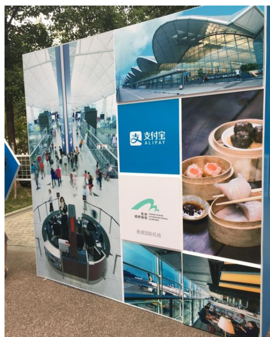
圖 3-7：香港國際機場傳播特色的現場活動背板。