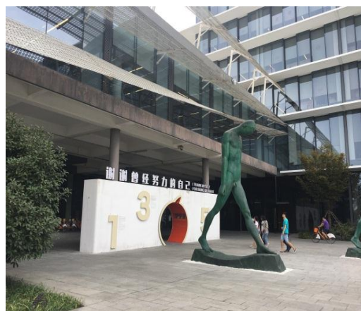
圖 4-6、4-7：園區內公共藝術設置