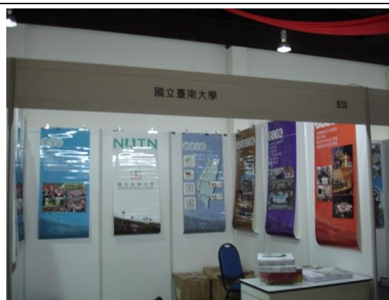
本校於吉隆坡展場之掛圖