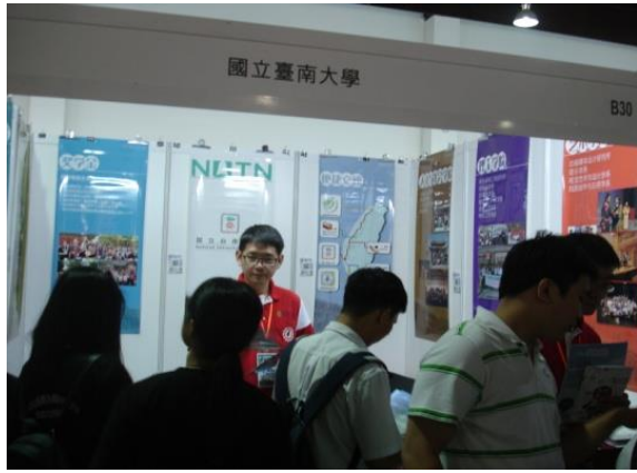
本校於檳城展場攤位