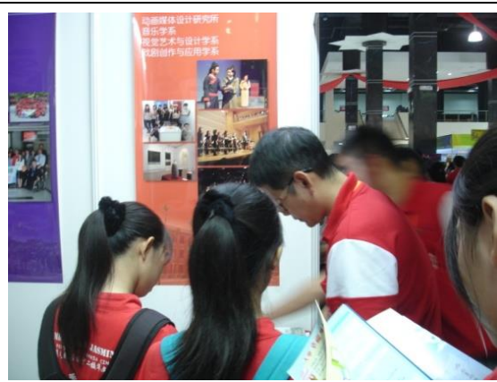
本校攤位前詢問問題之學生