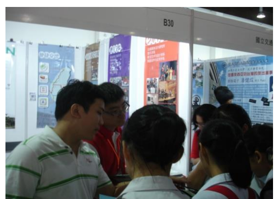
本校電機工程學系校友 協助介紹本校