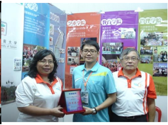
檳城留臺同學會致贈感謝狀