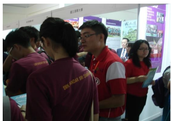
本校資訊工程學系馬來西亞籍學生 協助介紹本校