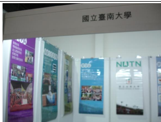
本校於吉隆坡展場之掛圖