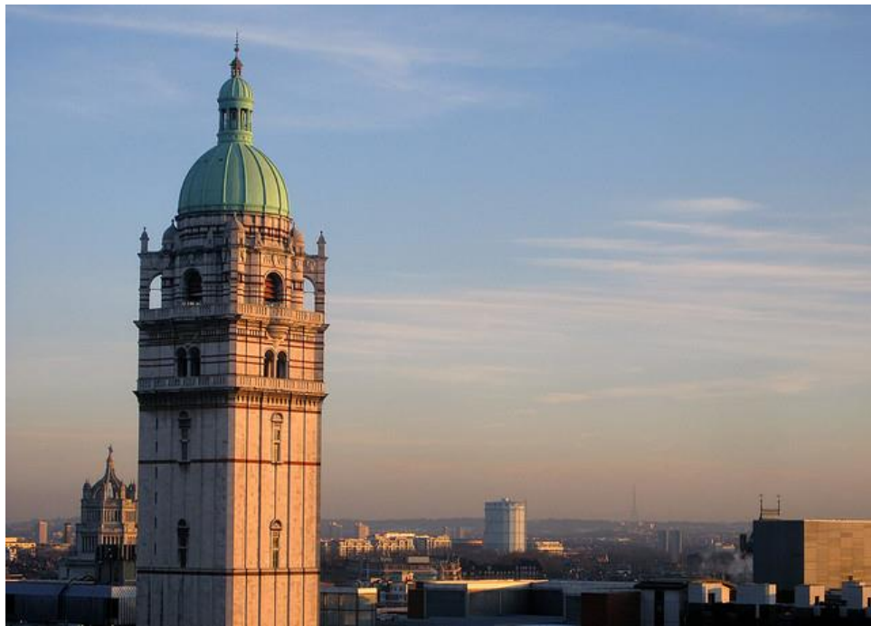
圖 2：倫敦帝國理工學院內著名的女王塔。