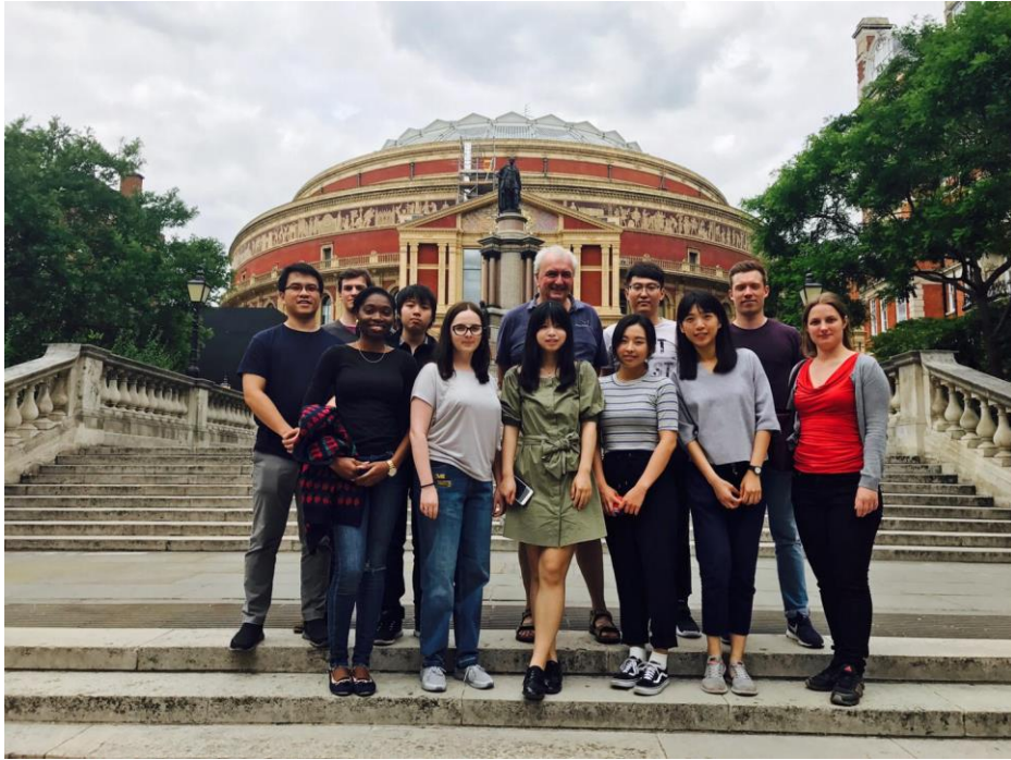
圖 4：指導教授 Paul Luckham (後排右三) 與實驗式碩博士生合影。

基本上，論文相關的研究步驟是從學科紙筆測驗結束後開始(約 6 月初)，部分學生是以儀器實驗的方式進行研究，部分學生則是利用各項程式模擬，如 ASPEN、gPROMs，進行化工程序、製程的評估及優化 (Optimisation)，並於 9 月份中旬前後完成論文並執行口試。