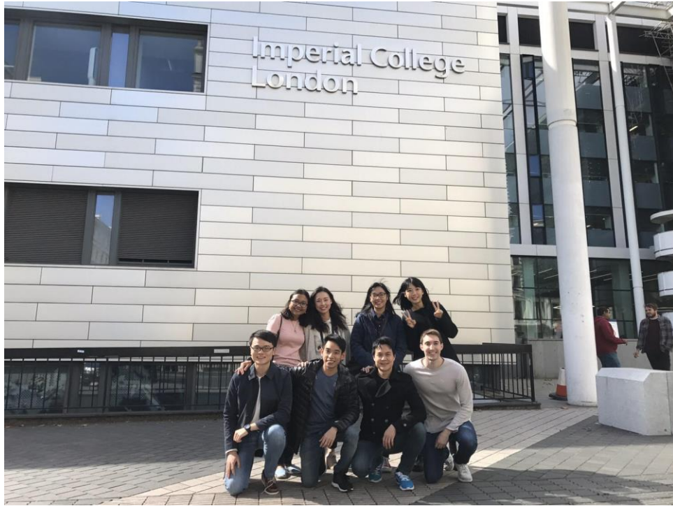
圖 1：倫敦帝國理工學院外觀。