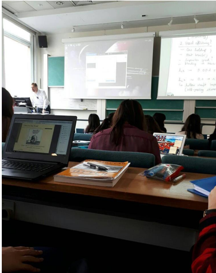
圖 3：在帝國理工學院上課實況。