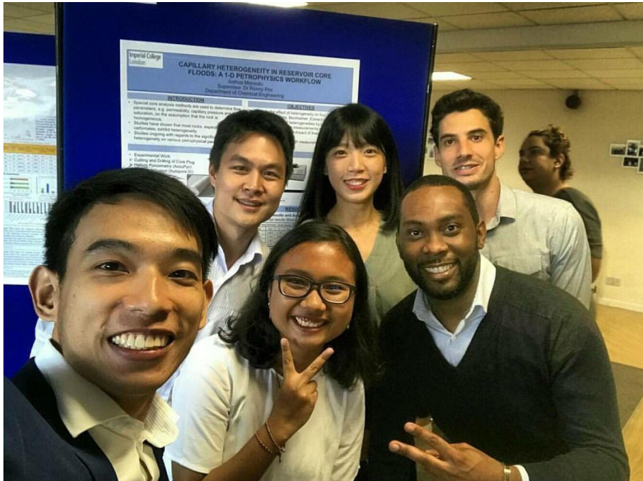
圖 6：口試當天與同學合影。

口試 (Poster Presentation) 主要是由指導教授及隨機選取一位教授、副教授或助理教授執行評分，同實驗室的博士生也有可能隨行參與評分。學生針對其論文研究題目進行 5 到 10 分鐘的介紹，結束後，評分人員會針對內容做提問，以確認學生已通盤了解自身研究領域。