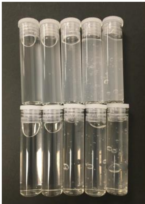
圖 7：Carbopol 膠體溶液濃度變化對可視畫的影響，由左至右為 0.5wt%、1.0wt%、1.5wt%、2.0wt% 及 2.5wt%，上排為 Carbopol 980 下排為 Carbopol 981。

Carbopol 膠體溶液隨著重量濃度的增加，其黏度 (Viscosity) 及屈服應力值 (Yield Stress Value) 會有大幅度的提升；另外，中和膠體溶液使其酸鹼值至 7 左右，亦可有效提升黏度及屈服應力值，本實驗主要使用流變儀進行各試樣流體測試作業，並利用 Herschel-Bulkley 及 Casson 經驗方程式分析各試樣流體的流變特性，再藉由混和其他溶液，期望達到一連續剪切速率及剪切應力圖 (Shear Rate - Shear Stress Plot)，也就是在一固定的屈服應力值下，可得到不同曲度的曲線，在未來，此替代流體就可用於模擬各種不同的真實流體在不同轉速的攪拌器內的動態狀態。