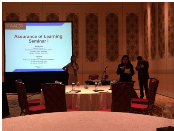
照片三：行政助理宣布研討會開始