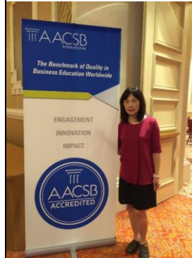
照片二：本人第二天與大會看板合影