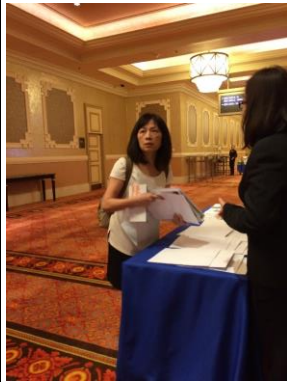
照片一：本人第一天報到領取資料