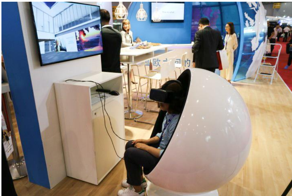
▲ 芬蘭赫爾辛基國際機場 VR 虛擬實境體驗區