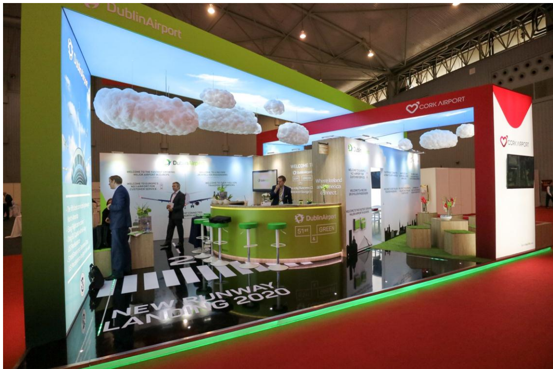
▲ 愛爾蘭都柏林國際機場展區