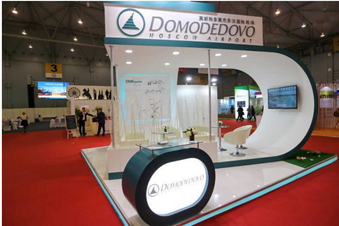
▲ 俄羅斯莫斯科多莫杰多沃機場展區