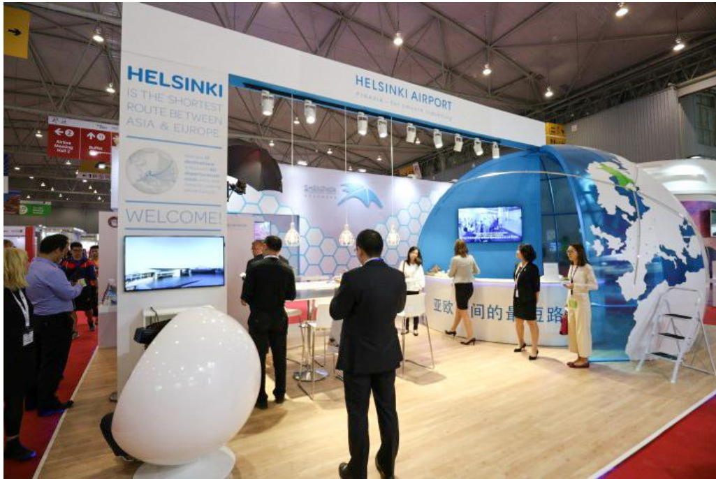
▲ 芬蘭赫爾辛基國際機場展區