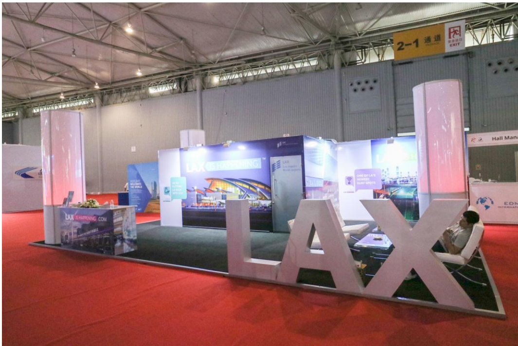
▲ 美國洛杉磯國際機場展區