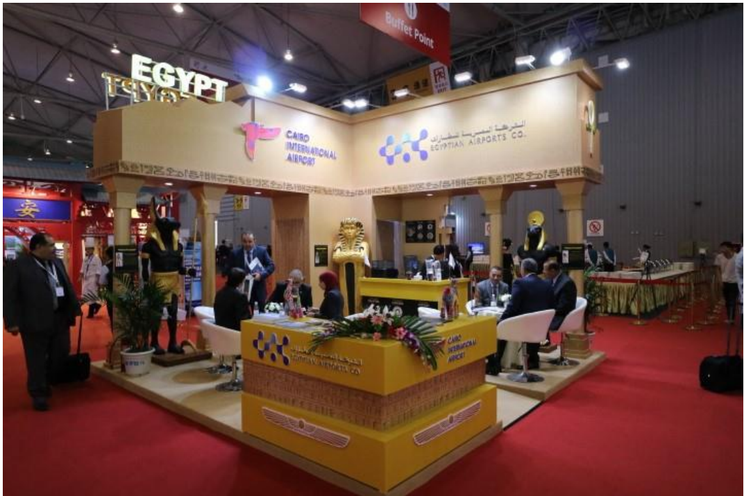
▲ 埃及開羅機場展區