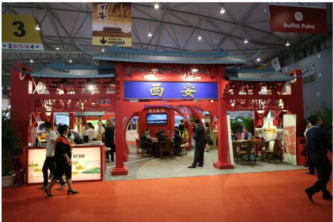
▲ 大陸西安咸陽國際機場展區