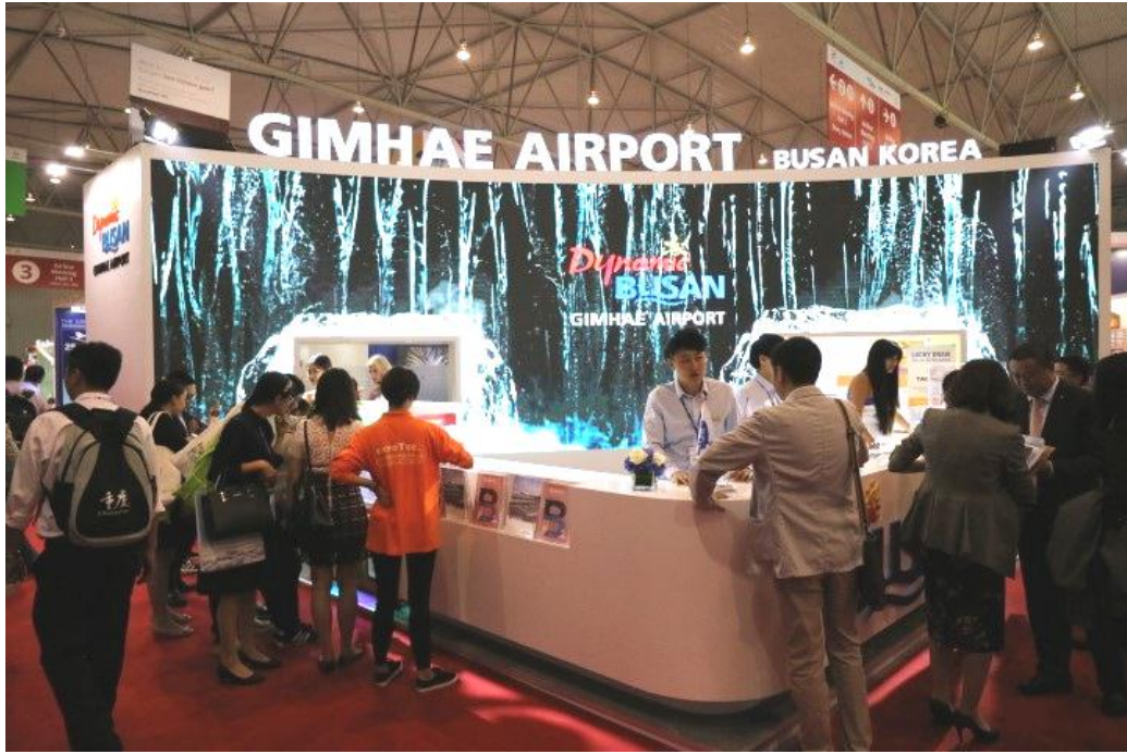
▲韓國釜山金海國際機場展區