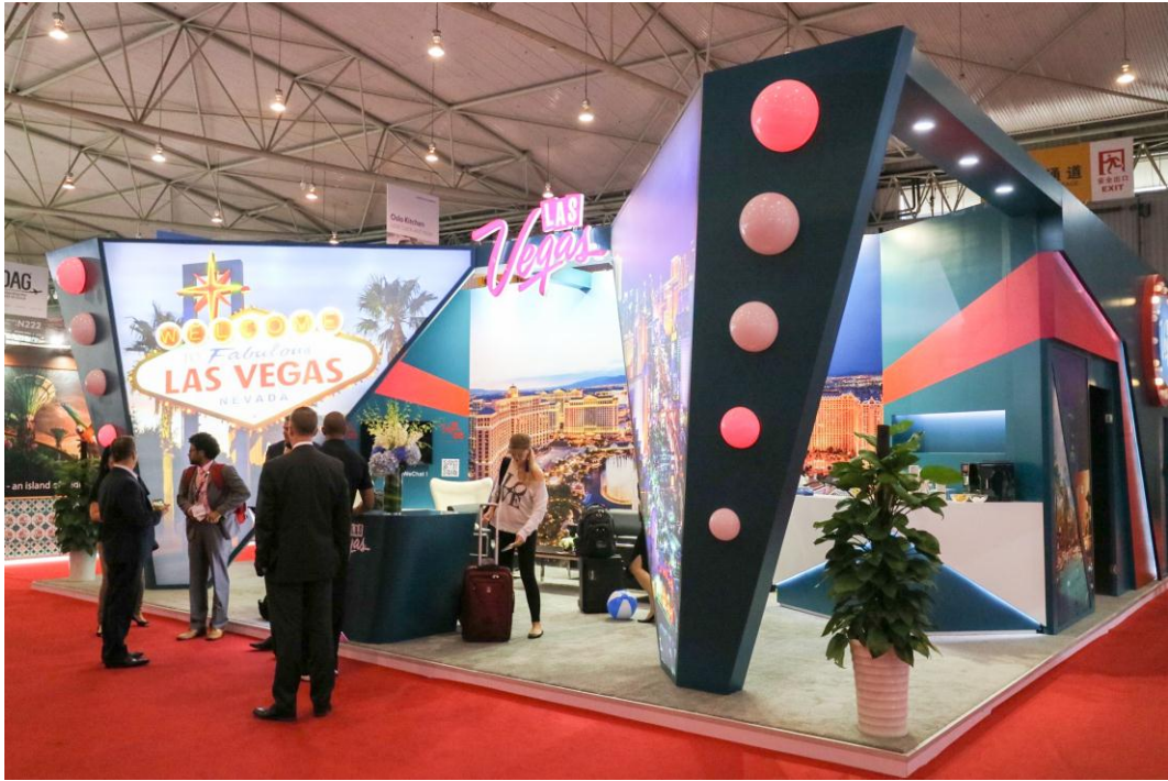
▲ 美國拉斯維加斯展區