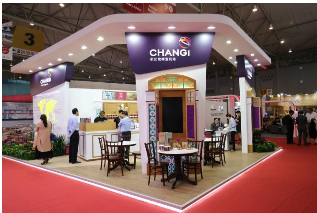
▲ 新加坡樟宜機場展區