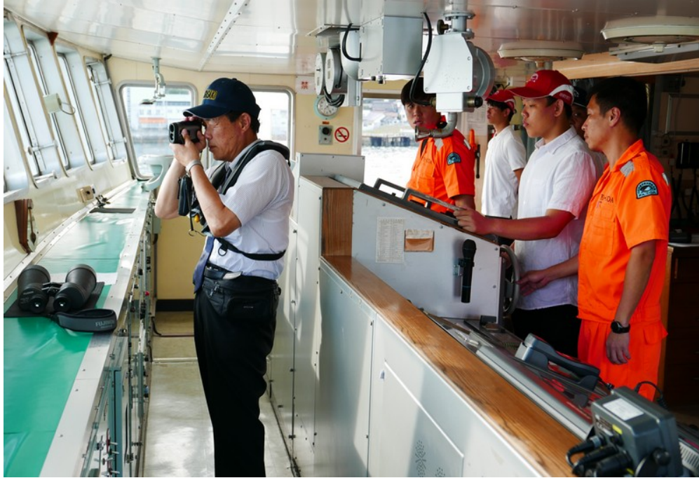
長崎進港操舵班同學在領港指揮下進行操舵實作(2)