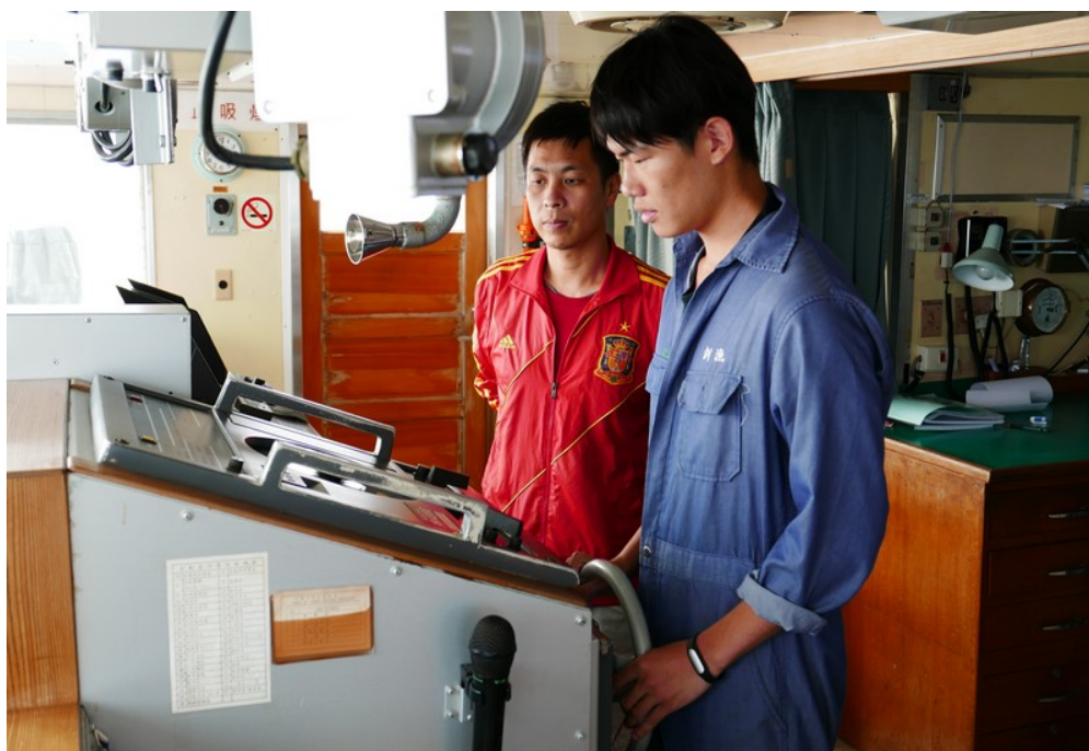
長崎進出港操舵班 4 位同學於進港前進行舵令與操船練習(5)