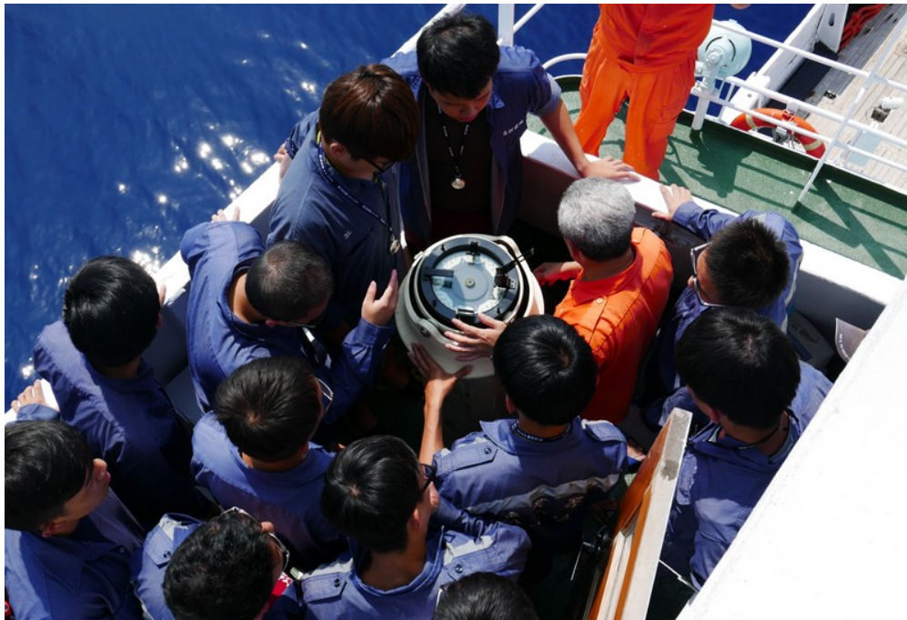
海上航行程中所安排之訓練課程(羅經校正訓練)