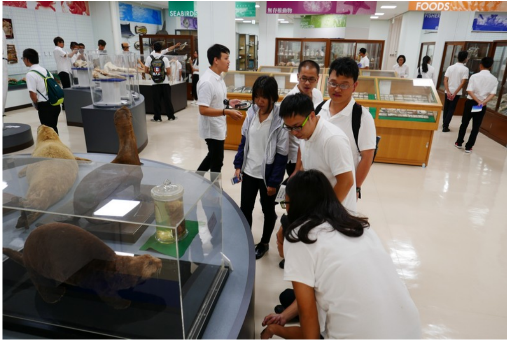
參訪東京海洋大學(2)