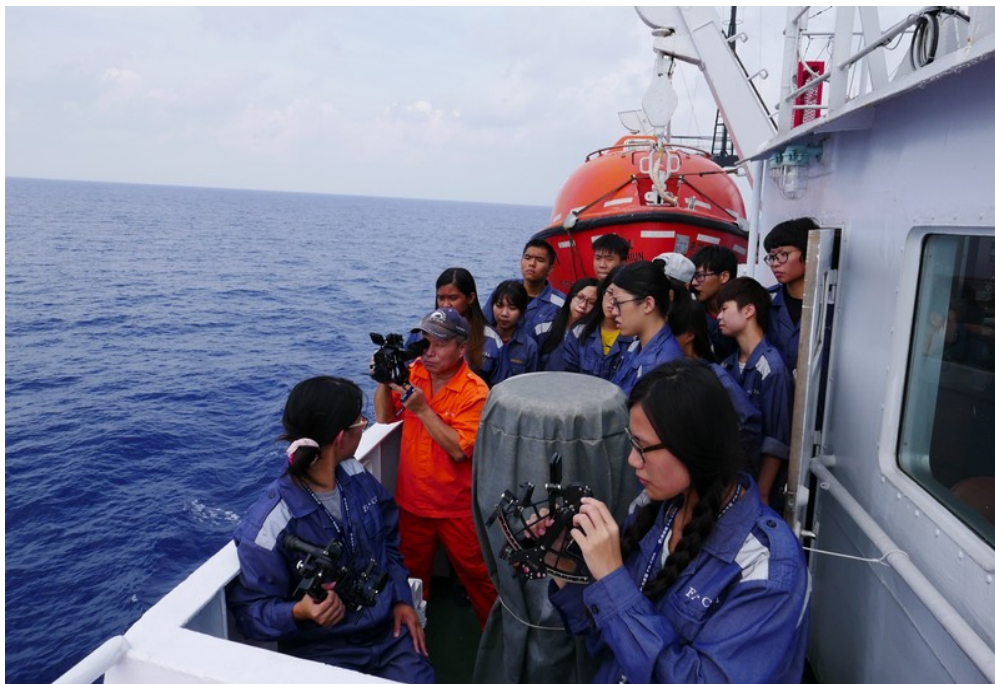
海上航行程中所安排之訓練課程(六分儀操作訓練)