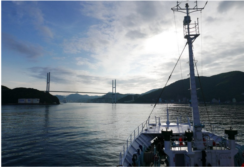
訓練船駛入長崎港