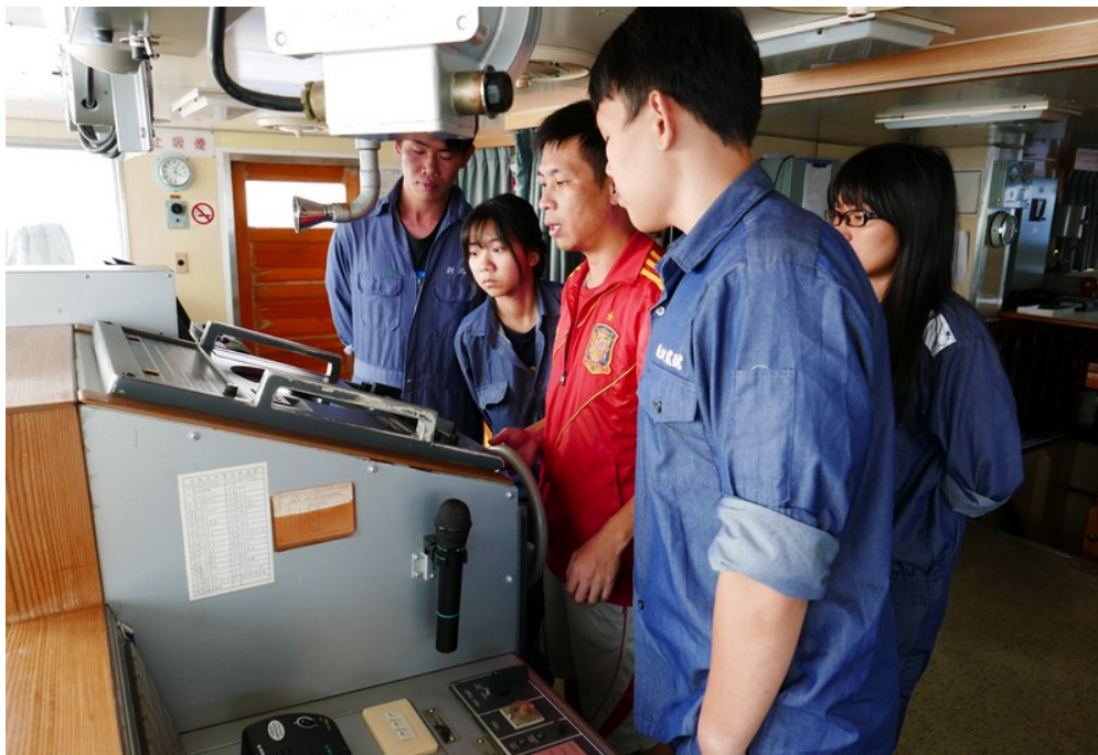
長崎進出港操舵班 4 位同學於進港前進行舵令與操船練習(1)