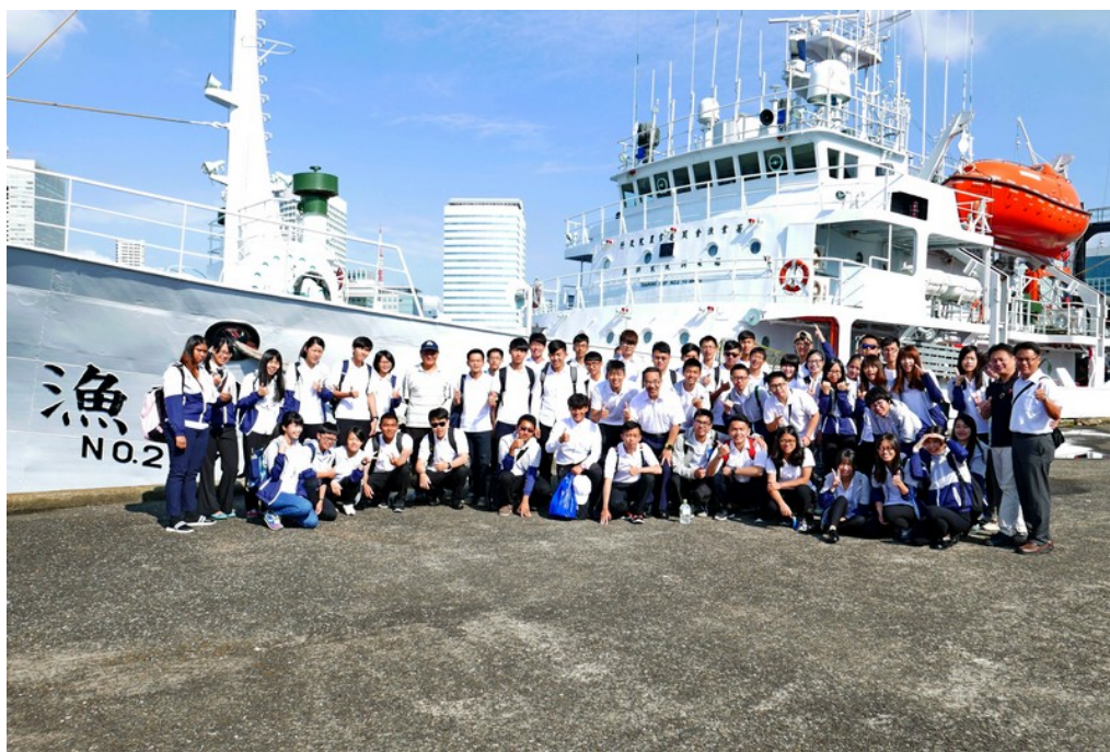
全體學生與兩位領隊老師於東京豐州碼頭合影留念