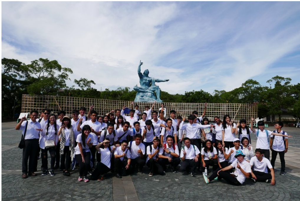
全體師生前往長崎平和公園參觀