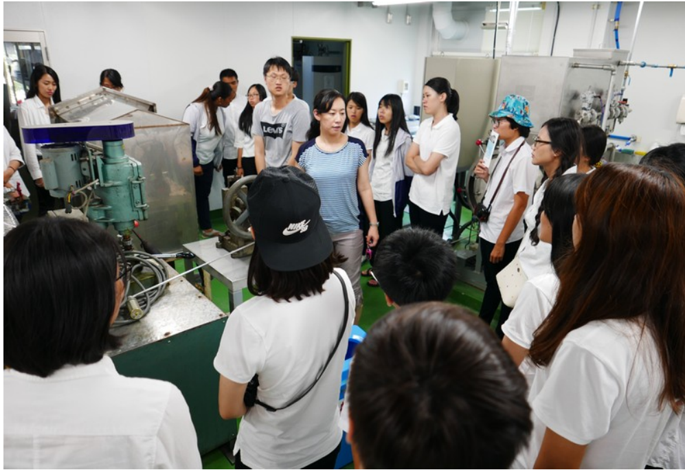
全體師生至長崎大學水產部參訪，至水產食品加工實驗室參觀