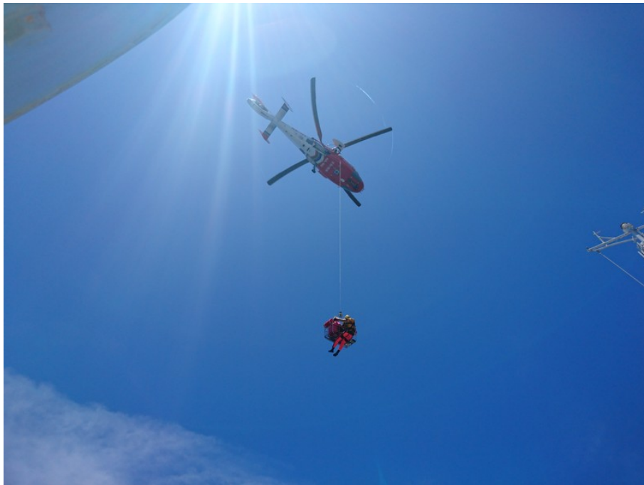
空中警察隊直昇機隊員順利將學生運送上直昇機並直接飛回台灣送醫治療