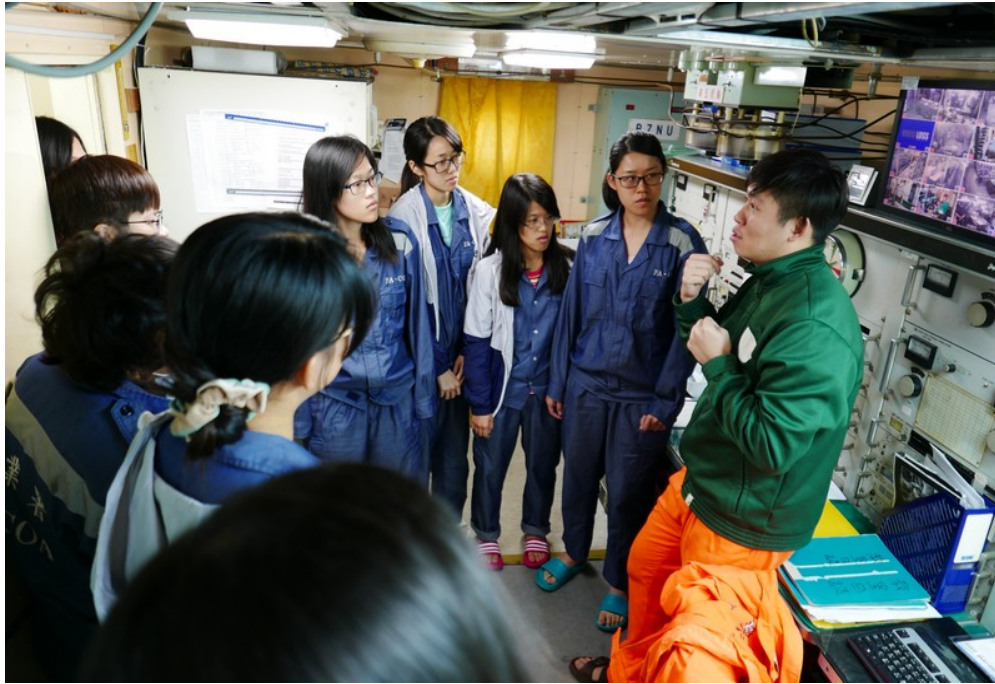
海上航行程中所安排之訓練課程(船舶通信設備說明)