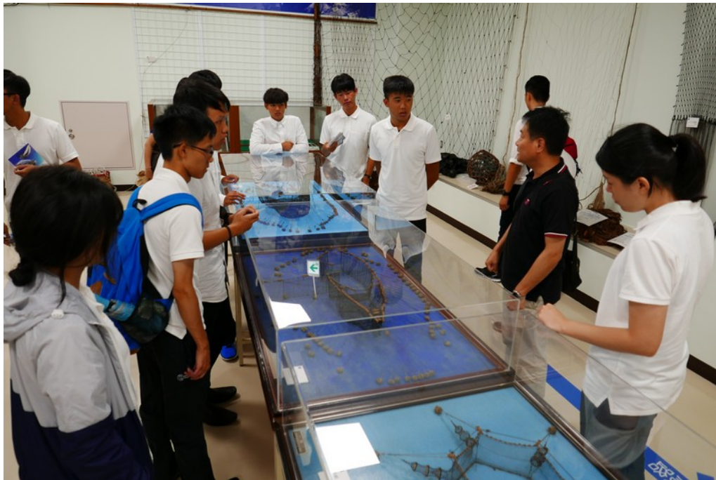
參訪東京海洋大學(3)