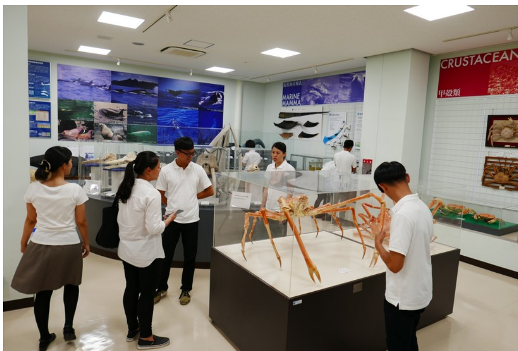
參訪東京海洋大學(1)