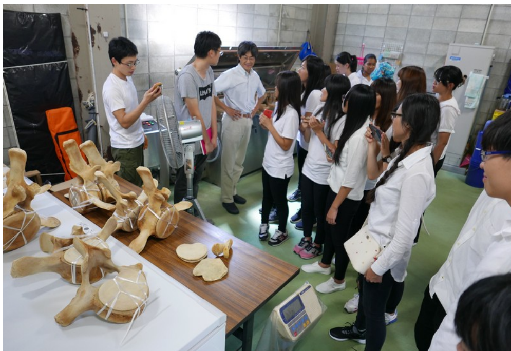
全體師生至長崎大學水產部參訪，至鯨魚樣本處理實驗室參觀