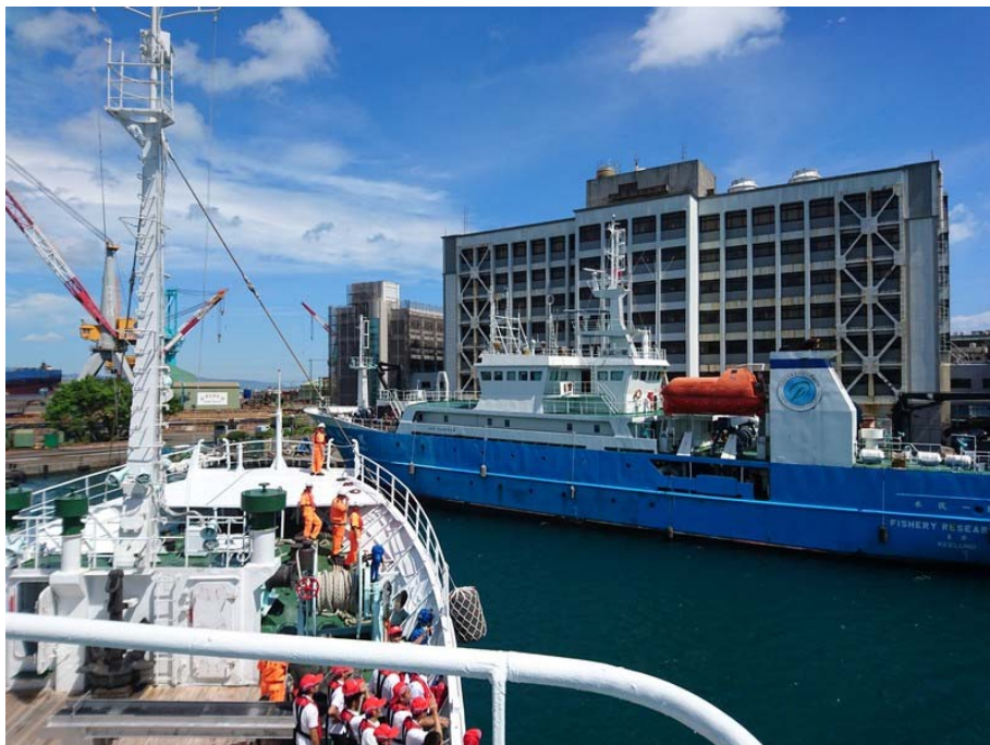
訓練船返抵基隆水試所碼頭