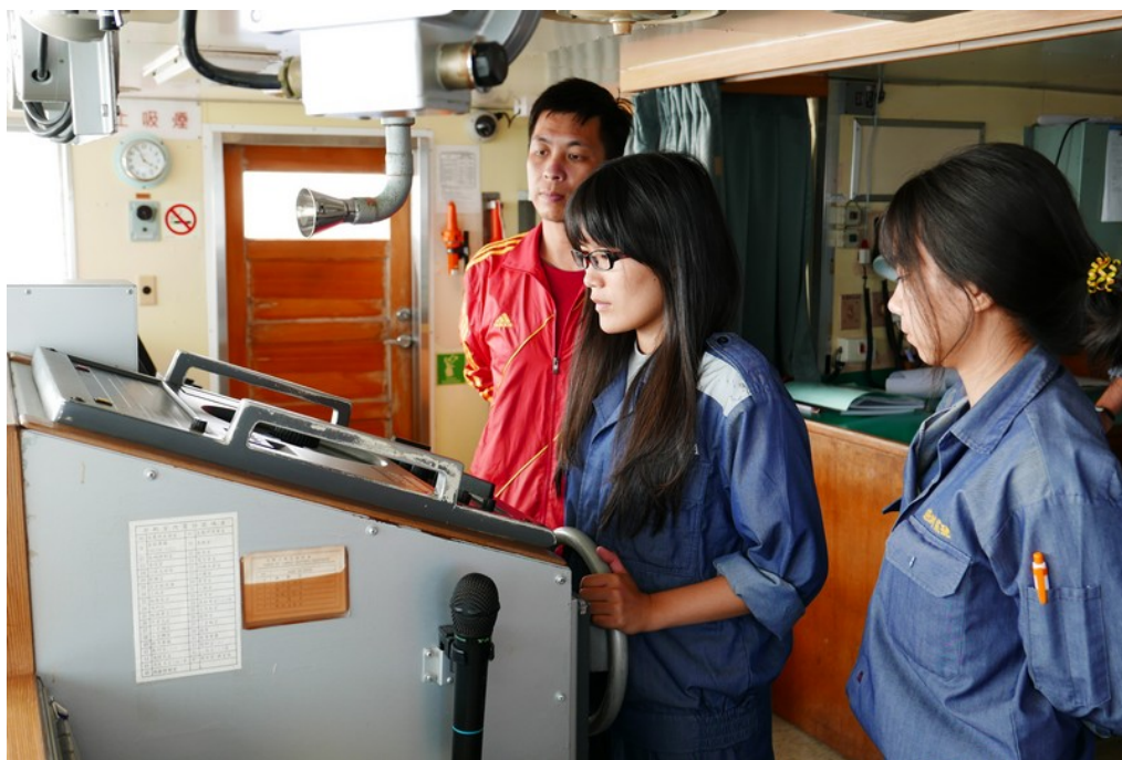
長崎進出港操舵班 4 位同學於進港前進行舵令與操船練習(4)