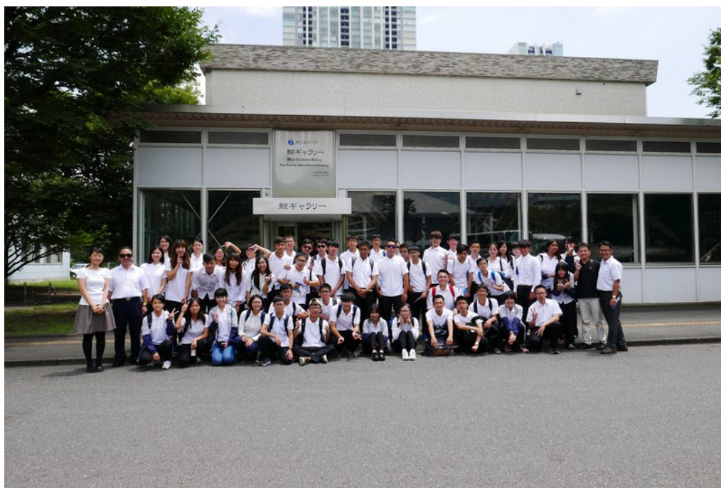
參訪東京海洋大學全體師生合影留念