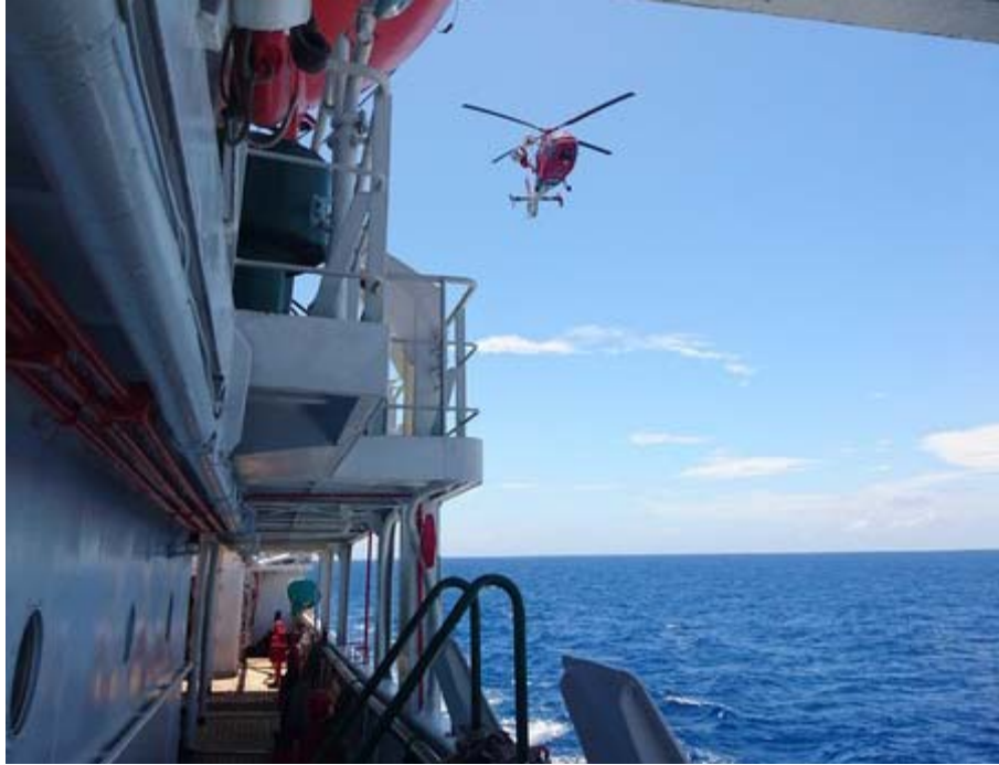
空中警察隊直昇機抵達訓練船位置進行學生送醫救援