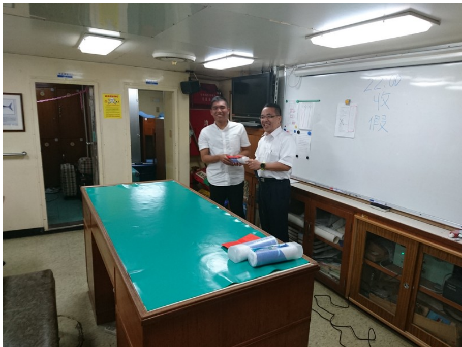
頒發去程航程訓練表現優異同學 - 第一名