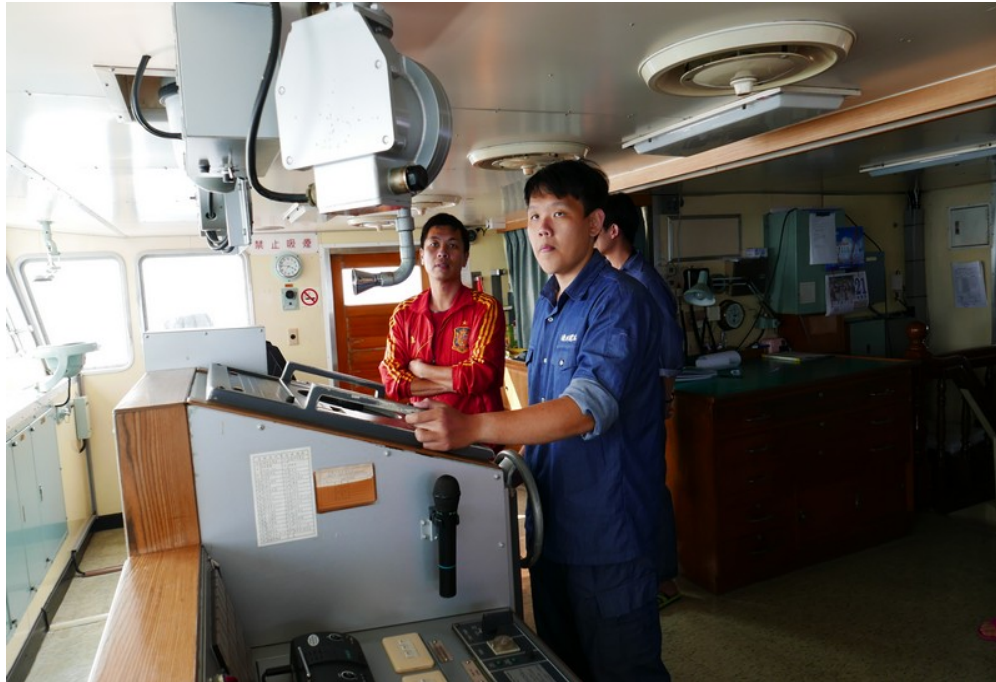
長崎進出港操舵班 4 位同學於進港前進行舵令與操船練習(2)