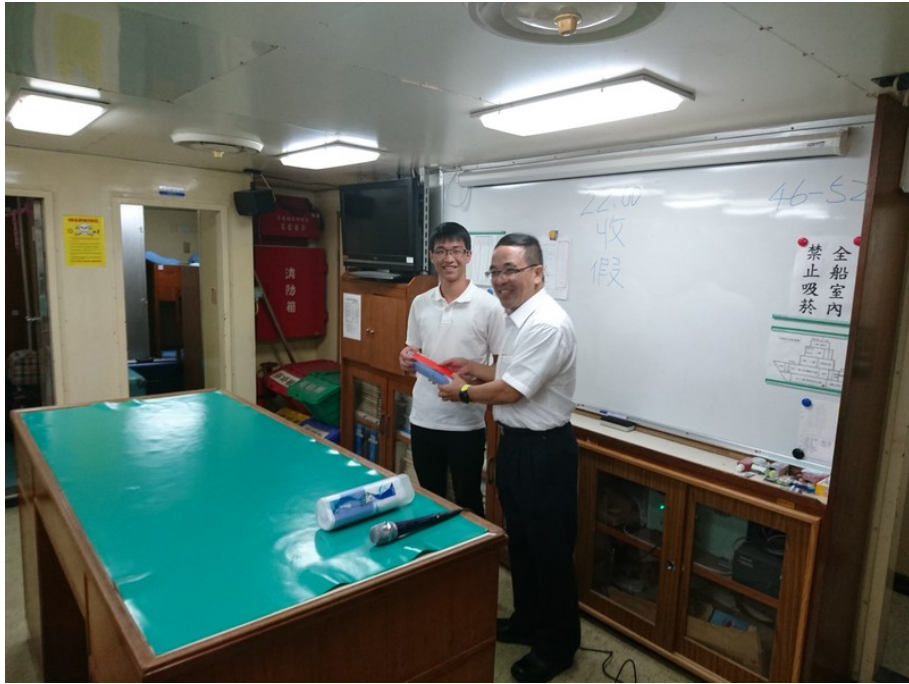
頒發去程航程訓練表現優異同學 - 第二名