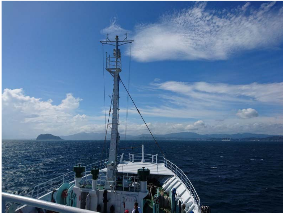
訓練船駛抵基隆海域