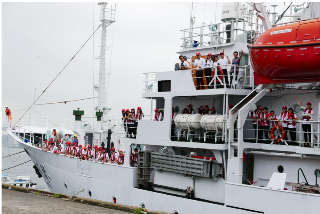
漁訓二號訓練船停靠於東京豐州碼頭