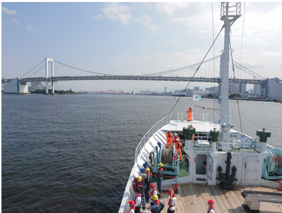
訓練船駛離東京豐州碼頭，所有船上幹部與學員作出港部署