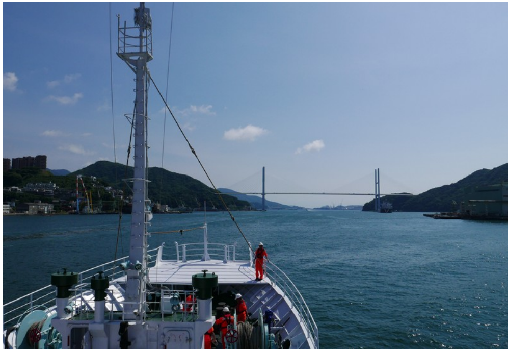
訓練船駛離長崎港