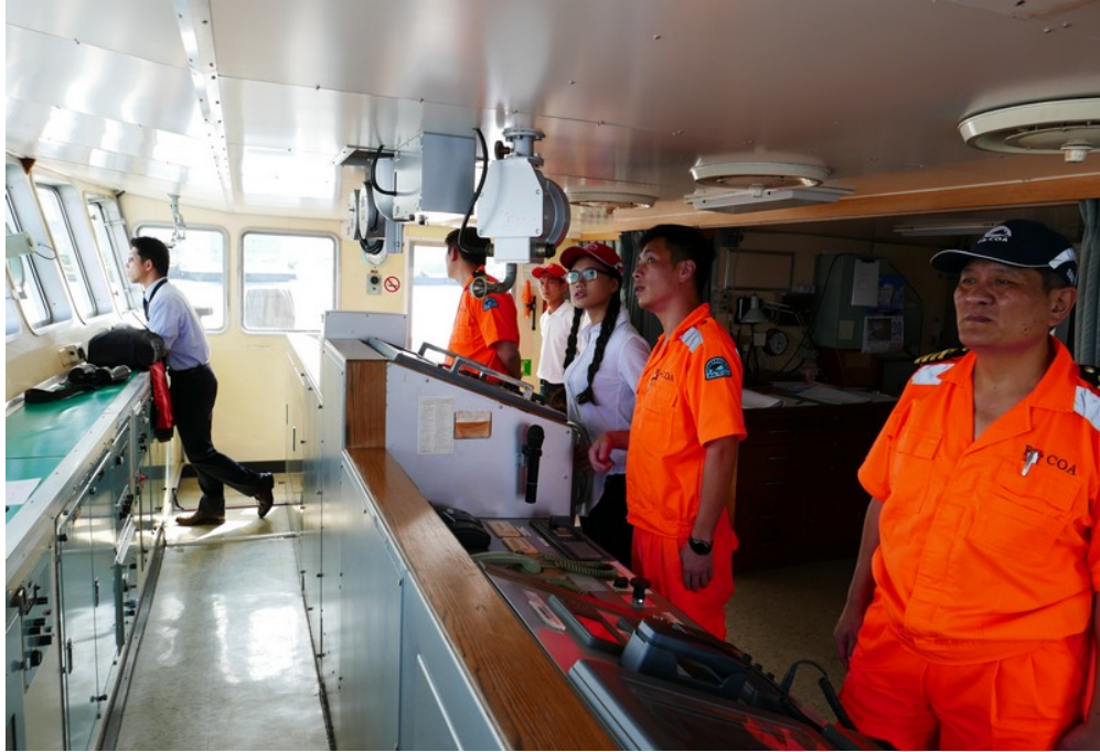
東京灣出港操舵班同學在領港指揮下進行操舵實作(1)