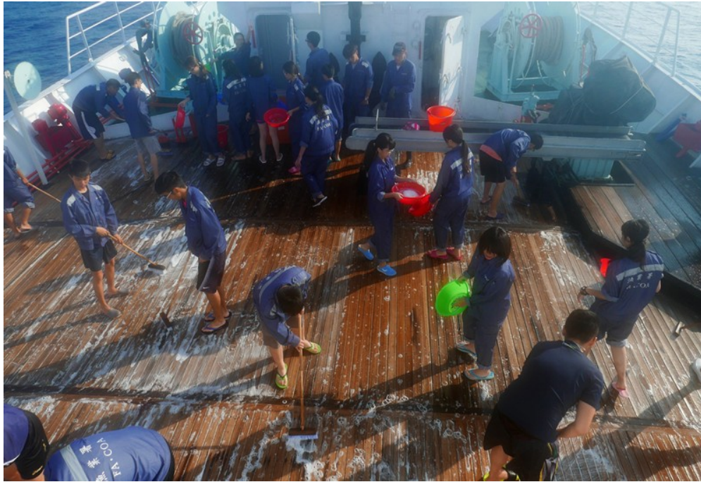
學員全體參與船體保養