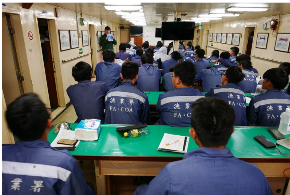
海上航行程中所安排之訓練課程(船舶通信簡介)