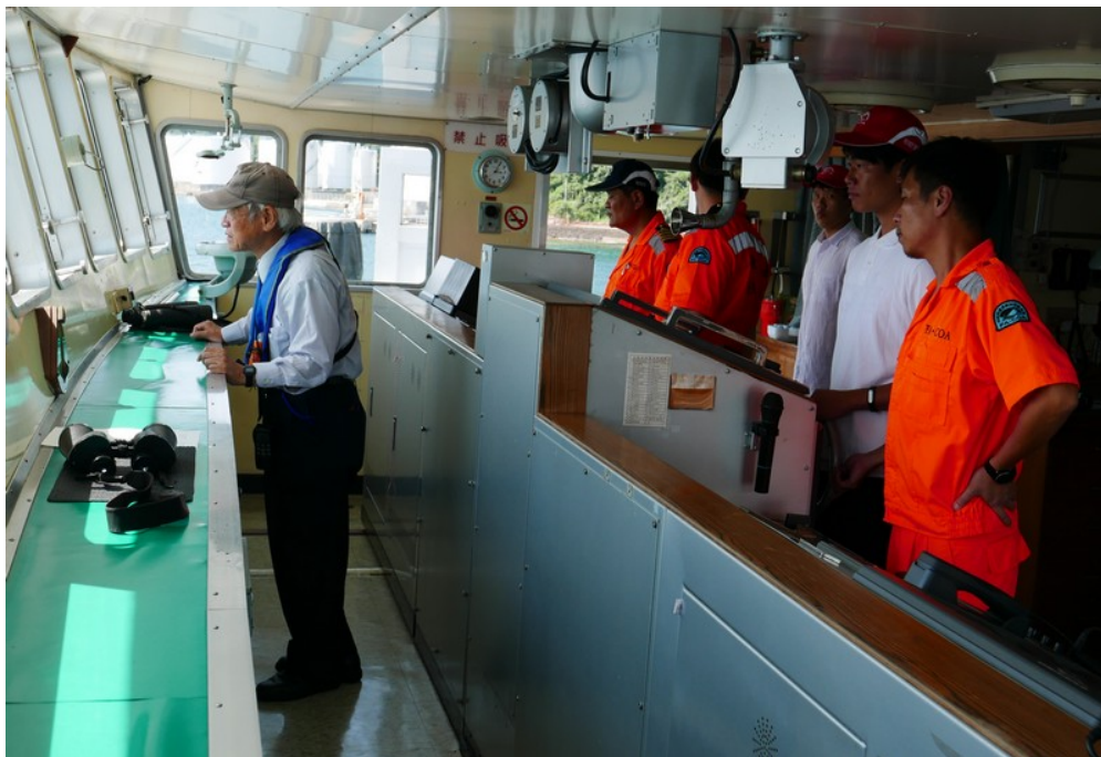
長崎出港操舵班同學在領港指揮下進行操舵實作(2)