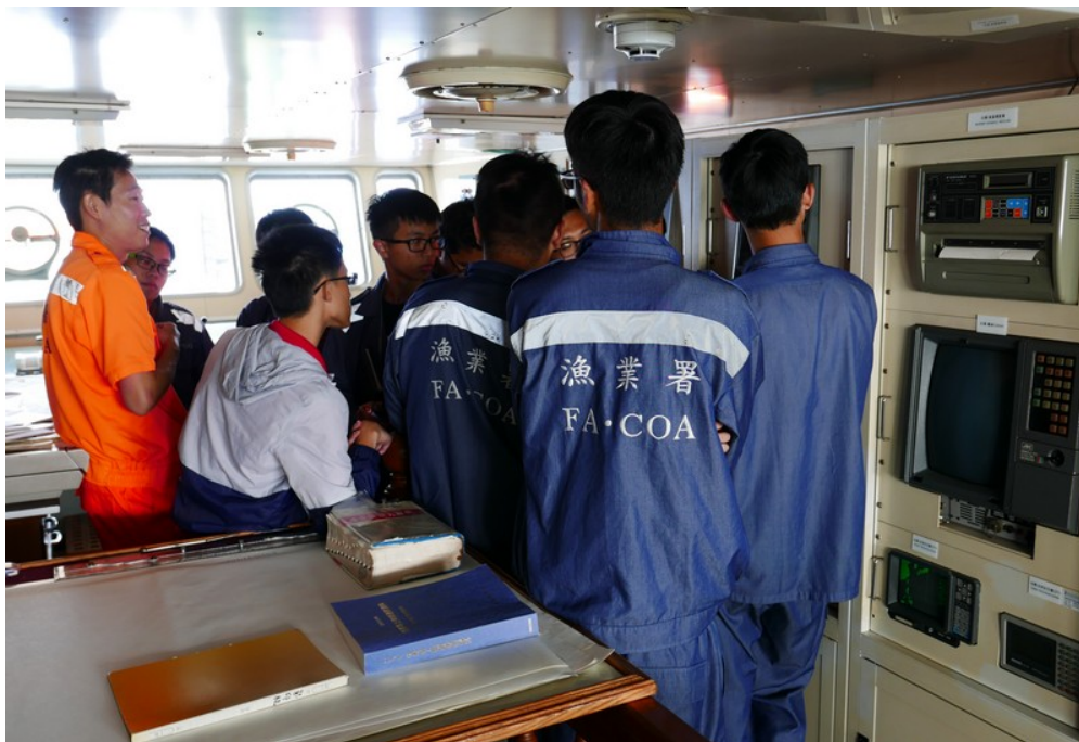
海上航行程中所安排之訓練課程(漁探機與潮流計等設備說明)