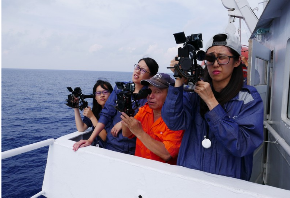
海上航行程中所安排之訓練課程(六分儀操作訓練)