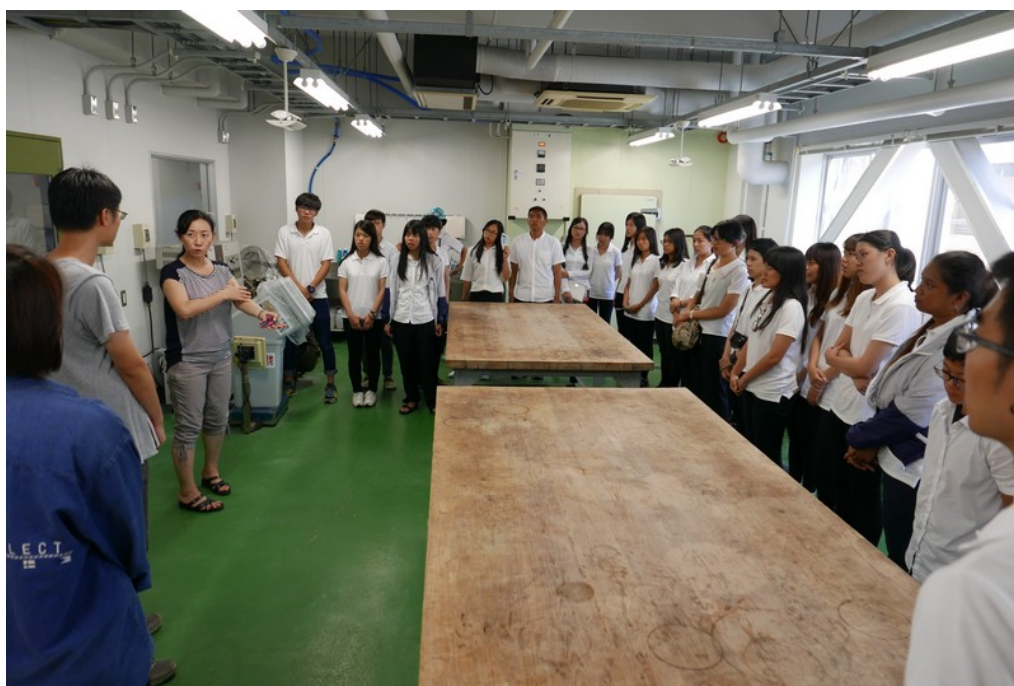
全體師生至長崎大學水產部參訪，至水產食品加工實驗室參觀