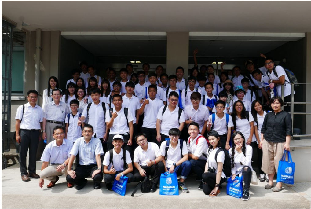
本次訓練航程全體師生與長崎大學水產部接待教授們合影留念