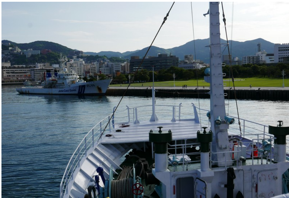
訓練船駛入長崎港準備停靠出島觀光碼頭