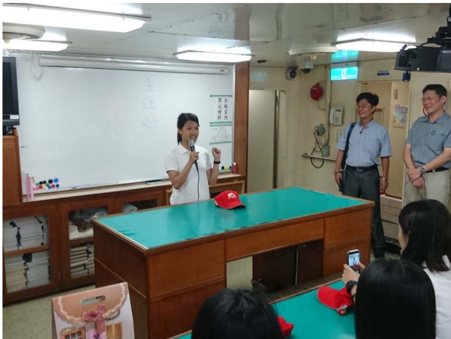
結訓典禮由學生代表發表心得感言(2)