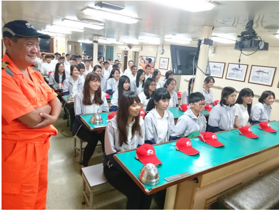
全體學員集合迎接各位師長