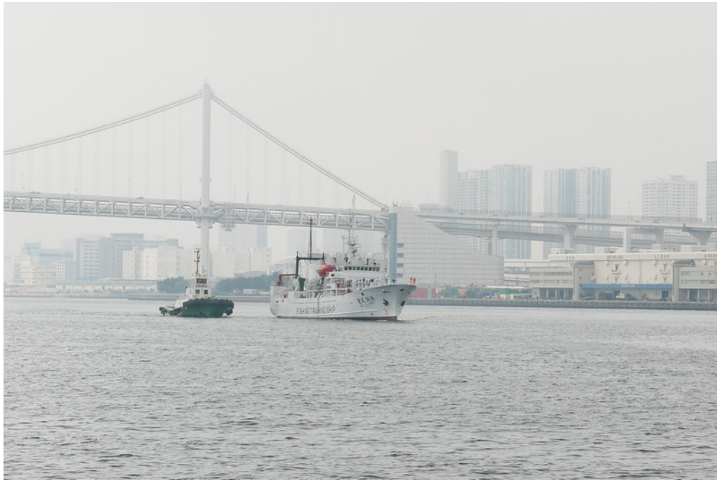
漁訓二號訓練船駛進東京灣