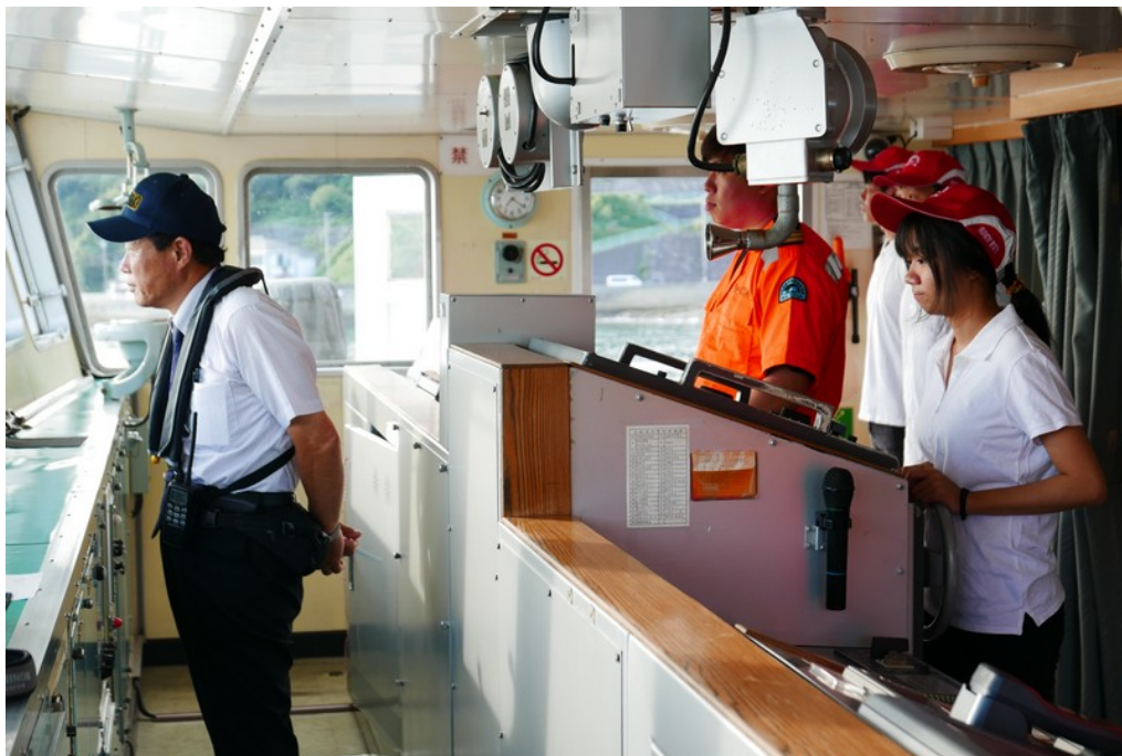
長崎進港操舵班同學在領港指揮下進行操舵實作(1)