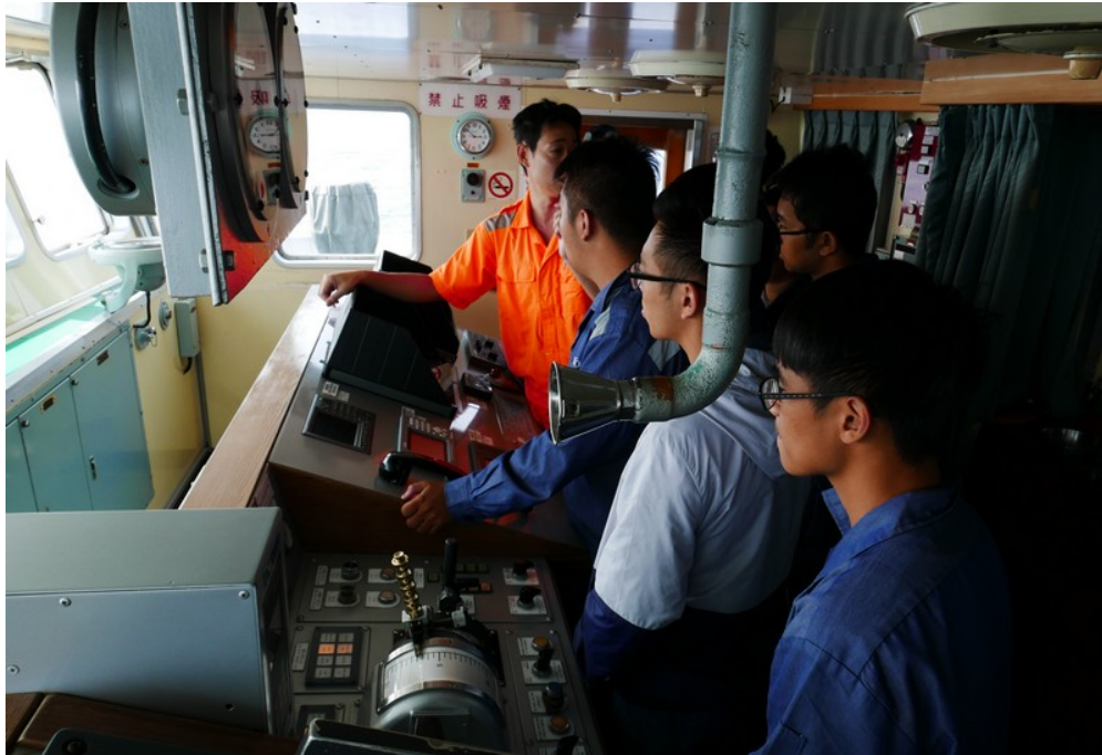
海上航行程中所安排之訓練課程(操舵與避碰雷達設備說明)