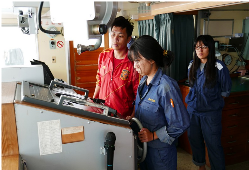
長崎進出港操舵班 4 位同學於進港前進行舵令與操船練習(3)