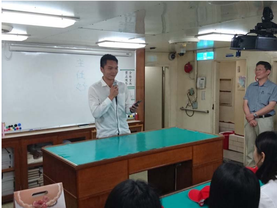
結訓典禮由學生代表發表心得感言(1)