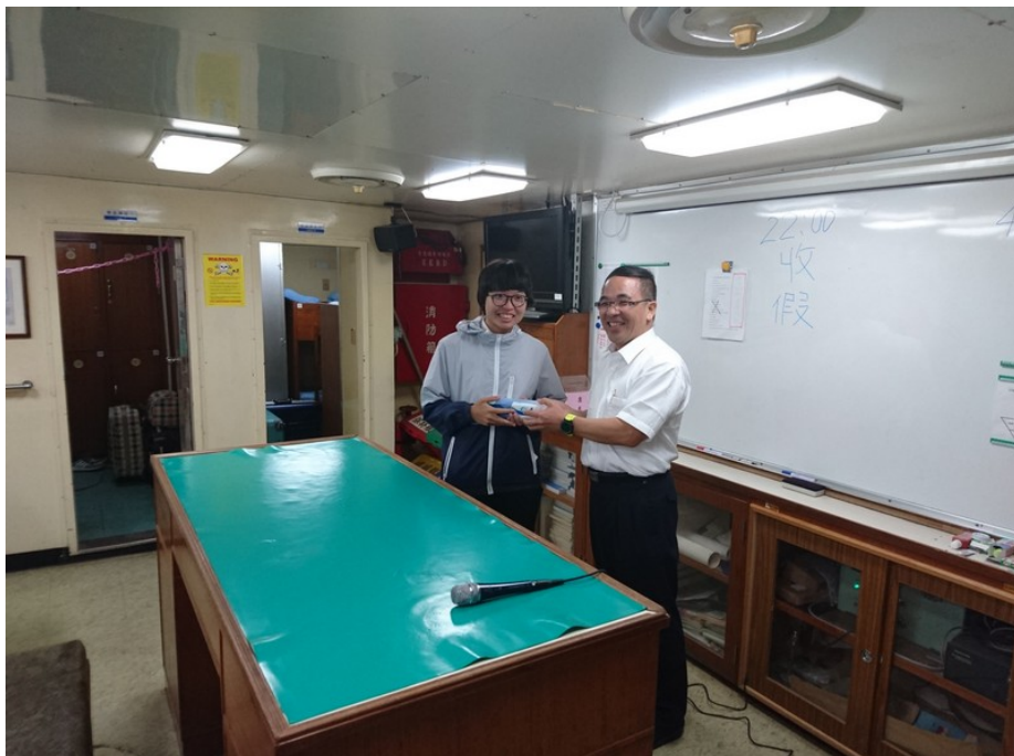
頒發去程航程訓練表現優異同學 - 第三名