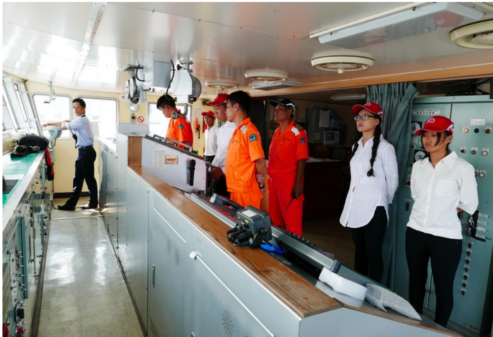
東京灣出港操舵班同學在領港指揮下進行操舵實作(2)