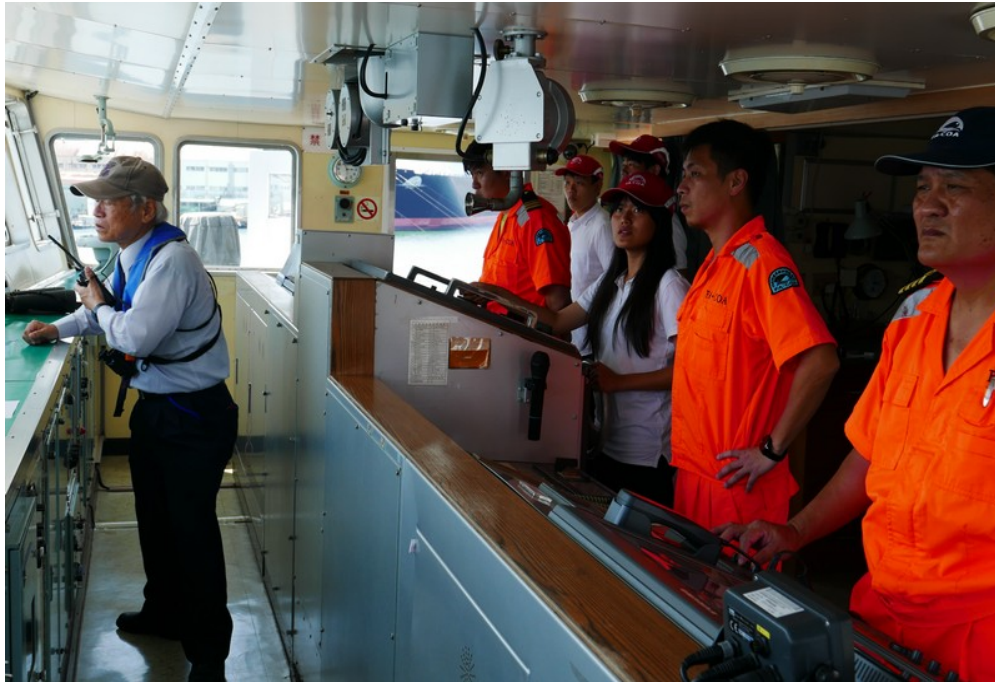
長崎出港操舵班同學在領港指揮下進行操舵實作(1)