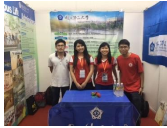
與畢業校友及新進經濟系僑生於日新獨中合影。