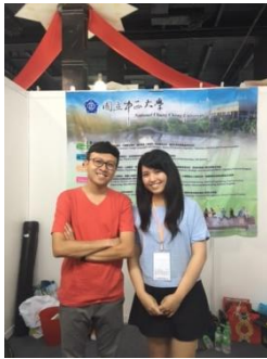
本校生科系畢業校友亦到展場給予支持、協助。