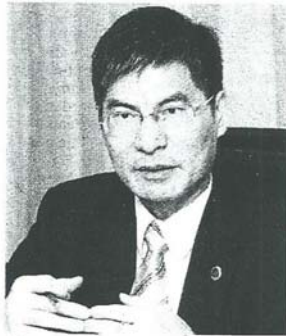
Chen: Taiwan's Education Ministry is keen to reach out through its programmes for a broader outlook.

in Chinese," he says, adding that post-graduate courses are normally conducted in English.