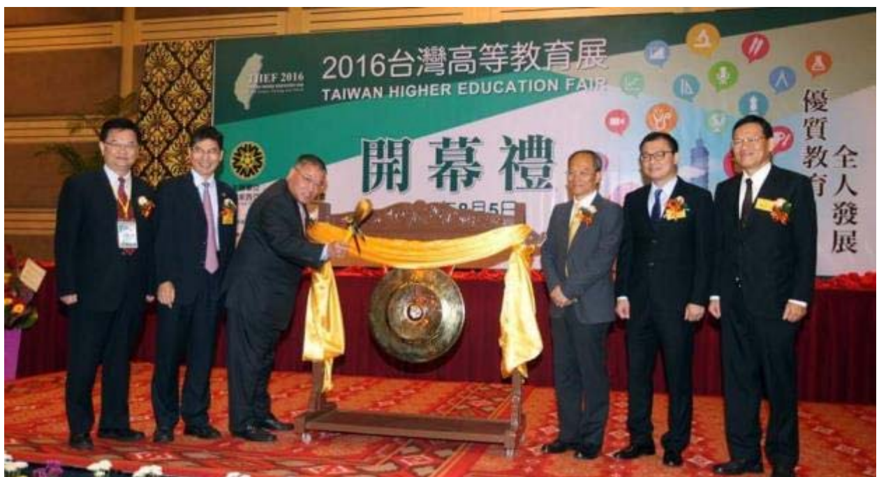
左起：海外聯招會主任委員蘇玉龍校長、教育部陳良基政務次長、馬來西亞首相東亞特使拿督斯里張慶信局紳、僑務委員會吳新興委員長、留臺聯總方俊能會長與駐馬來西亞臺北經濟文化辦事處章計平大使，共同主持開幕儀式