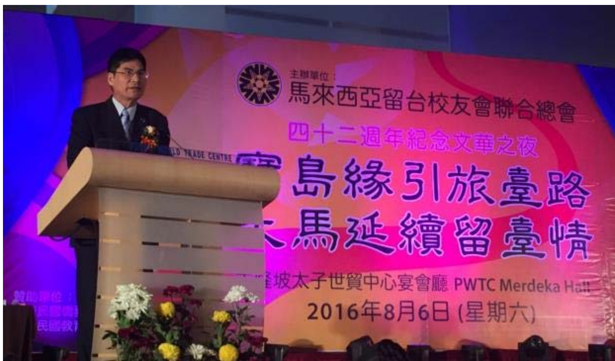
陳良基政務次長應邀於文華之夜活動致詞