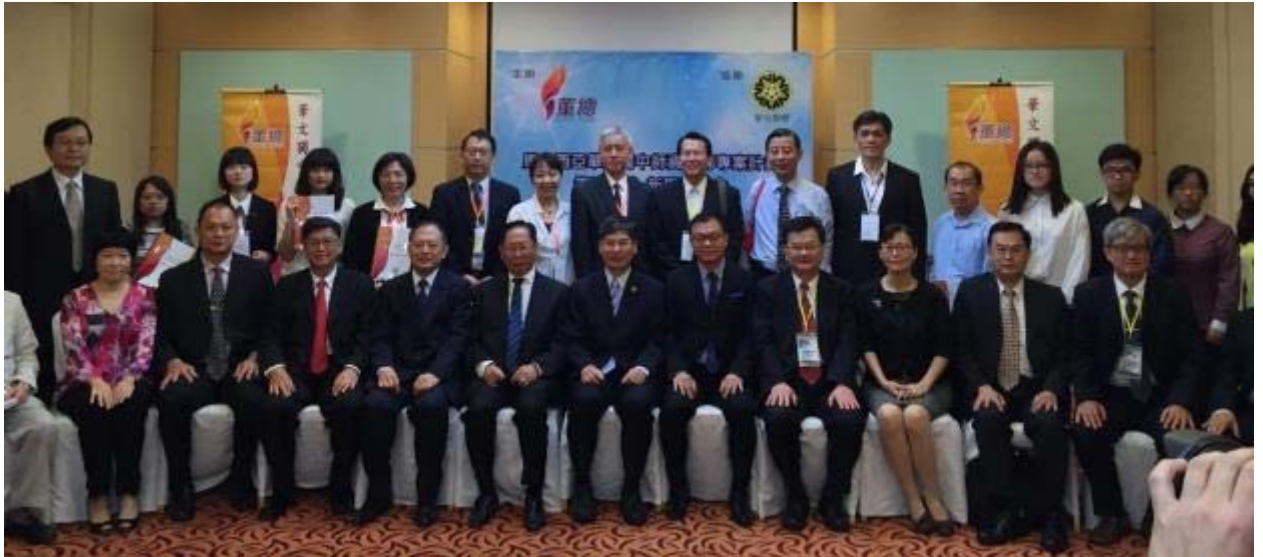
陳政務次長（前排右 6）與參加簽約儀式之大學校院代表、董總幹部合影留念