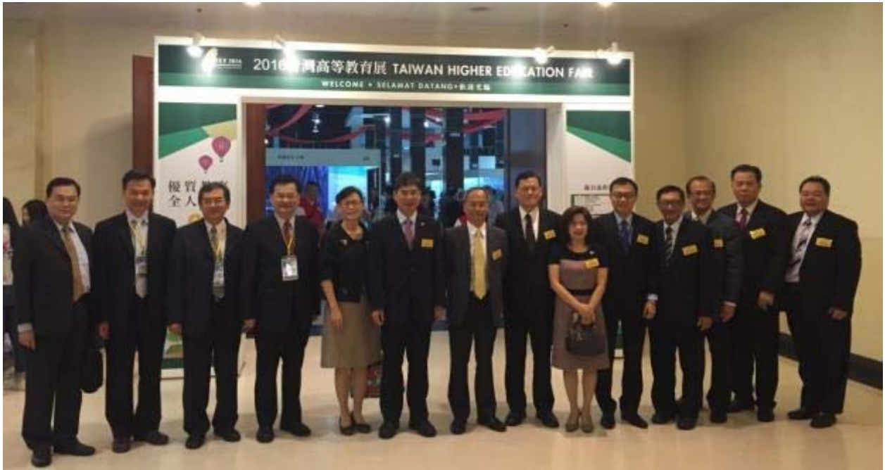
陳政務次長（左六）與臺灣各大專校院代表、留臺聯總幹部共同前往 2016 高等教育展會場參觀