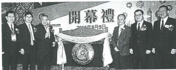
↑ 2016 马来西亚台湾高等教育展正式开幕，吸引大量人潮，估计会超过1万5000人次。