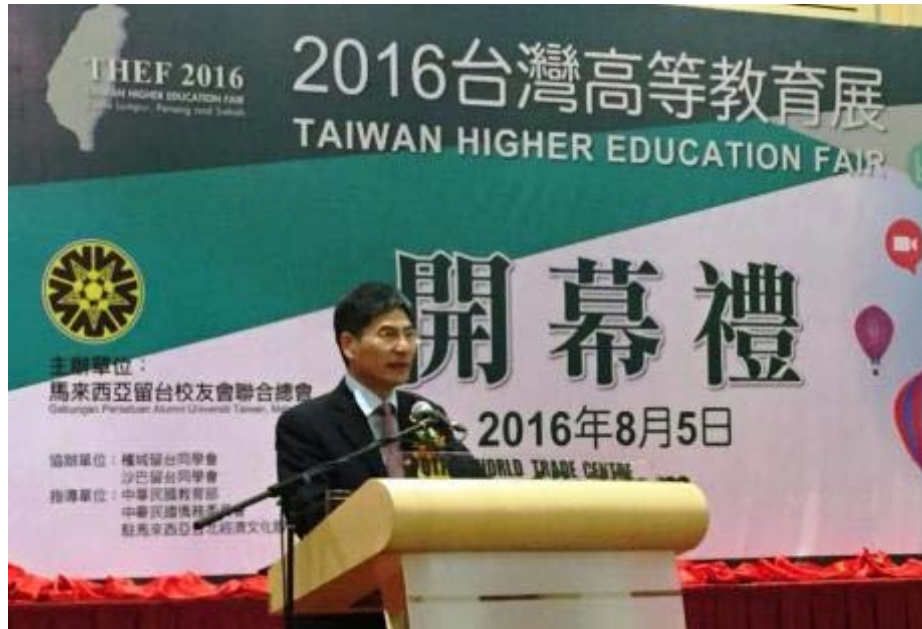
陳政務次長應邀擔任 2016 年臺灣高等教育展開幕致詞嘉賓

策」，推動人才培育及鼓勵優秀外國學生來臺攻讀學位，教育部下學年度提供給東協 10 國及印度學子的「臺灣獎學金」將倍增，陳政務次長並當場宣佈，提供給馬國學生的「臺灣獎學金」新生名額將自現行之 20 名提高到 30 名，現場所有聽眾均報以熱烈掌聲表示歡迎。