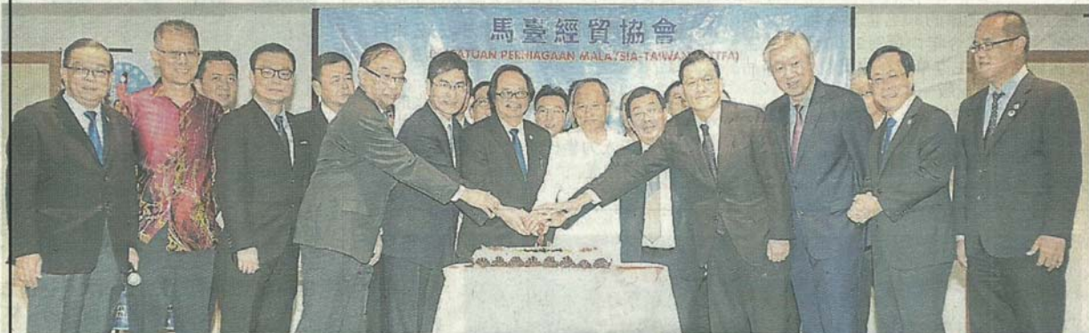
■馬台經貿協會成立2周年，理事與嘉賓一同切蛋糕，前排左起為徐忍川、張永泉、方俊能、方貴倫、陳良基、陳榮立、吳新興、陳國偉、章計平、盧成全、陳榮洲及黃耀佳。

出席者包括台湾侨务委员长吴新兴、教育部政务次长陈良基、行动党代主席陈国伟和总财政方贵伦、中总总书记拿督卢成全、马来西亚台湾商会联合总会副总会长张永泉、隆雪华堂会长拿督翁清玉、留台联总总会长方俊能，以及该协会顾问拿督陈荣洲、会长拿督斯里陈荣立、副会长拿督黄耀佳和秘书长准拿督徐忍川。