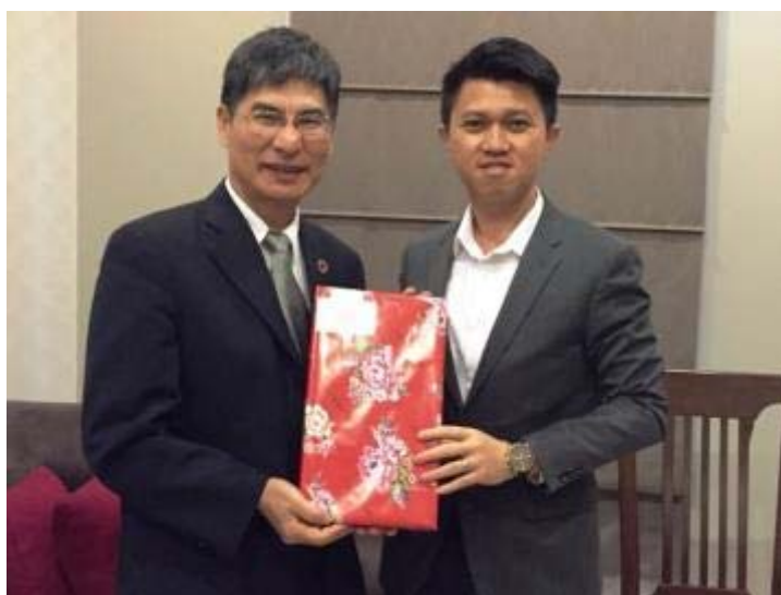
陳良基政務次長（左）致贈紀念品予馬來西亞教育部張盛聞副部長