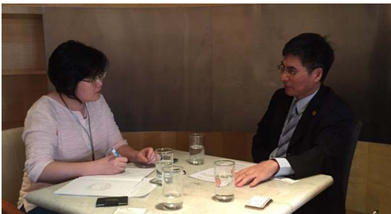
陳政務次長（右）接受星洲日報記者吳珍妮採訪

另一方面，為了配合東南亞地區廣大學生的學習需求，教育部近年也將推出以英文授課的短期技術訓練課程「外籍青年技術訓練班」，讓不諳華語的學生也有機會來臺參加技術進修。陳政務次長專訪於 8 月 14 日於該報刊載，對宣傳我國高等教育特色有相當助益。