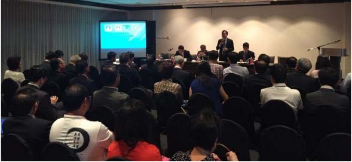
陳政次政務次長與留臺聯總、臺灣大專校院代表座談