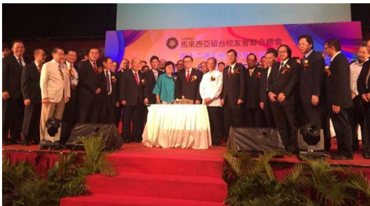
陳政務次長（前排左四）與馬來西亞婦女部周美芬副部長（藍衣者）、留臺聯總方俊能會長（前排右七）、僑委會吳新興委員長（白衣者）共同主持「留臺聯總創會 42 週年文華之夜」切蛋糕儀式