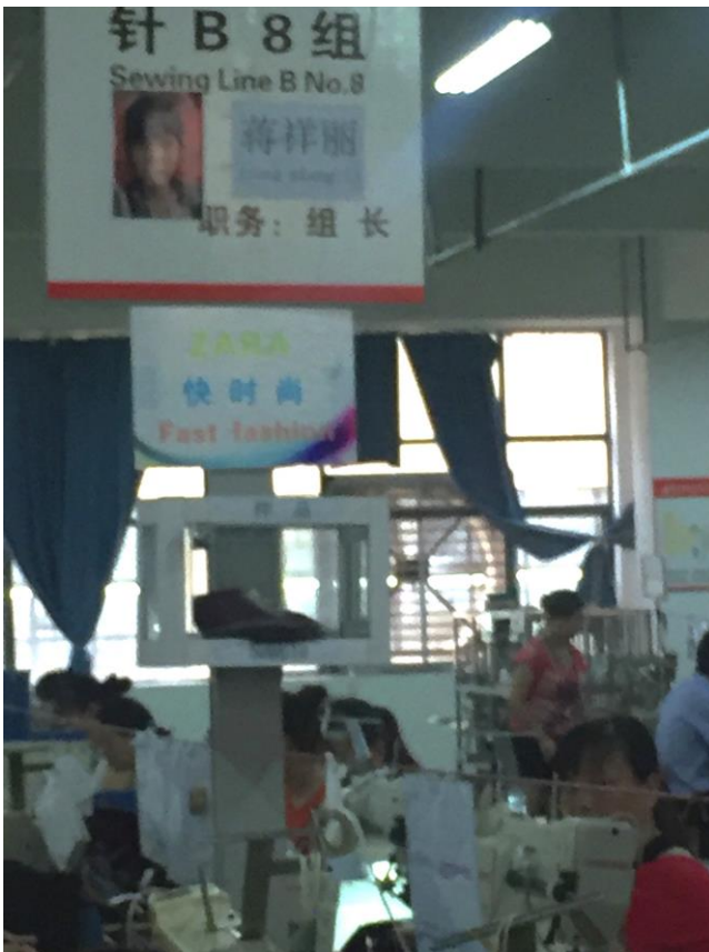
註：華景鞋業生產線參觀