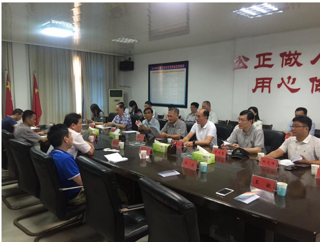
註：永修縣政府座談