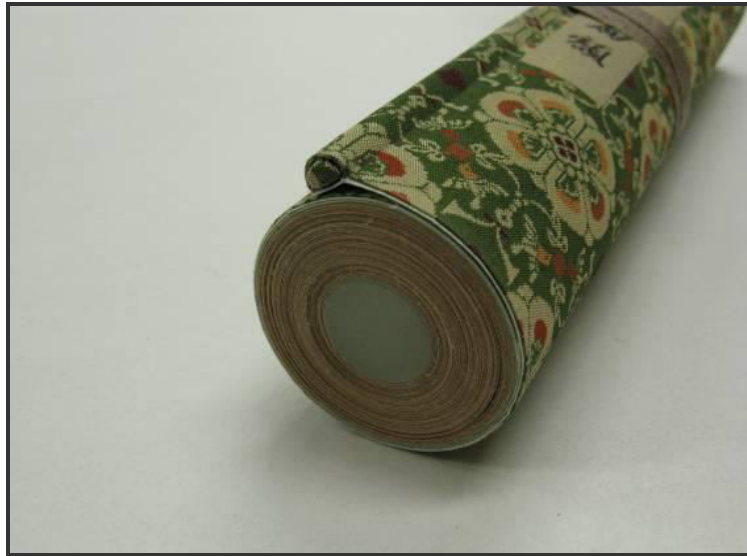
圖九 中式手卷樣貌