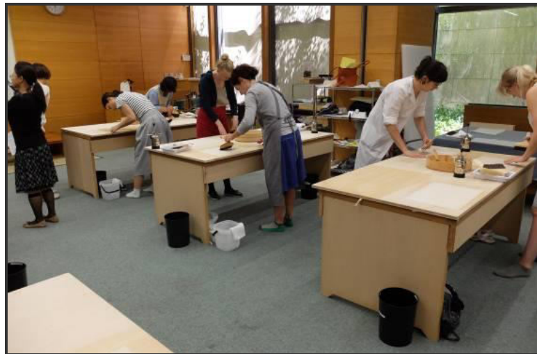
圖三 學員實作情形

目前日本書畫修復還維持著傳統和式工作環境，會以「跪坐」的方式操作，因考量國外學員不易於短時間內習慣，實作時會改站立方式進行，但可在聽解教師示範時，短暫體驗和式的工作模式。