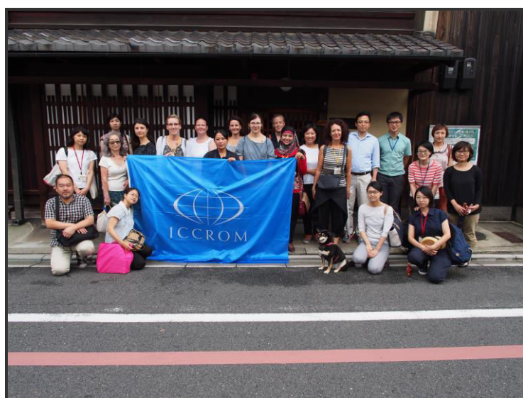
圖五 學員於岡墨光堂前留影

最後，走訪建造於江戶初期的二條城(Nijojo)，城內的御殿已部分被日本列為國寶及重要文化財，其中和式的「障壁画」多達 954 面，繪畫藝術相當豐富，日本的庭園風格在此也能細細品味。1994 年已被 UNESCO 登錄世界遺產。