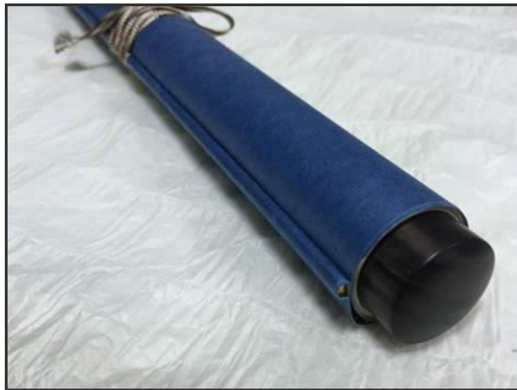
圖八 日式手卷樣貌

手卷地杆的處理方式，日式會於兩側末端安裝軸頭，地杆長度會寬於畫幅，類似於掛軸的安裝(圖八)；以清陳澧行楷書扁額為例(國立故宮博物院藏)，中國明代後的手卷地杆多以圓玉片替代軸頭，地杆整體寬度會與畫幅一致，卷收後的側邊外觀與日式有顯著之差別(圖九)。