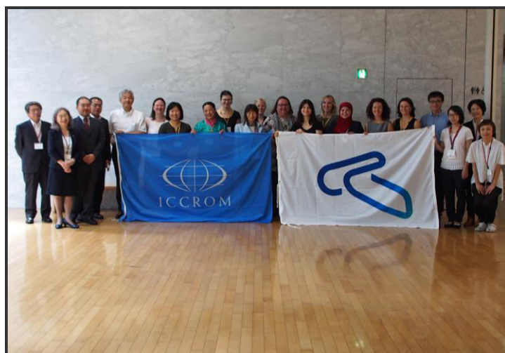
圖一 開幕式學員合影

5. 「日本傳統工藝技術的保護現況與變遷」(Protection of Craft Techniques: present condition and transitions)：由於傳統工藝正在快速的凋零，1954年起日本立法建立「重要無形文化財」來加以保護，包含陶藝、染織、漆藝、金工、木竹、人形、手漉和紙等，皆已列入無形文化財的保護範圍。