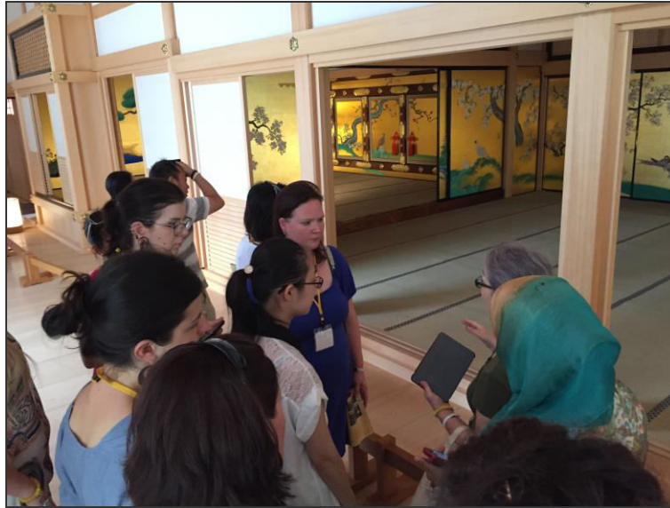
圖四 解說名古屋城內「本丸御殿」的繪畫藝術

隔日參觀「紙的溫度」(Kami no ondo)，此店開發、販售各式加工和紙及進口洋紙，約有二萬種紙張商品。隨後參觀熱田神宮(Atsuta Jingu)，是日本最重要的神社之一，據說神宮內祭拜日本神話三神器之一「草薙劍」，供奉著代表權威和武力的神祇，學員們從此行程中學習日本的參拜儀式，體會日本文化風俗，及觀察神社優美的建築造型。