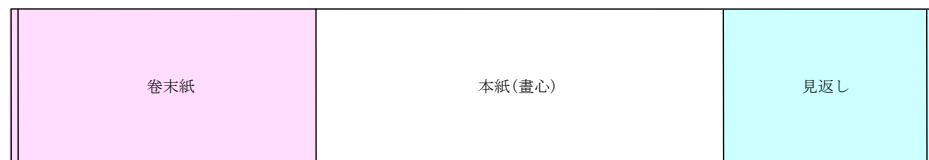
圖七 日式手卷裝裱結構