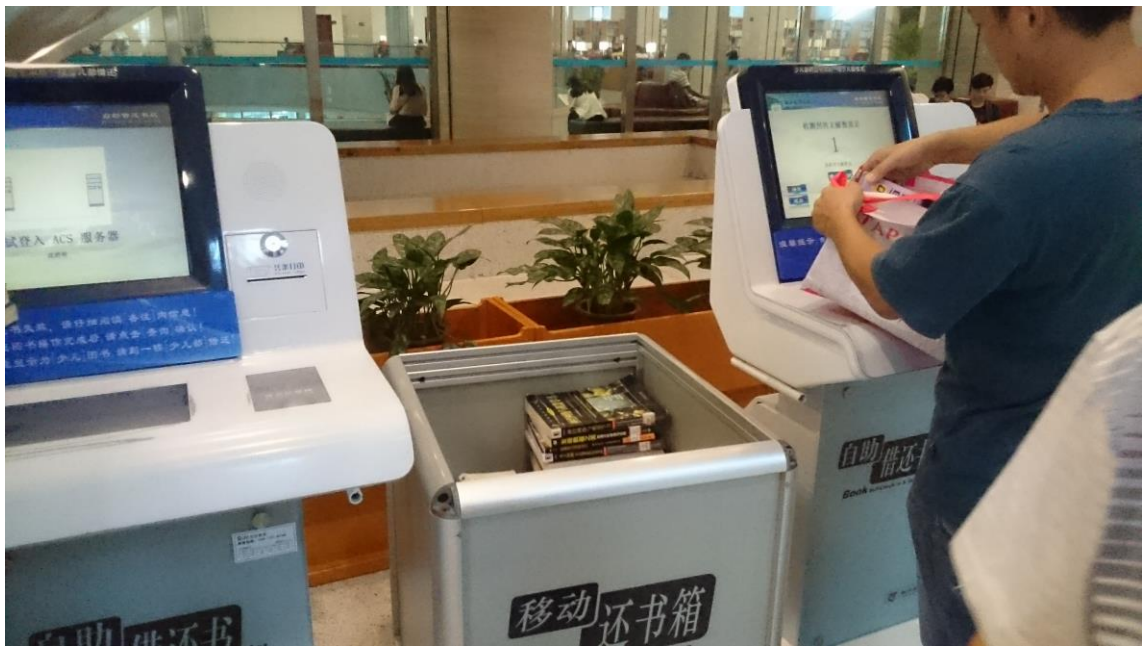
借書、還書全面自助化