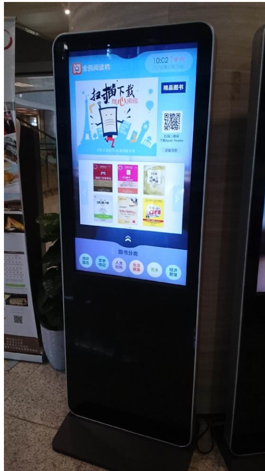
全民電子閱讀機，二維條碼掃描，手機立即閱讀電子書