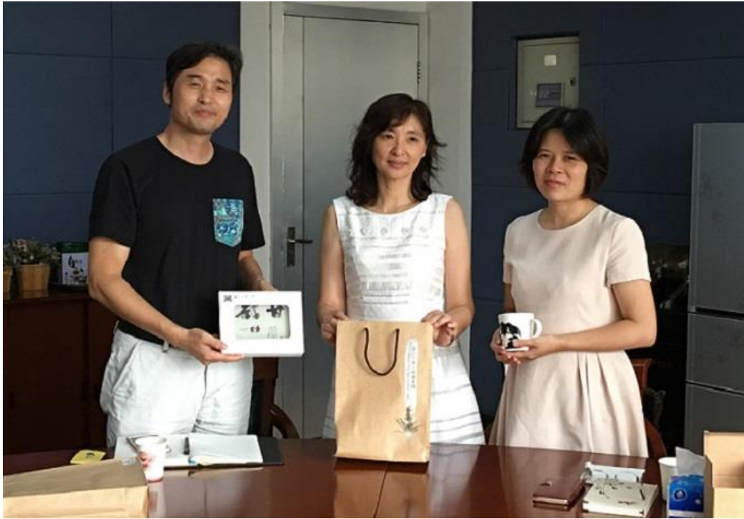
互贈出版物與紀念品