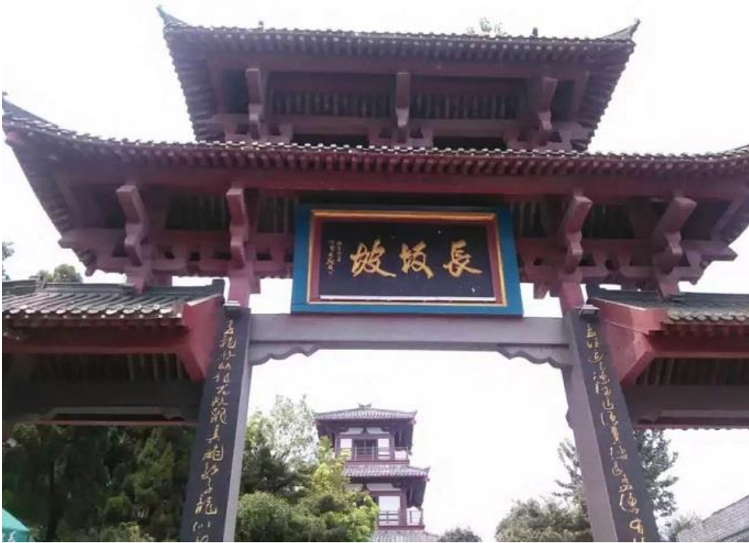
趙子龍單騎救主，張翼德大鬧長坂坡