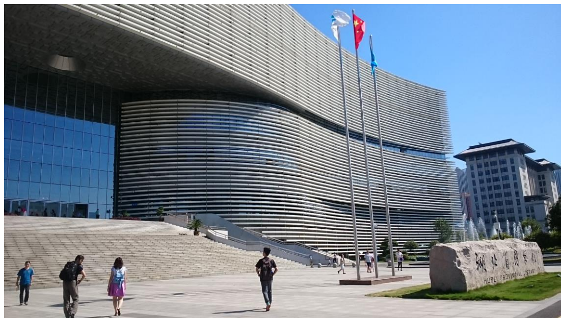
湖北省圖書館正門

本次交流營，華中農業大學圖書館特別帶領本館館長與點閱組組長參觀湖北省圖書館新館。湖北省圖書館新館址位於洪山區沙湖地區，主體建築為地上 8 層，地下 2 層，總建築面積 10 萬平方米，屬一類高層建築，可藏書 1000 萬冊，日接待能力達 1 萬人次，辦證借還全程自助。投入使用時為中國單體建築面積最大的省級圖書館。新館於 2012 年 12 月 8 日正式對外開放，試運行期間僅向讀者開放地下一層至三層。