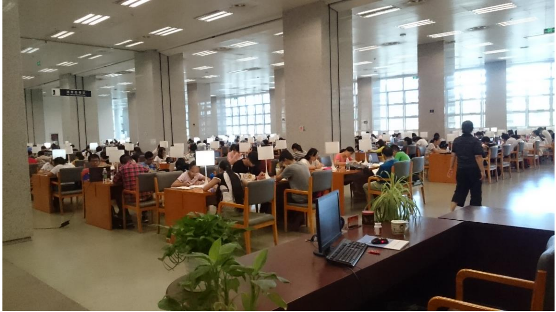
自習室檯燈便利人民