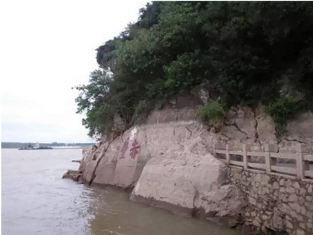
【詩歌赤壁】 念奴嬌·赤壁懷古 蘇軾