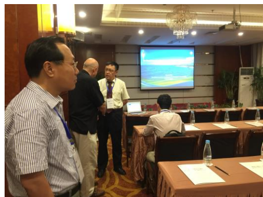
(b) 研討會議程 1