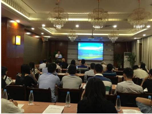
(c) 研討會議程 3