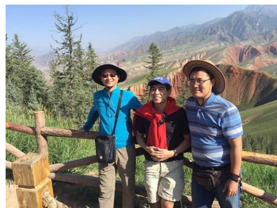
(b) 參訪行程 2