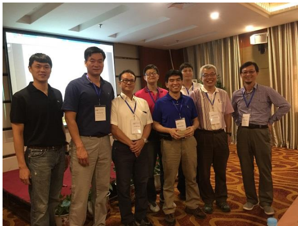
(e) 研討會與會學者 1