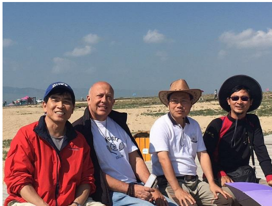
(a) 參訪行程 1

八月六日至八日參與研討會舉辦的三日參訪行程，分別參訪 Tar Lamasery and Riyue Mountain (塔尔寺，日月山)、Qinghai Lake (青海湖)與 Qianlian Mountain (祁连山)等景區，如圖 4 (a)~(b) 所示。