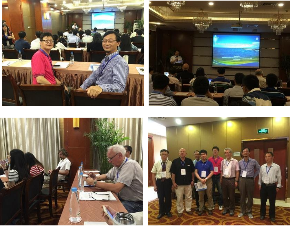
圖 2 IMS2016 國際研討會於西寧市 Xing Ding An Hotel (兴鼎安大酒店)

此次行程住宿旅店是研討會安排的兴鼎安大酒店，位於西寧市北郊，西寧市是一避暑度假的旅遊城市，住宿費用暑假旺季時相對昂貴，住宿資訊於網際網路上方便取得，部分旅店國際化與資訊化做的相當好。因此此次行程安排由蘭州市進出，一方面機票相對便宜較容易訂購，住宿也較便宜，另一方面蘭州市是大陸西部交通重鎮，可由鐵路連結到大陸各大城市。