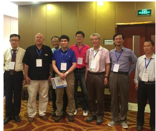
(f) 研討會與會學者 2