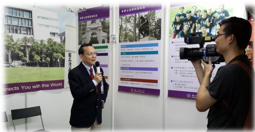
蔣副全球長於攤位受訪