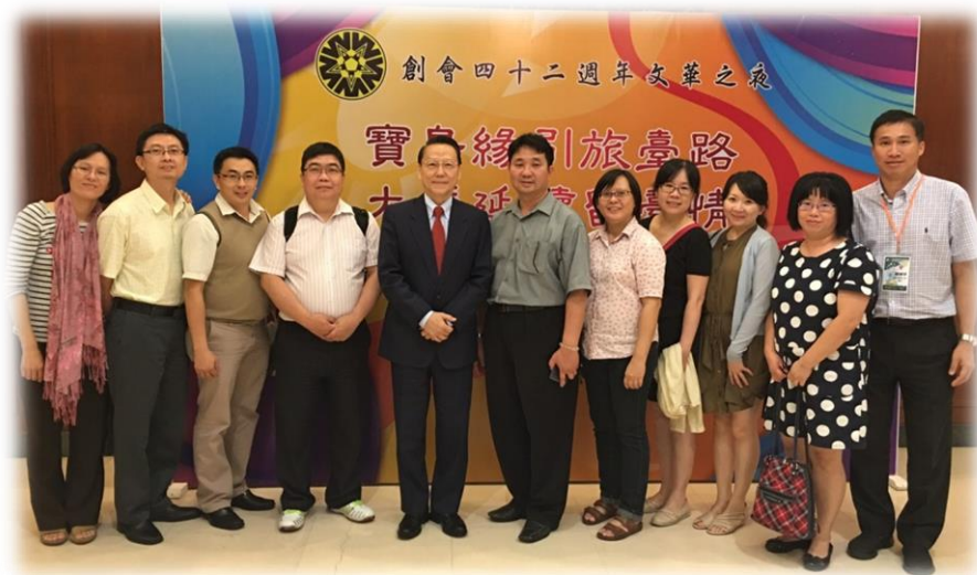
吉隆坡文華之夜與本校校友(中為蔣副全球長及高順發會長)相聚，合影留念