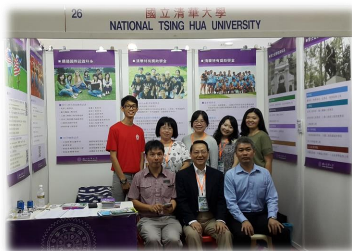
本校團員與在校工讀生(後排名)、即將入學新生(後排左)及前來協助之校友(前排左、右)合影(檳城場次)