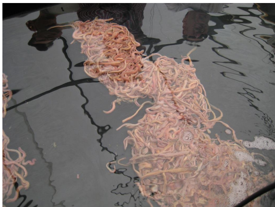
圖 11. 105 年 9 月 8 日參訪 Bribie Island Research Centre 海水養殖中心。