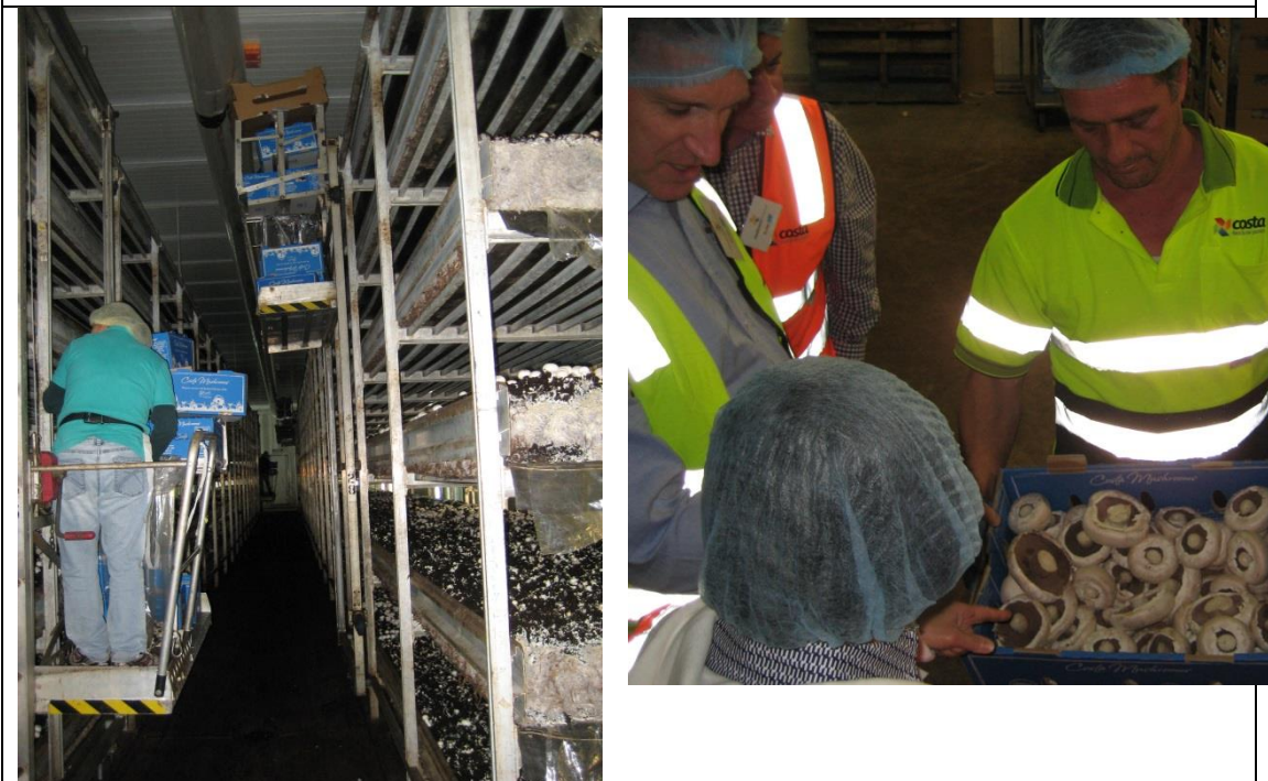
圖 6. 105 年 9 月 7 日參訪 Costa 公司-工人採收情形。