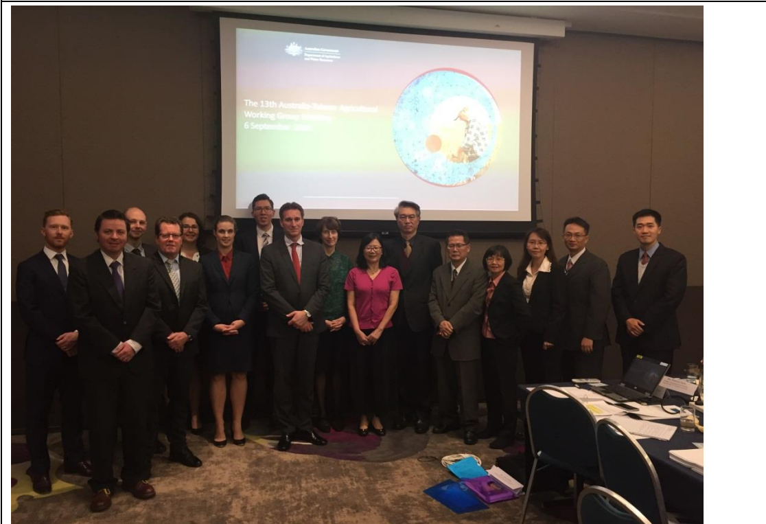
圖 4. 105 年 9 月 6 日於澳大利亞布里斯本召開第 13 屆臺澳農業合作會議。