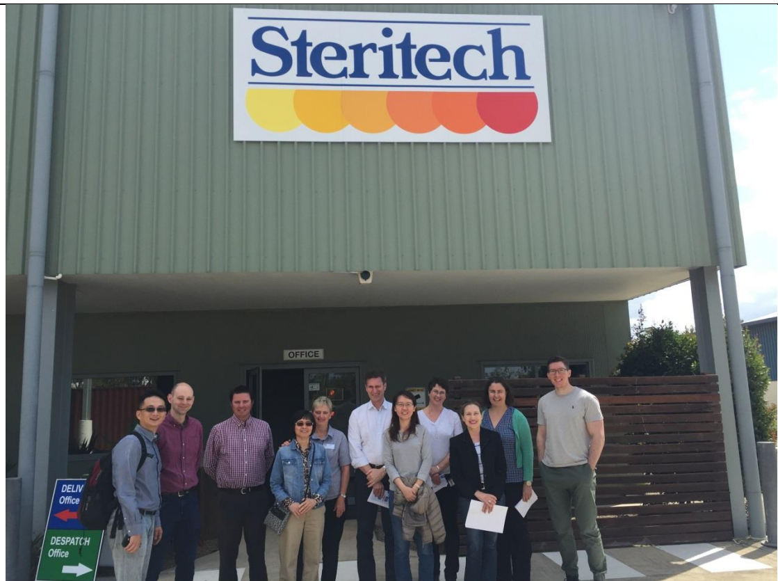
圖 8. 105 年 9 月 8 日參訪 Steritech 公司。