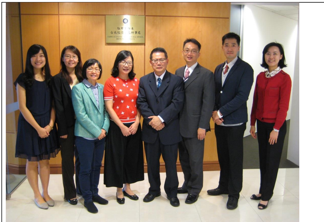
圖 1. 105 年 9 月 5 日拜會我駐布里斯本辦事處。