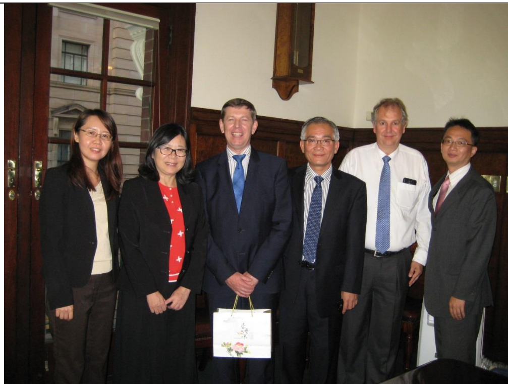
圖 2. 105 年 9 月 5 日與澳商 SunRice 公司會晤。