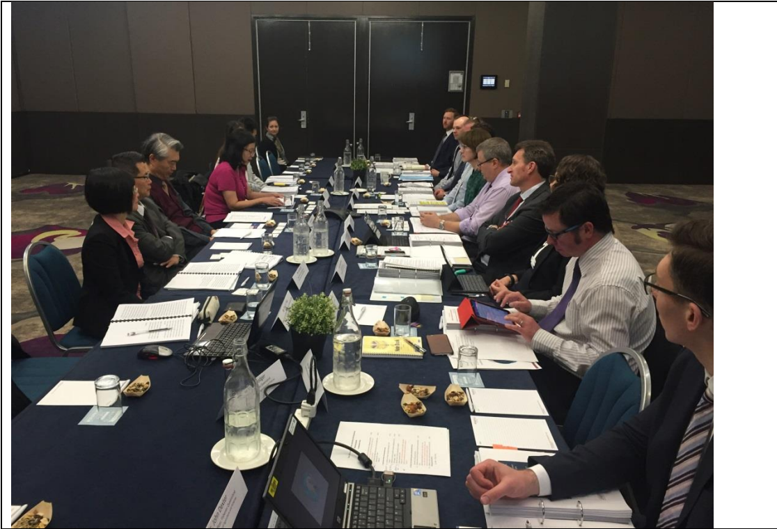
圖 3. 105 年 9 月 6 日於澳大利亞布里斯本召開第 13 屆臺澳農業合作會議。