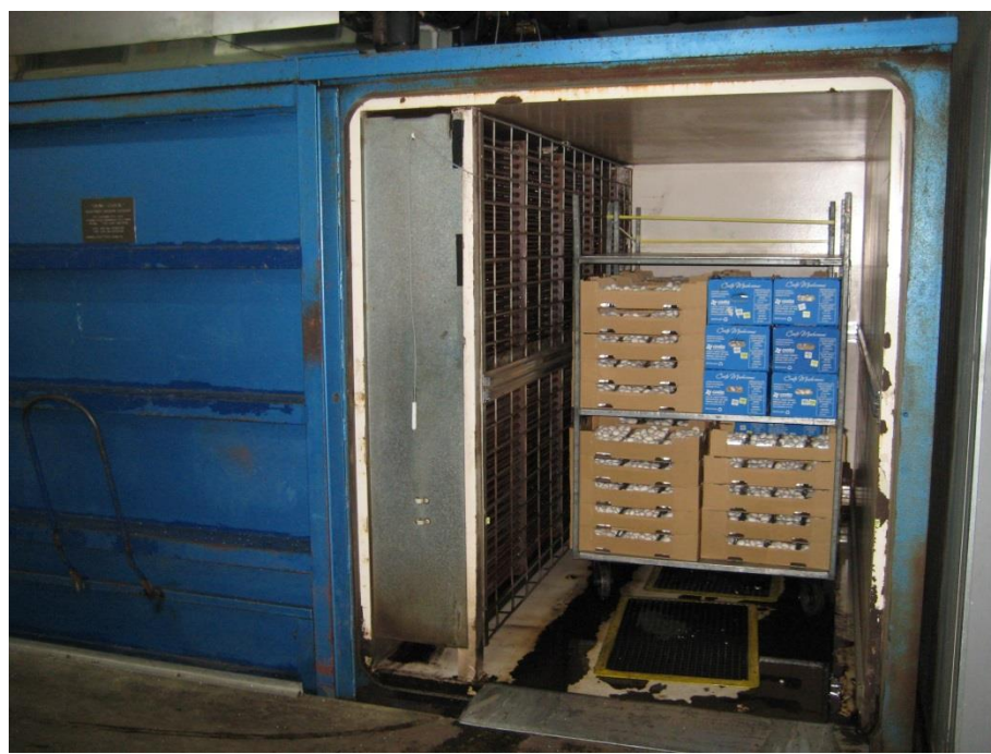
圖 7. 105 年 9 月 7 日參訪 Costa 公司-草菇採收後真空預冷處理情形。