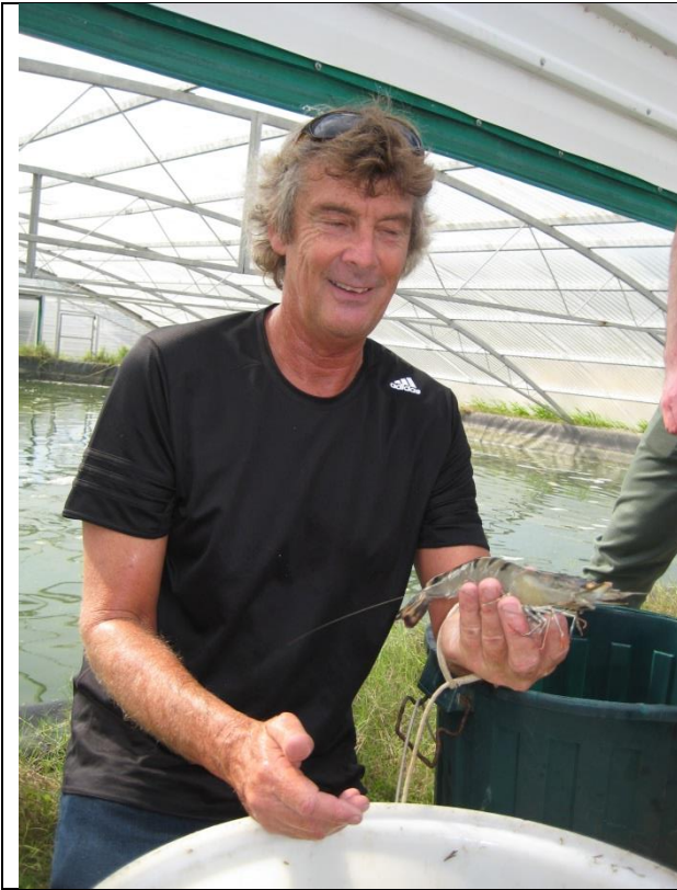
圖 9. 105 年 9 月 8 日參訪 Bribie Island Research Centre 海水養殖中心。