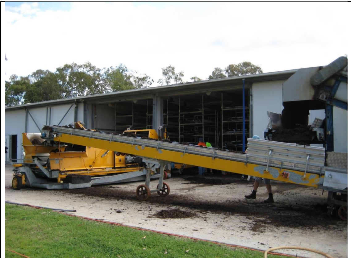
圖 5. 105 年 9 月 7 日參訪 Costa 公司-草菇栽培介質填裝情形。