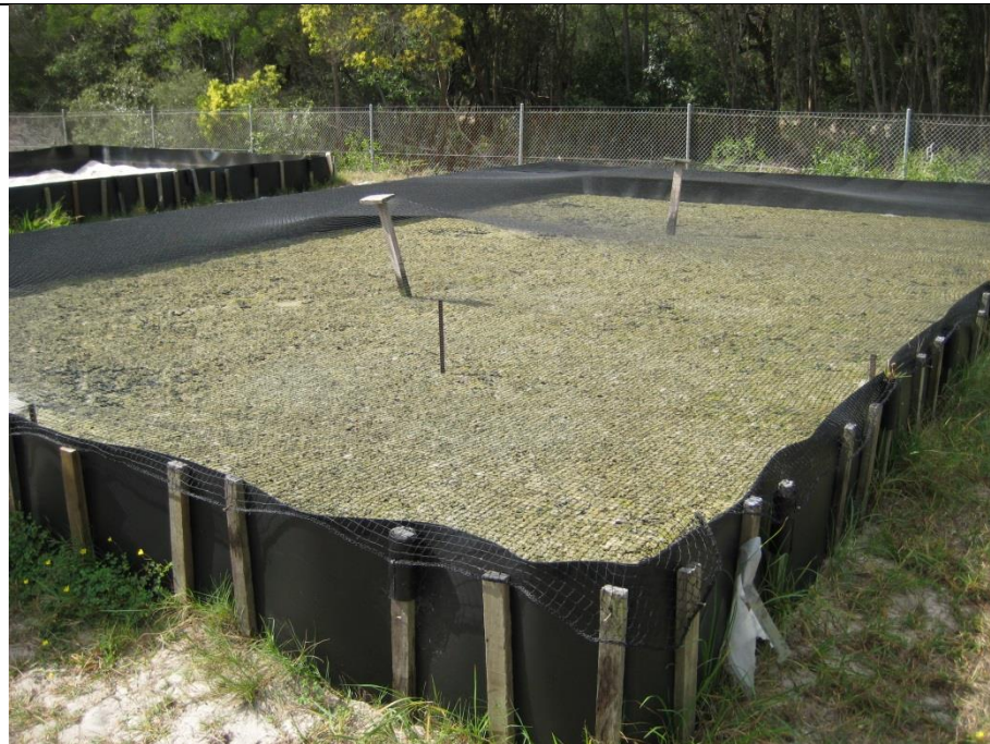
圖 10. 105 年 9 月 8 日參訪 Bribie Island Research Centre 海水養殖中心。