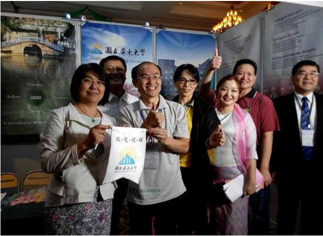
教育部楊司長蒞臨仰光教育展屏大攤位