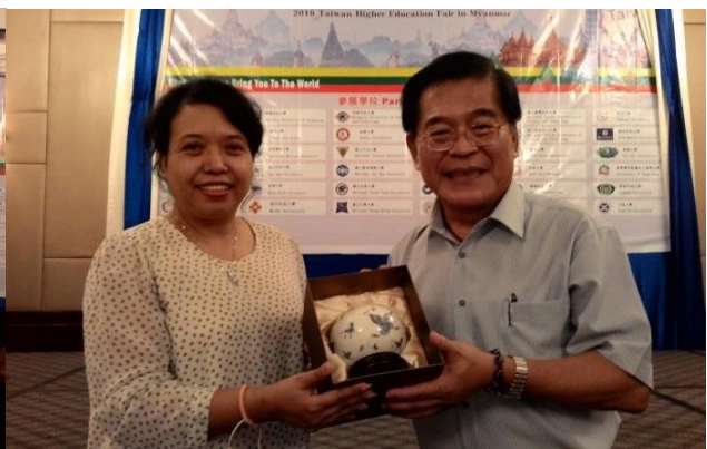
屏大致贈紀念品予曼德勒大學