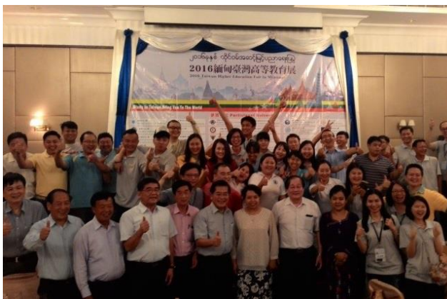
曼德勒晚宴代表團與曼德勒大學校長合影