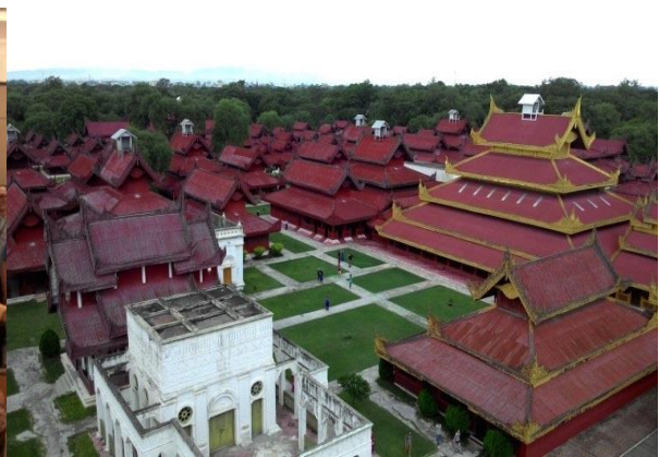
曼德勒古城文化參訪活動