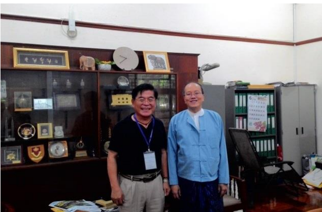
古校長與仰大校長 Pho Kaung 會談後留影