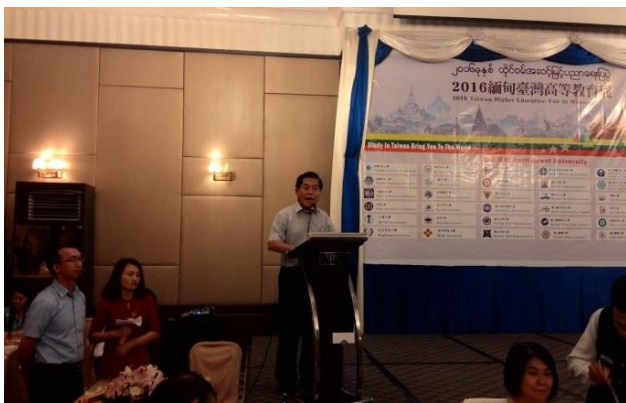
古校長於晚宴發表演說