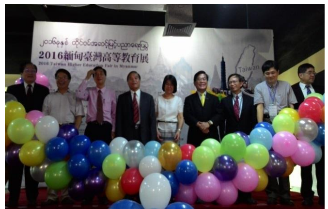
曼德勒場次教育展開幕式