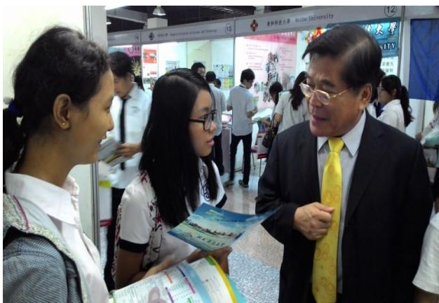
古校長親自於曼德勒場次教育展推銷屏大