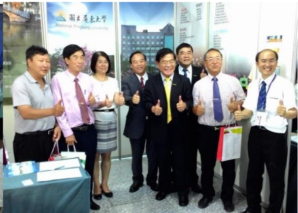
曼德勒場次教育展過程