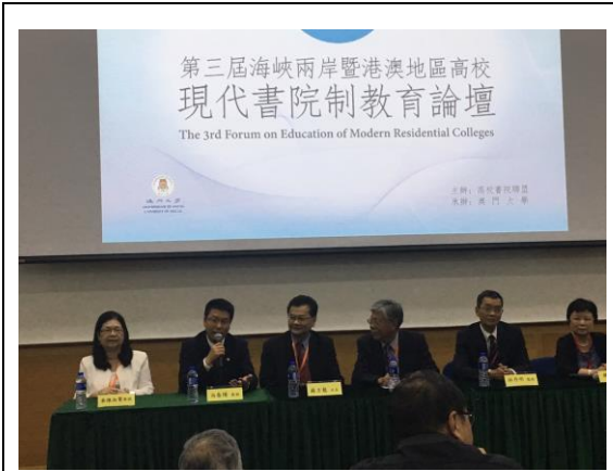
蘇校長致詞並作經驗分享