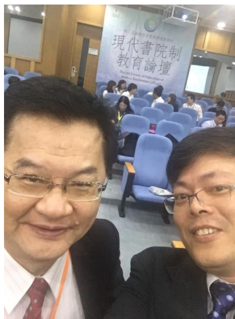
蘇校長與副教務長合影