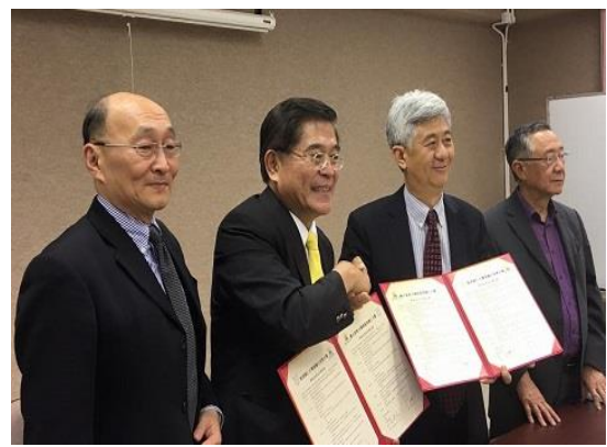
與樹仁大學締結姐妹校。