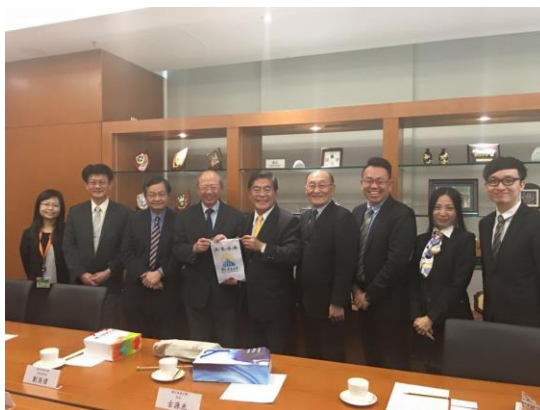
參訪團與香港中文大學師長合影。