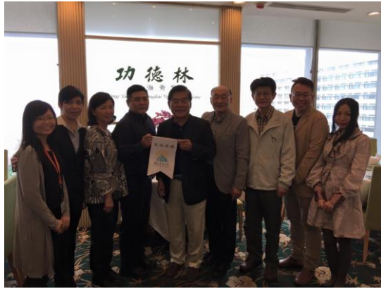
香港佛光道場午宴合影。