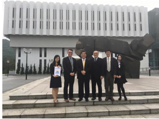
參訪團於香港中文大學合影。