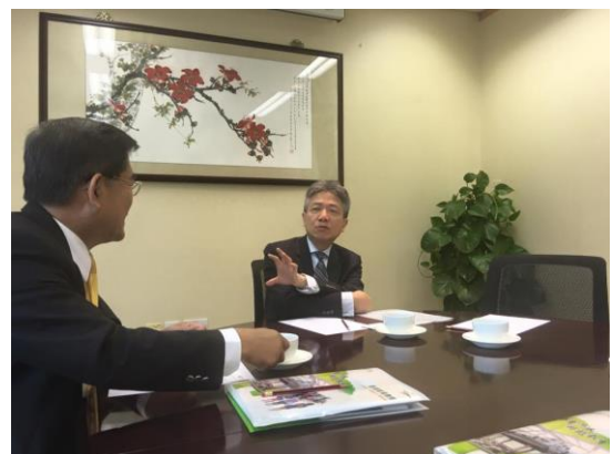
香港教育學院座談會。