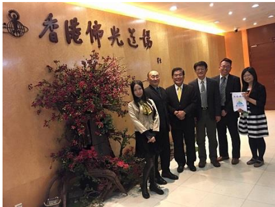
參訪團隊赴香港佛光道場進行中學校長招生座談會。