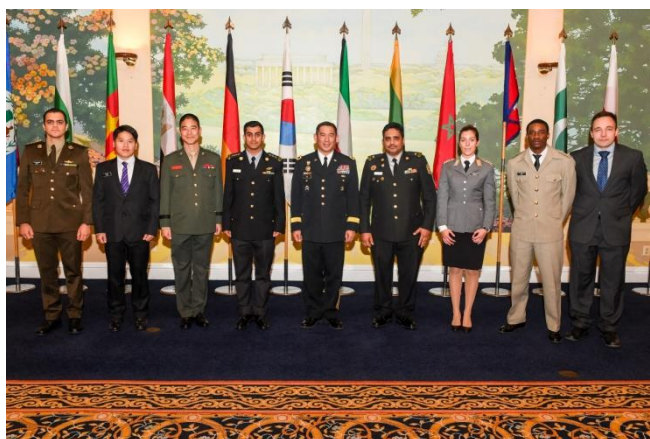
附圖 5：赴美華府晚宴團體照