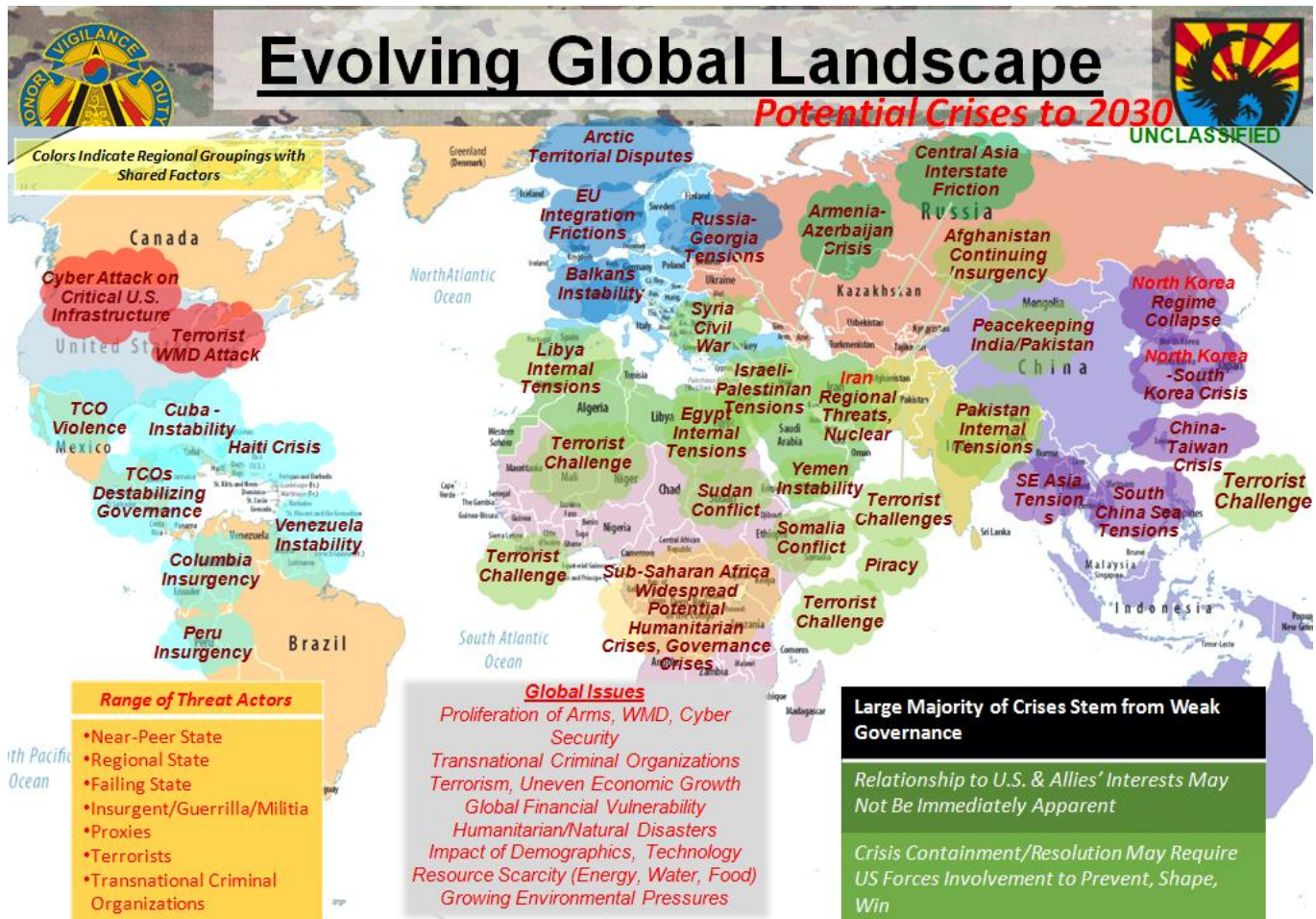
附圖 3: 全球情勢變化