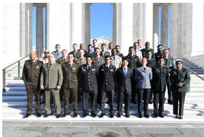
附圖 4：赴美華府阿靈頓國家公墓團體照