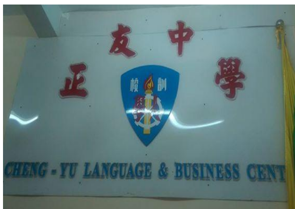
105年8月15日下午到仰光訪問正友中學張科長與段校長珊珊、柳勇副校長等主要幹部座談，該校企盼僑委會新編緬語版華語文教材早日到來，雙方交換意見，溫馨愉快。