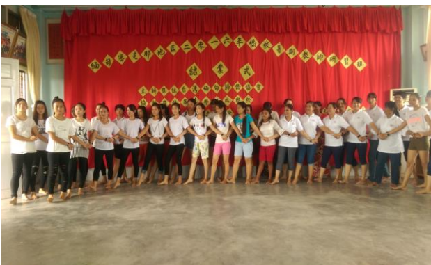
105年8月13日暑期研習活動結業式活動照片。