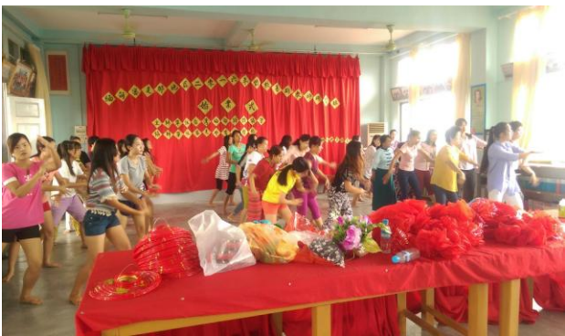
105年8月12日在育成學校，實際瞭解暑期研習活動上課情形。