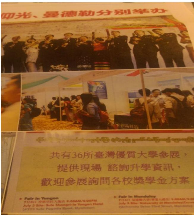
緬甸當地報紙唯一華文媒體報導