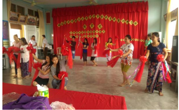
105年8月12日實際瞭解暑期研習活動上課情形。