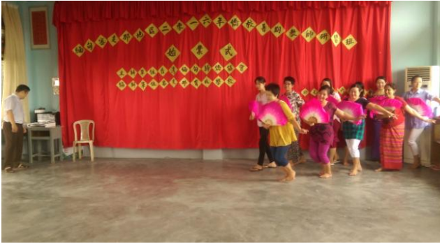
105年8月12日實際瞭解暑期研習活動上課情形。