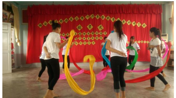
105年8月13日暑期研習活動結業式活動照片。