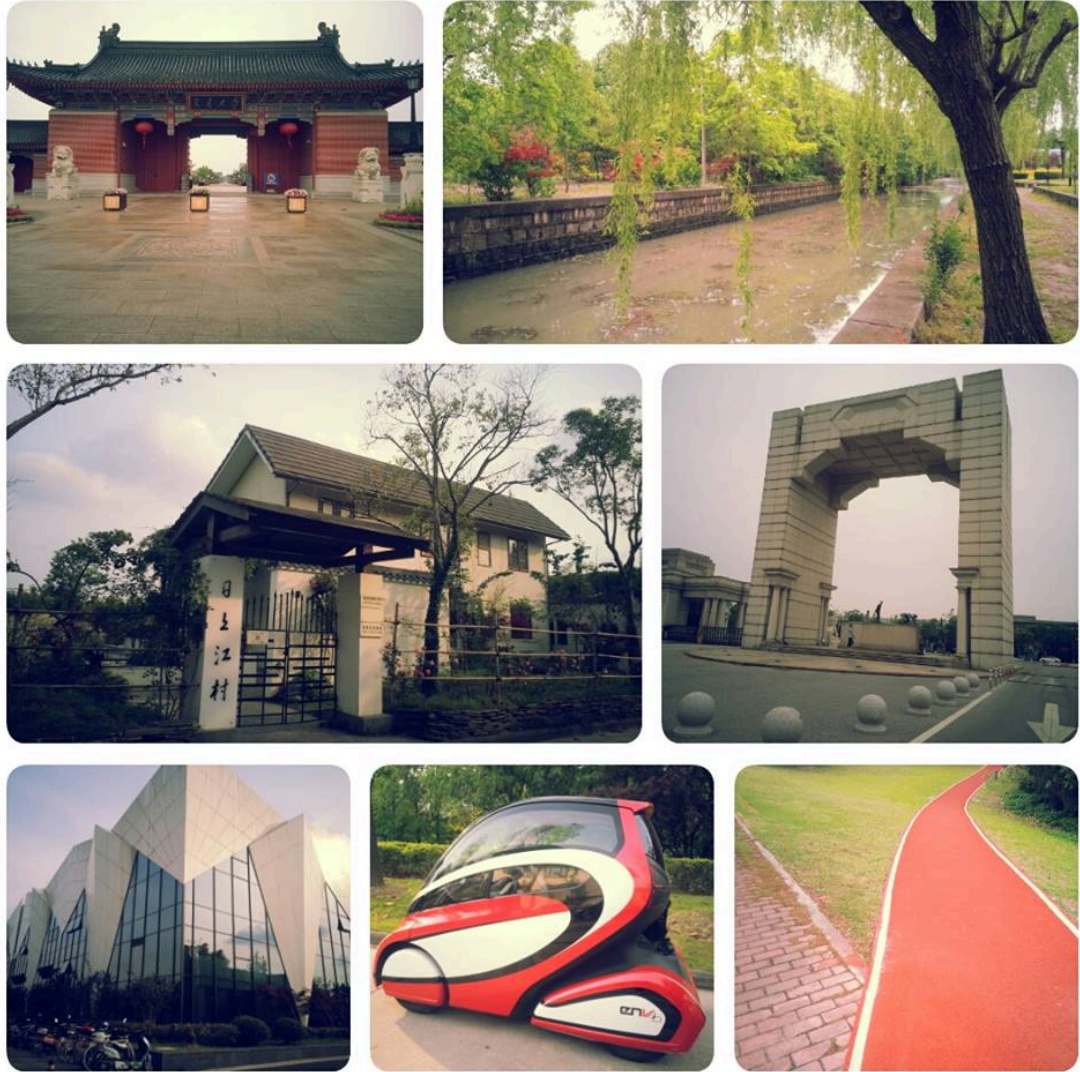
上圖: 上海交大的校園一覽