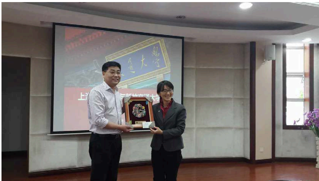
上圖: 與上海交大環境學院副院長互換紀念品

上海交通大學的環境學院共計有 51 位教職員工，另外加上 12 位兼任教師，師資人數遠遠超院本校環境工程研究所(8 位專任師資加上 4 位職工共計 12 位專任教職員工，以及一位兼任師資)，但本所因為每位師資的研究績效都非常好，因此也帶給對方很深刻的印象。我們期待校方能很快完成雙方的合作簽署，並在明年換他們來台灣與我們交流。