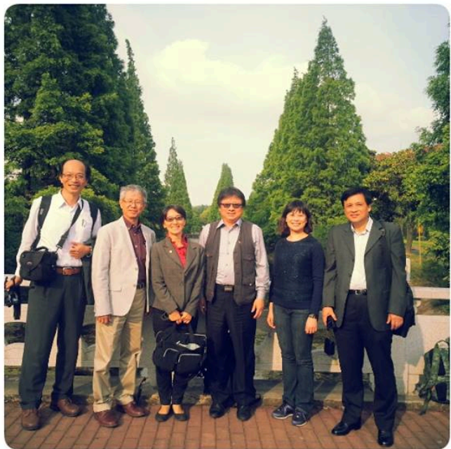
左上與左下圖: 上海交大慶祝 120 週年慶。