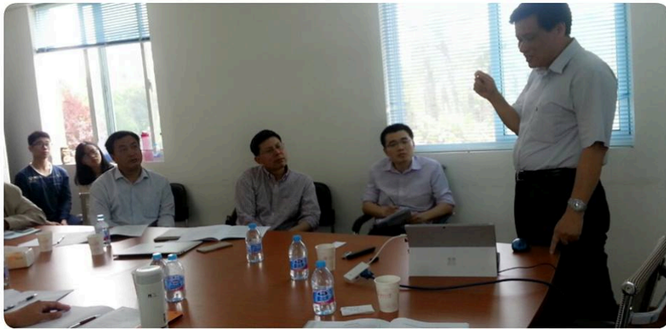
上圖: 空氣污染分組討論

這是我第一次前往上海交通大學，發現他們有許多可以學習的地方。例如上海交大為了慶祝 120 週年，在校門口特地建構出紀念園圃，以及每棟建築物都以非常明顯的方式標示著 120 週年的校慶，以顯示出他們對建校歷史的重視。