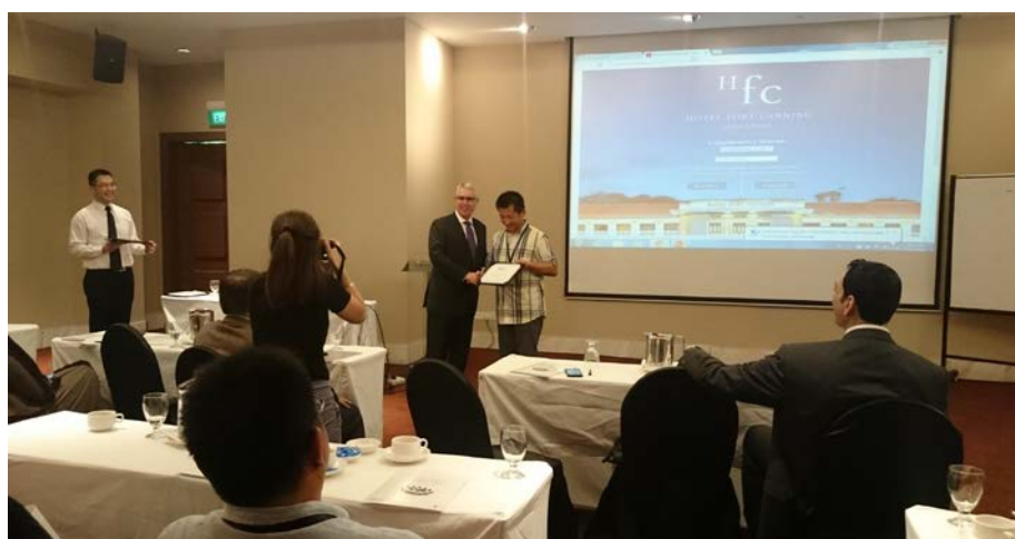
圖 8. 頒獎典禮—頒發最佳論文及最佳學生論文獎項