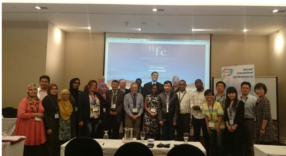
圖 9. 會議主持人及與會來賓大合照留影