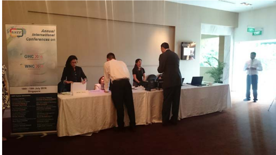
圖 4. 會議報到處