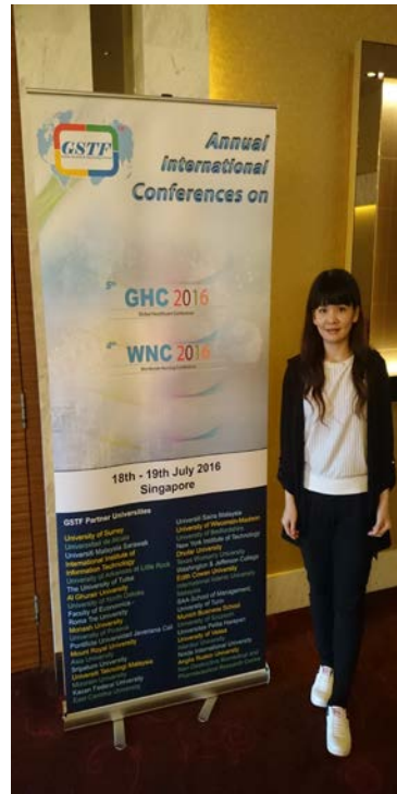
圖 3. 參加人員與會議海報合影