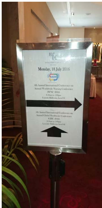
圖 2. 會議現場指示牌