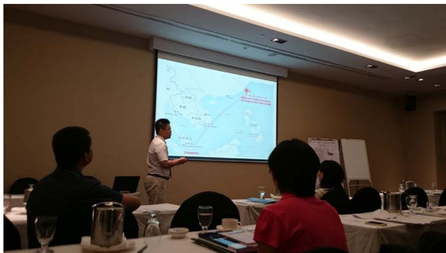
圖 6. 來自我國發表者介紹臺灣，增加我國國際知名度