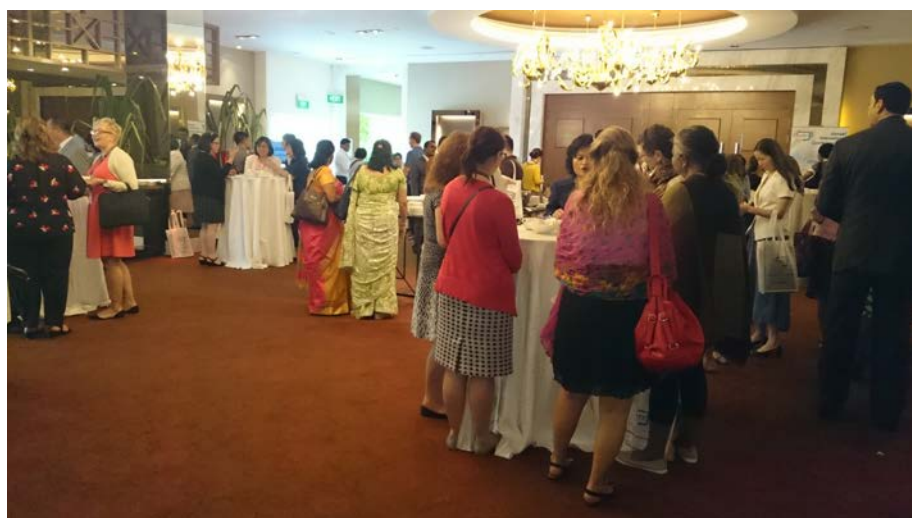
圖 7. 會議中場交流時間—與會來賓交流互動