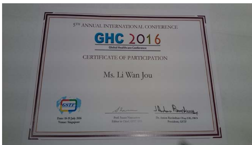
圖 11. 結業證書