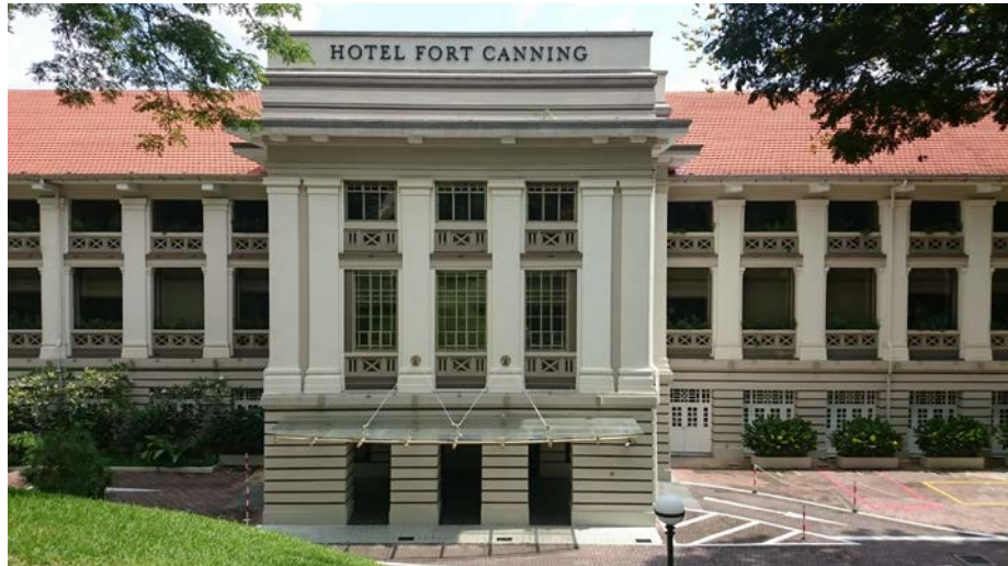
圖 1. GHC 2016 會議地點：新加坡 HOTEL FORT CANNING