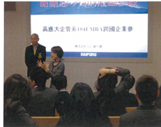
Q & A 時間