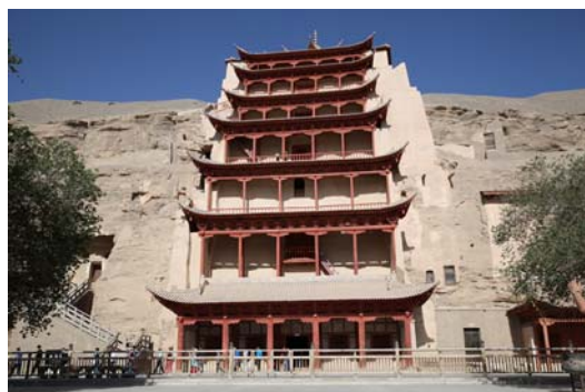
圖十 莫高窟第 96 窟

在石窟內想像當時人就著燭光或反射日光在昏暗的洞窟內，一筆一筆繪下心中的佛國世界，是不是全然忘記自己當時面對的戰亂時代、物資的貧乏。這份超脫讓人讚嘆。更迫切的希望將這份參觀時的感動，也能帶給無法前來當地參觀的臺灣民眾。