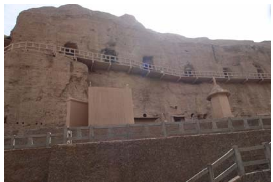
圖十二 榆林窟一景

榆林窟沒有像莫高窟那麼多的人潮，但是蒼涼的景色很動人心弦（圖十二）。研究院為我們安排的解說員同樣具有高度專業，帶著我們參觀了幾個需要申請才開放的特別窟，包括第 3 窟、第 4 窟、第 2 窟、25 窟、23 窟、16 窟等，也是這次特展要介紹給觀眾的內容。榆林窟位置由於陽光不直接照射，窟內壁畫顏色多半鮮豔依舊，令人精艷！第 2 窟的入口兩壁上的水月觀音，神秘的青綠色彩，顯出觀音的詳和與靜懿，解說員敘說著兩幅畫的畫工差異，推測其中隱含了兩位畫師競畫的意涵，讓人印象深刻。第 25 窟是中唐吐蕃時期的遺作，除了繪製精美的觀無量壽經變畫、彌勒經變畫之外，更繪製了許多當時人生活的日常場景，耕穫、嫁娶、入墓圖等。栩栩如生的人物場景，可說是復原當時居民生活的重要考古資料。