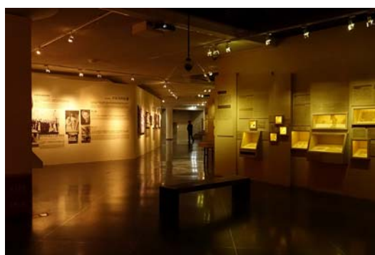
圖十四 沙漠瑰寶展示一隅

敦煌石窟文物保護研究陳列中心位在莫高窟附近，展廳內正推出「沙漠瑰寶－敦煌石窟經典洞窟複製展」（圖十四），介紹從石窟開鑿技術開始，到壁畫如何繪製，塑像如何製作，經典的出土文物、壁畫，石窟寶藏遭掠劫的歷史經過，現代以來的保存修復過程與維護技術應用，以及與石窟有關的人物等。最亮點則是四個複製洞窟的展覽，進入複製洞窟，猶如實歷洞窟之內，壁畫、塑像，昏黃的光線，一一重現。很具說服力的展示。