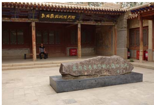
圖九 敦煌藏經洞陳列館

石窟內壁都畫上了線條細緻、色彩鮮豔、故事豐富的壁畫裝飾，也有造型優美典雅的塑像，在第十七洞窟內甚至保存下豐富的經典文獻。目前位在第十七洞附近設有藏經洞陳列館(圖九)，介紹藏經洞發現始末、文物遭受浩劫情形、以及留下的少數文獻與文物。壁畫資料和文獻，不但訴說了敦煌地區的歷史，作爲世