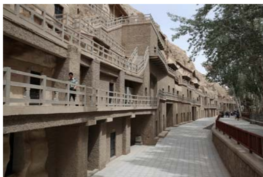
圖十一 莫高窟一景

根據解說得知，莫高窟一帶原本是一脈綠洲景象，隨著窟前宕泉河的枯竭，人群的移出，才見得如今只見遊人如織，附近卻無居民的景象。園區內植滿了參天白楊是具有防風沙作用的（圖十一）。莫高窟面臨的自然風化是時間對它的考驗，然而人爲帶來的耗損也是相當可觀，因此目前由敦煌研究院管理、維護的洞窟。除了透過申請制規定每日入園人數之外，內外部的加固、維護更是保存工作的一大挑戰。另外嚴格考核、訓練的解說導覽人員培訓，也是敦煌研究院戮力親爲、長期投入的工作項目之一。而這個成果從這次帶領我們的解說人員表現出的專業自信上，能深刻感受。