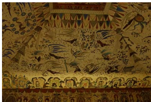
圖四（上）、圖五（中） 複製壁畫 圖六（下） 複製洞窟