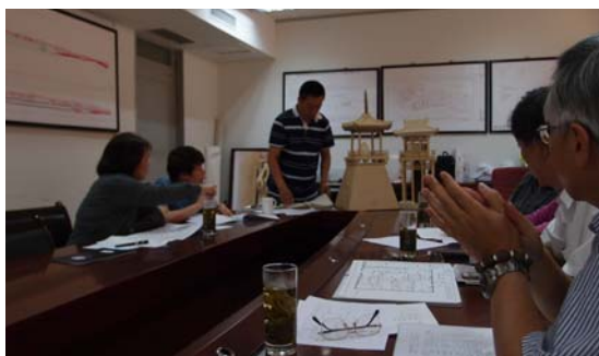
圖二、圖三 雙方洽商展覽會議