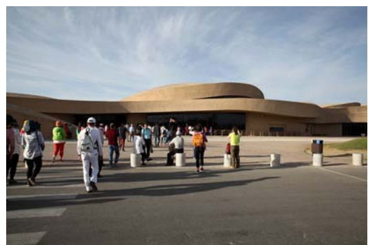
圖十三 莫高窟數字展示中心

一早前往已經預定了場次的莫高窟數字展示中心（圖十三）。這座數字展示中心是占地一萬多平方公尺的大型球幕影城，透過全面數位化技術將敦煌藝術轉化為實景影片傳達