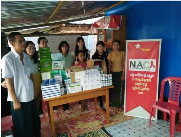
▲成大醫院捐贈藥品衛材及快速篩檢試劑