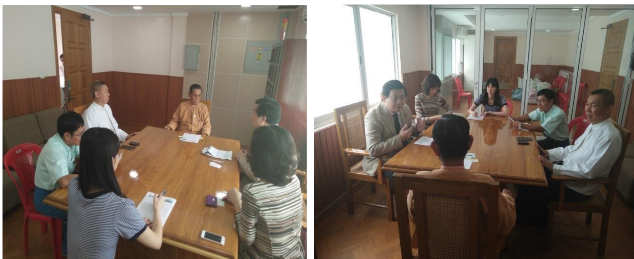
▲拜訪 National League for Democracy (NLD)主席 U Tin Oo (吳丁吳)

另外，他也表示目前緬甸剛開放，百廢待舉的狀態下，各項人員的培訓是最迫切需要的項目，所以非常支持成大醫院在緬甸所進行的人員訓練計畫。對於是否能夠合作，在不涉及政治敏感議題下，未來可以有進一步討論的空間。