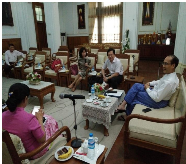
▲雙方進行未來合作討論