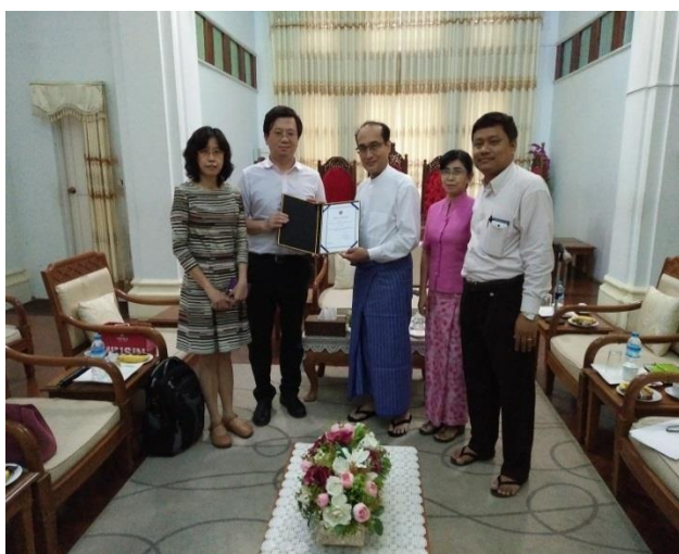
▲仰光第一醫學大學校長(右三)致贈感謝函