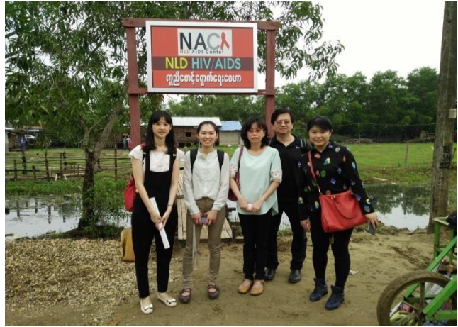
▲團員於 HIV Center 前合影