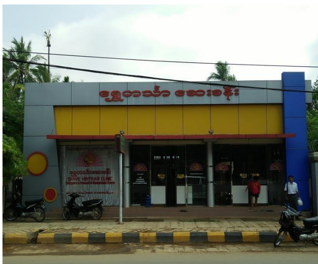
▲Shwe Hinthar Clinic

在該中心負責人的介紹下得知，目前該中心每天有兩名醫師駐診，並設置有看診室、診療室、藥局、放射室及簡單的檢查室。同時設有遠距醫療設備，對於影像醫學需要協助的部分，會透過遠距醫療設備，將資料傳輸到 Parami General Hospital(派樂米醫院)，由該院的醫師進行資料判讀，再回報結果到中心，提供中心駐診醫師參考進行後續醫療處置。