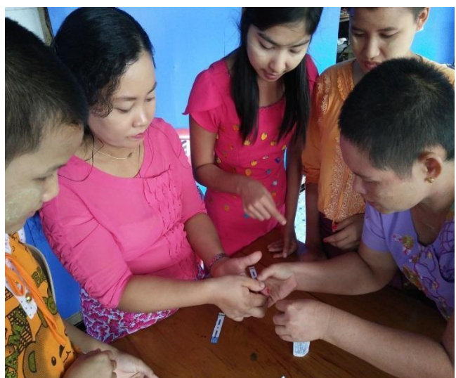
▲學員練習快篩操作情形