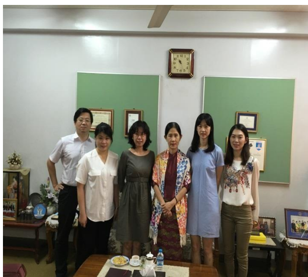
▲與仰光護理大學校長(右三)合影