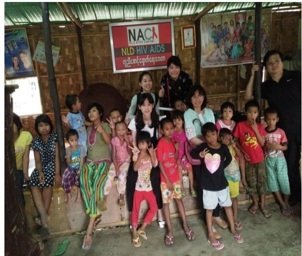
▲HIV Center 收容之小孩 成大醫院

延續去年的人員培訓計畫，協助其對愛滋病有進一步認知，並學會使用快速篩檢技術及結果判讀。而有別以往的是，去年培訓對象以中心的工作人員為主，今年則以住在中心的民眾為主。由成大醫院護理部柯乃瑩副主任、賴怡因護理師、孫婉娜護理師針對其程度，設計一系列簡單易懂的愛滋病相關課程，並透過該中心工作人員的翻譯下，介紹有關愛滋病的基本常識及防護措施。並在柯乃瑩副主任以影片方式，詳細說明愛滋病快速篩檢的操作過程。隨後以方組方式，協同賴怡因護理師、孫婉娜護理師、蔡宛真行政人員以分組方式進行實際操作練習及結果判讀。共計有 28 人完成訓練課程。