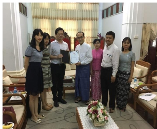
▲與該校各主管合影