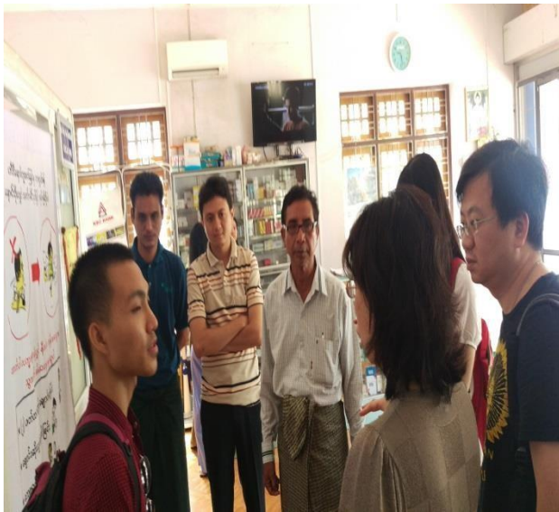
▲與中心負責人(圖左四)會談