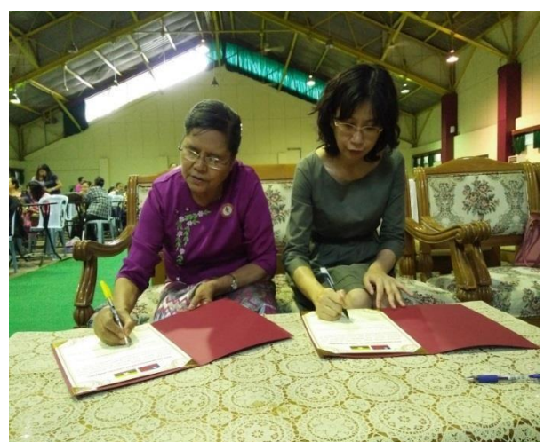
▲與 MNMA 簽訂合作備忘錄