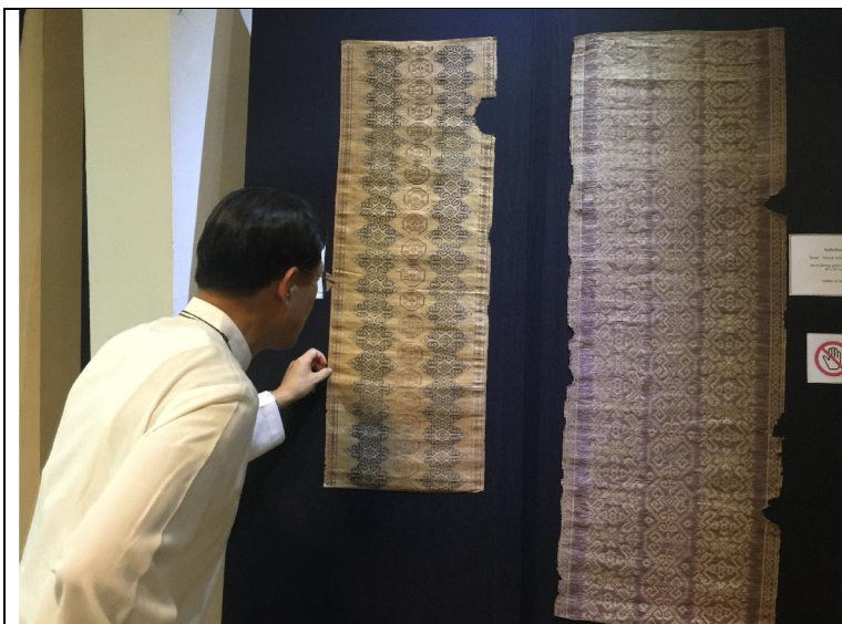
參訪雅加達織品博物館