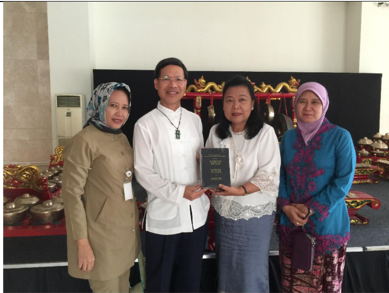
和印尼國家博物館館長互贈出版品