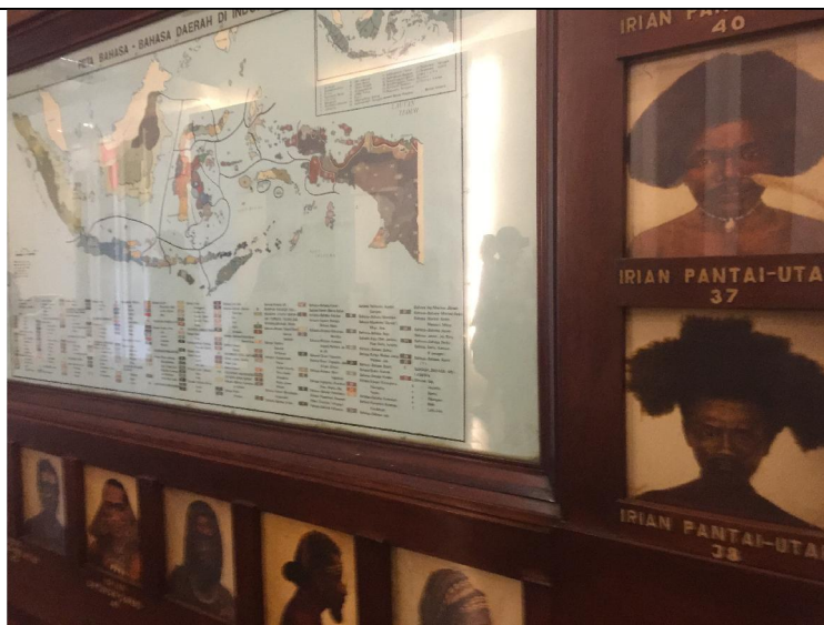
印尼國家博物館之多元族群展示