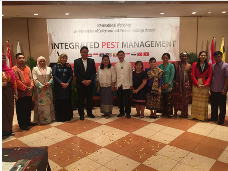
和 ASEAN 博物館典藏品維護工作坊各國代表合影