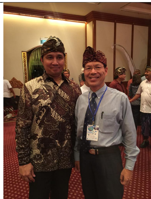
與 Hilmar Farid 文化總署署長合影