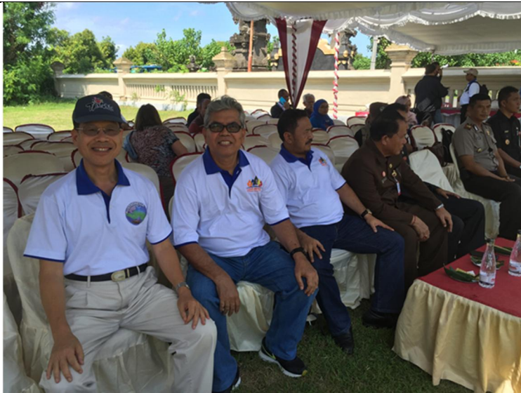
參與在 Gilimanuk 考古遺址辦理之論壇閉幕式