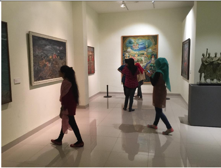
參訪印尼國家美術館