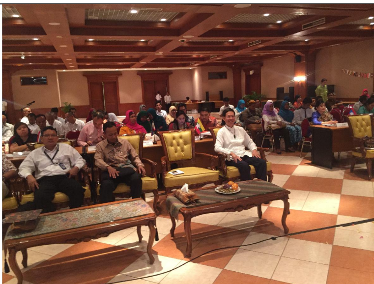
參與 ASEAN 博物館典藏品維護工作坊開幕