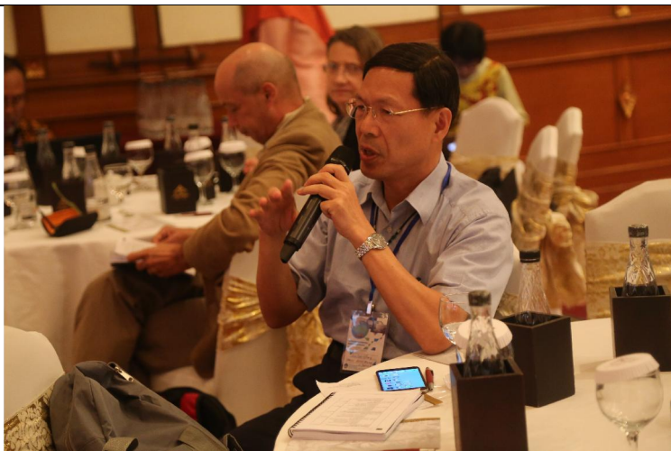
第一場 Plenary 演講時發言