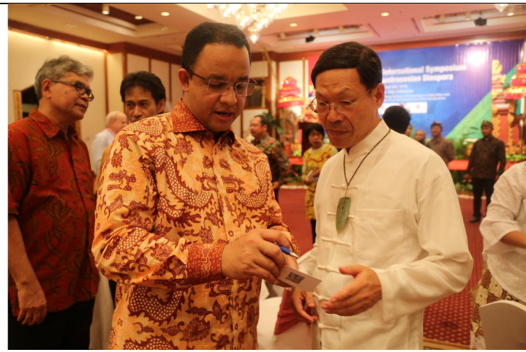
與 Anies Baswedan 部長交談