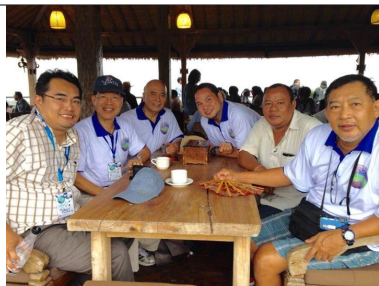
和印尼、菲律賓、泰國學者合影