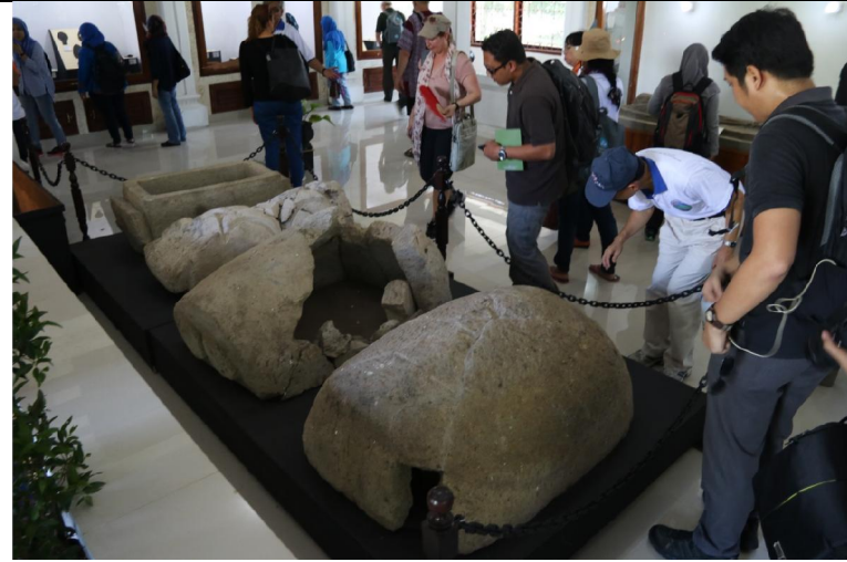
Gilimanuk Site 遺址參訪