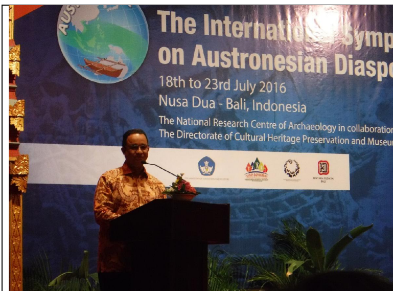
研討會開幕 Anies Baswedan 部長致詞