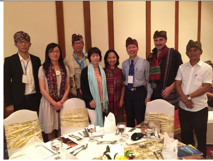
和臺灣、澳洲、印尼及大陸學者合影