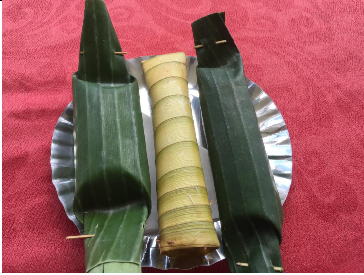
印尼當地之米食點心，和臺灣原住民雷同