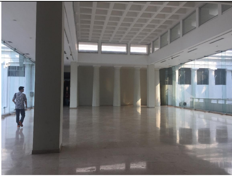
印尼國家美術館特展空間