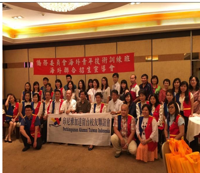
宣導團與雅加達留臺校友聯誼會合影