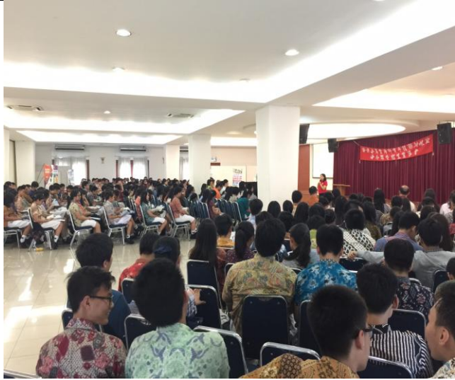
雅加達衛理學校出席踴躍