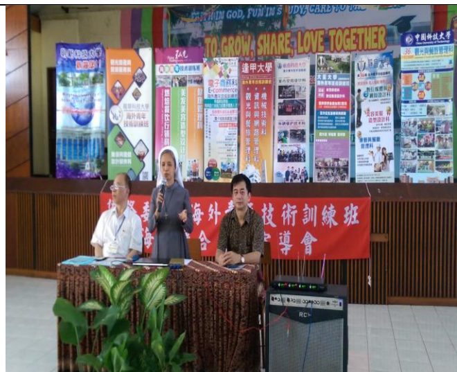
Santa Maria 校方歡迎宣導團