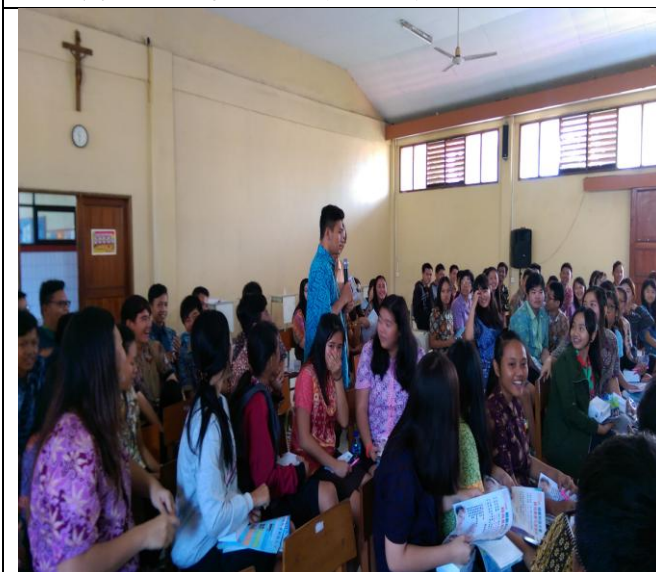
Santa Maria 學生踴躍提問