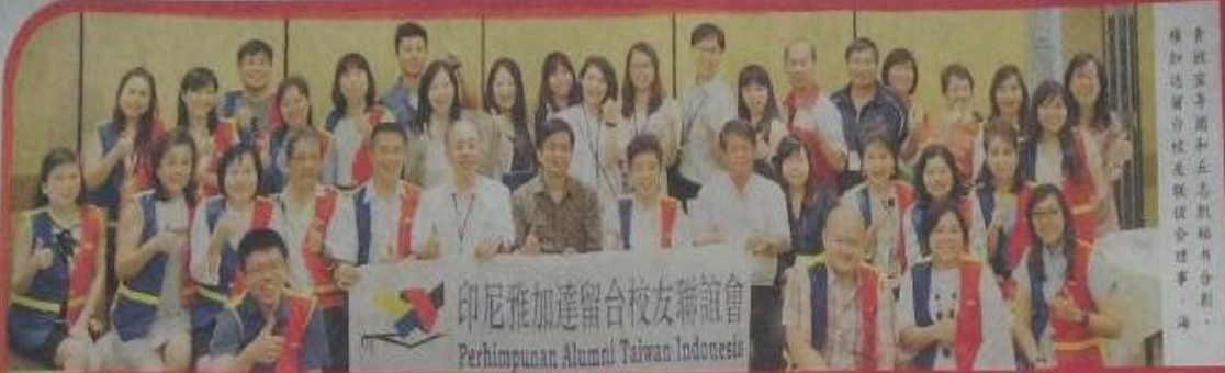
青社宣導團和五志服務社合辦，海峽僑社及海峽校友會理事會、海