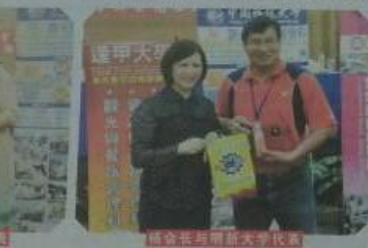
协会会长与静宜大学代表