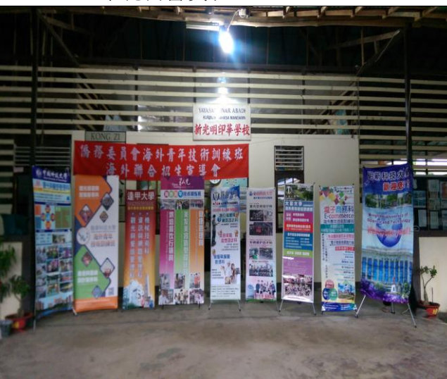
新光明印華學校宣導實況