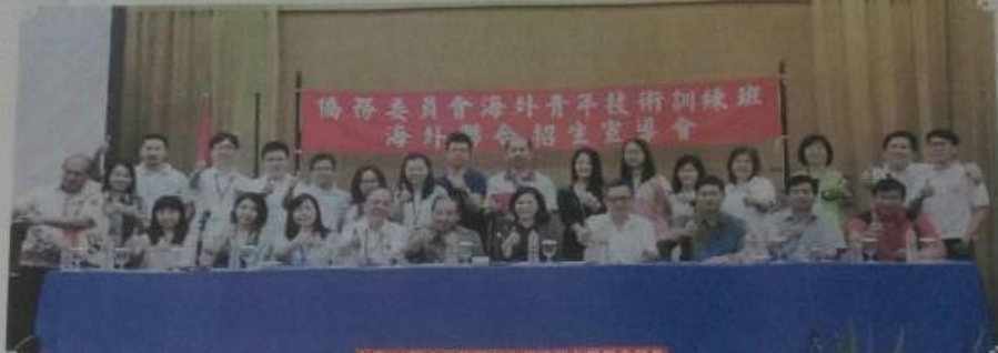
台湾11所大学代表与中爪哇留台同学会合影