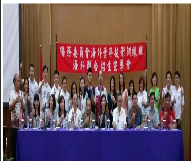
宣導團與中爪哇留臺同學會合影