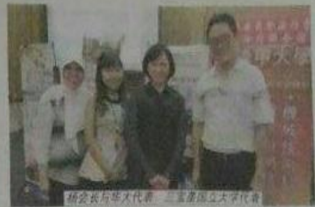
桥会长与华文代表、三宝垄国立大学代表

7月26日(星期二)晚7时许在三宝垄市Oak Tree Emerald酒店顺利召开第36期海外青年技术训练班宣导会。