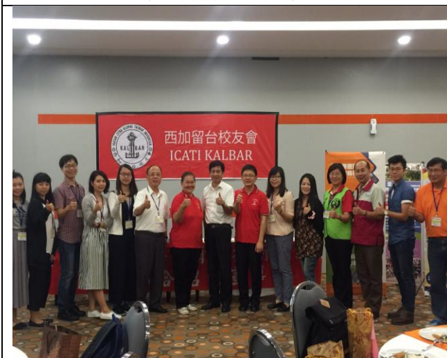
宣導團與西加留臺校友會合影