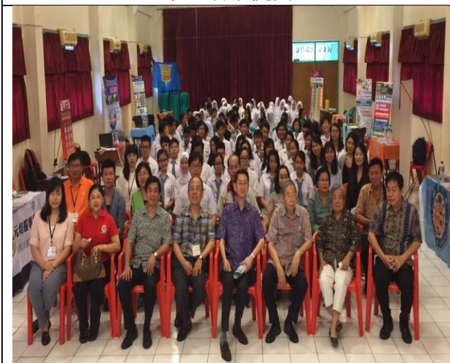
宣導團與雅加達新民會學校參與師生合影