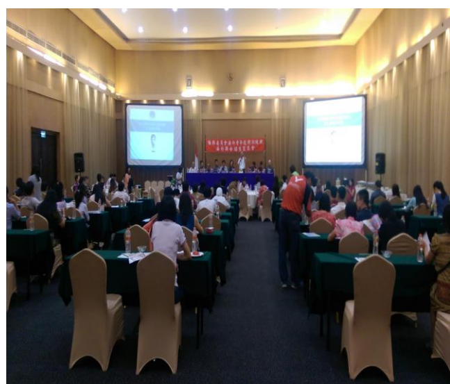
三寶壟說明會實況