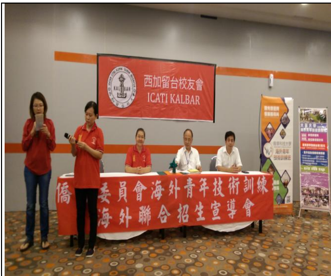
西加留臺校友會協助宣導