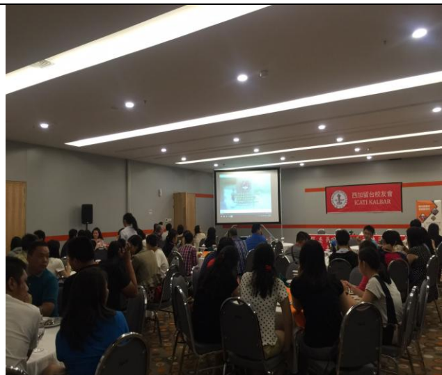
坤甸場說明會實況