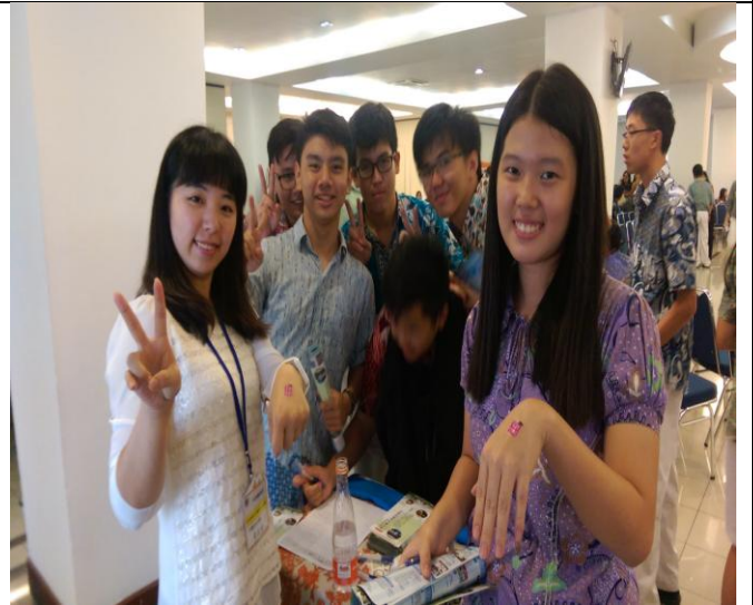
雅加達衛理學校宣導實況