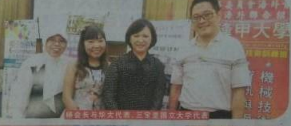
协会会长与静宜大学代表、三宝垄国立大学代表