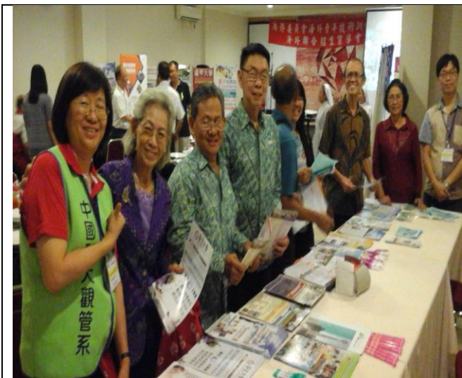
井里汶區參與教師踴躍索取文宣