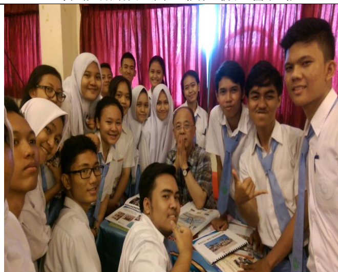
雅加達新民會學校宣導實況