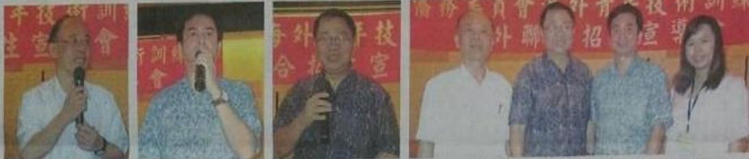
李天于致词 左志凯致词 江泽民致词 由左至右: 李天于、江泽民、左志凯、魏婉容、合影