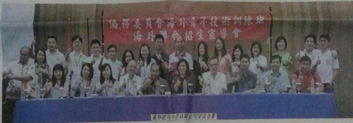
宣导团与中爪哇留台同学会合影