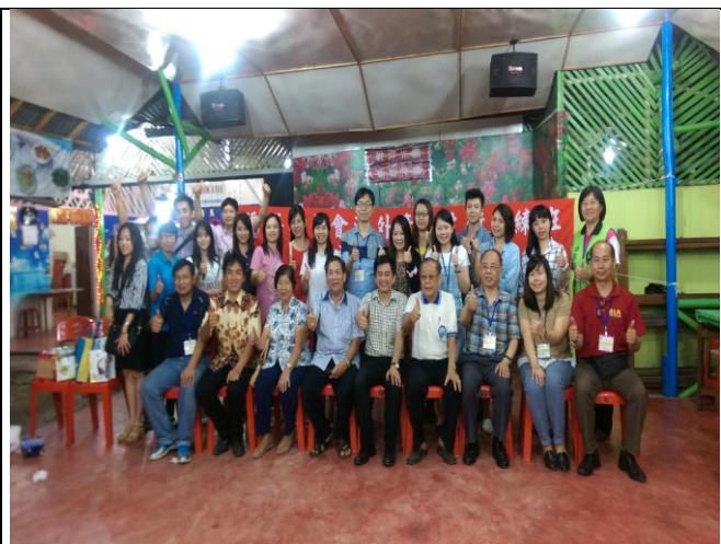
宣導團與山口洋區華文教師合影