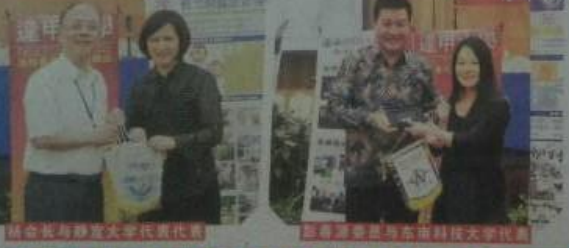
协会会长与静宜大学代表、静宜大学与东南科技大学代表