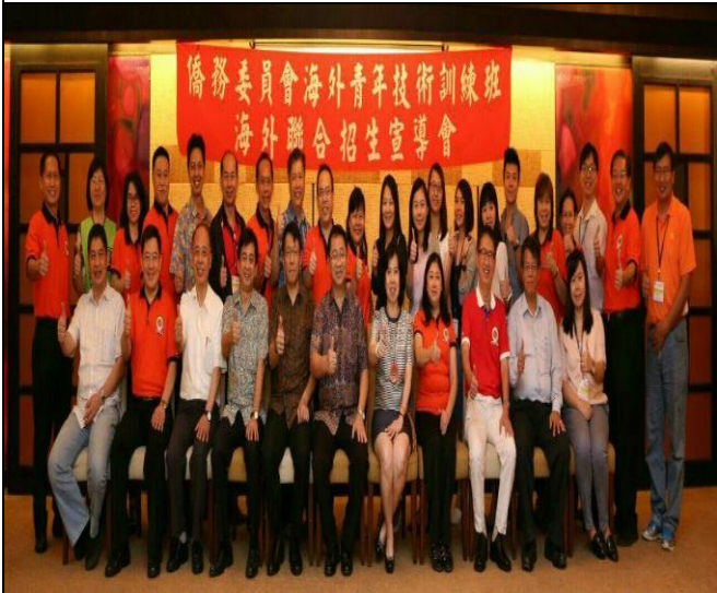
宣導團與印尼留臺校友會聯合總會合影