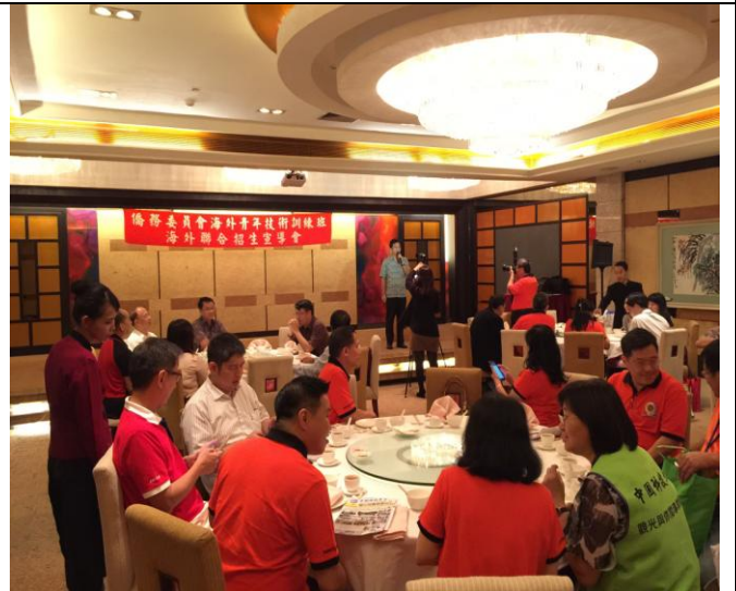
宣導團與印尼留臺校友會聯合總會交流