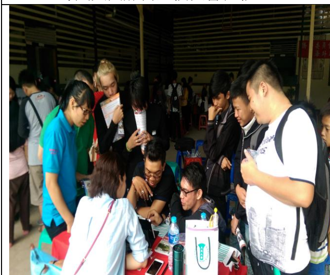
山口洋區同學至各校攤位瞭解開班情形