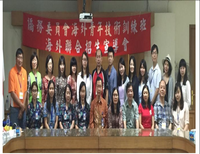
宣導團與雅加達衛理學校教師合影