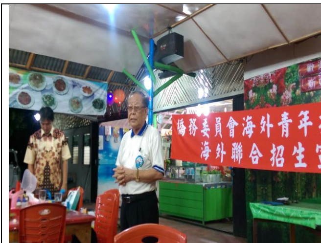
山口洋華文教師聯誼會協助宣導