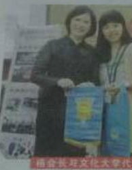
协会会长与台北大学代表