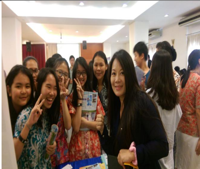
雅加達衛理學校宣導實況