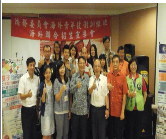
宣導團與井里汶臺灣工商聯誼會合影