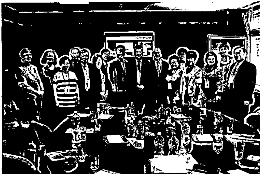
園區參訪會後留影