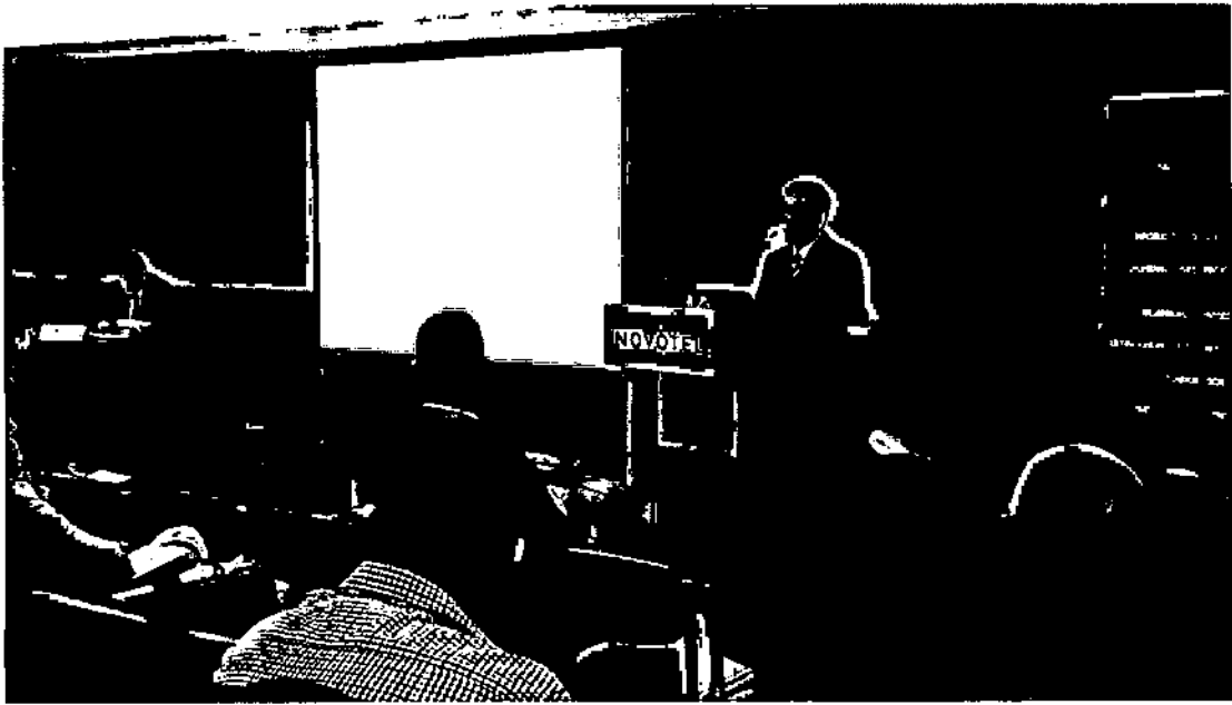
於第 12 屆臺匈（牙利）經濟合作會議介紹本行