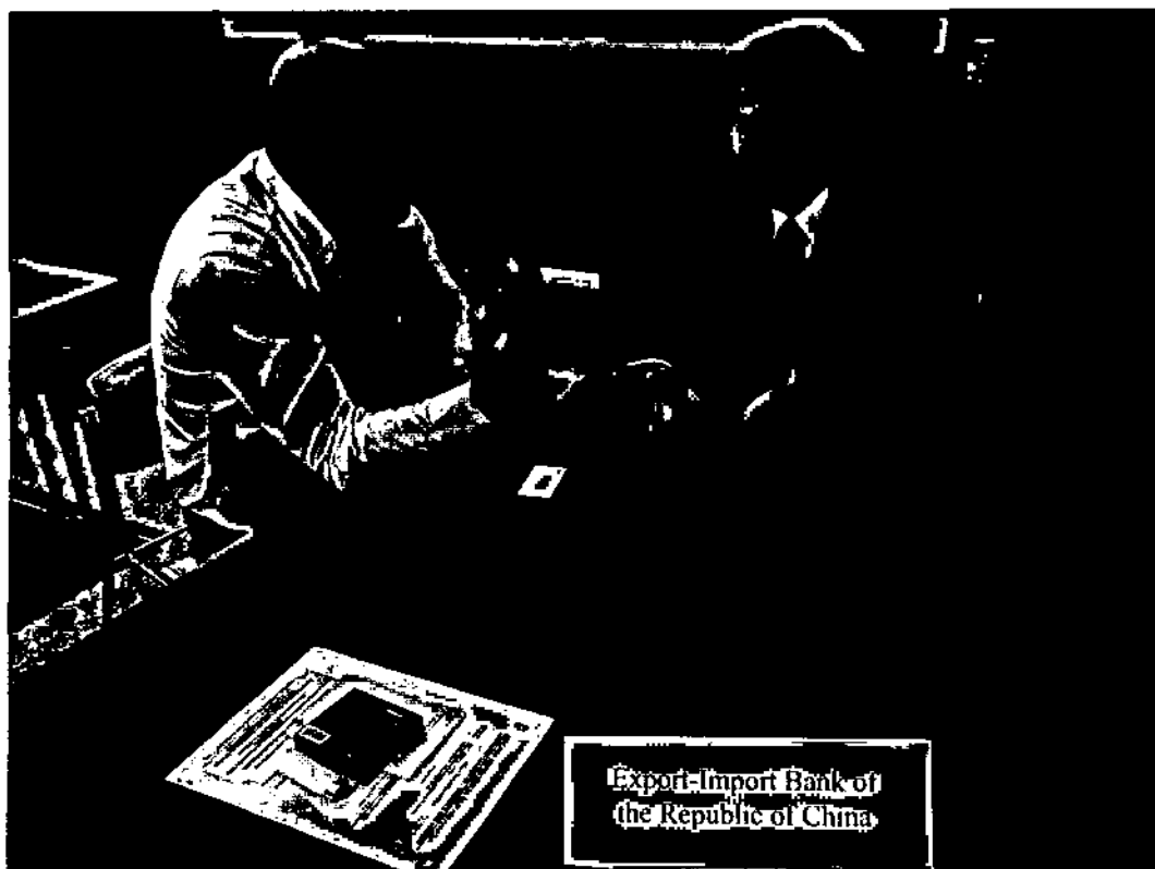
與匈牙利廠商洽談一