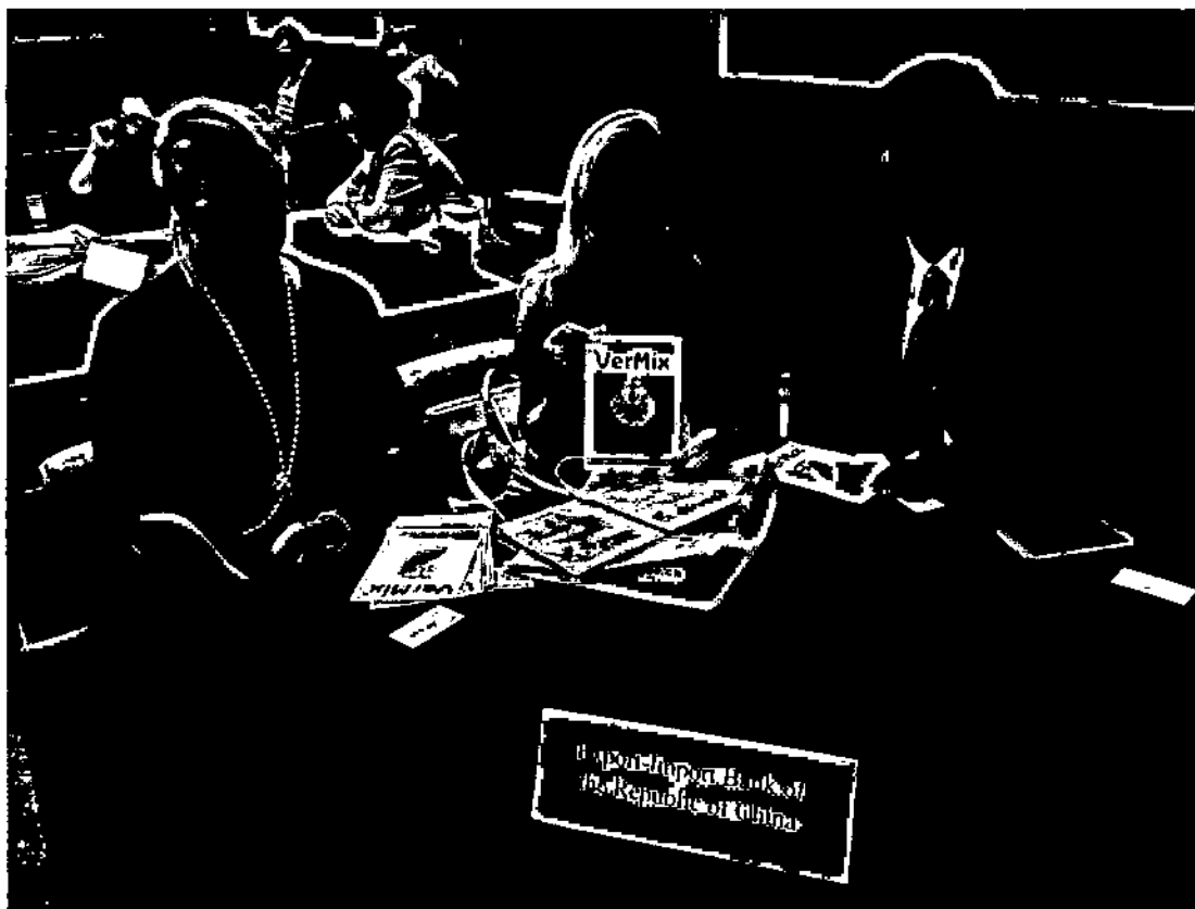
與匈牙利廠商洽談二