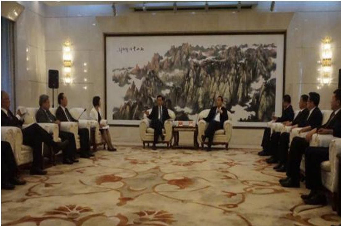
與內蒙古自治區領導及代表會談