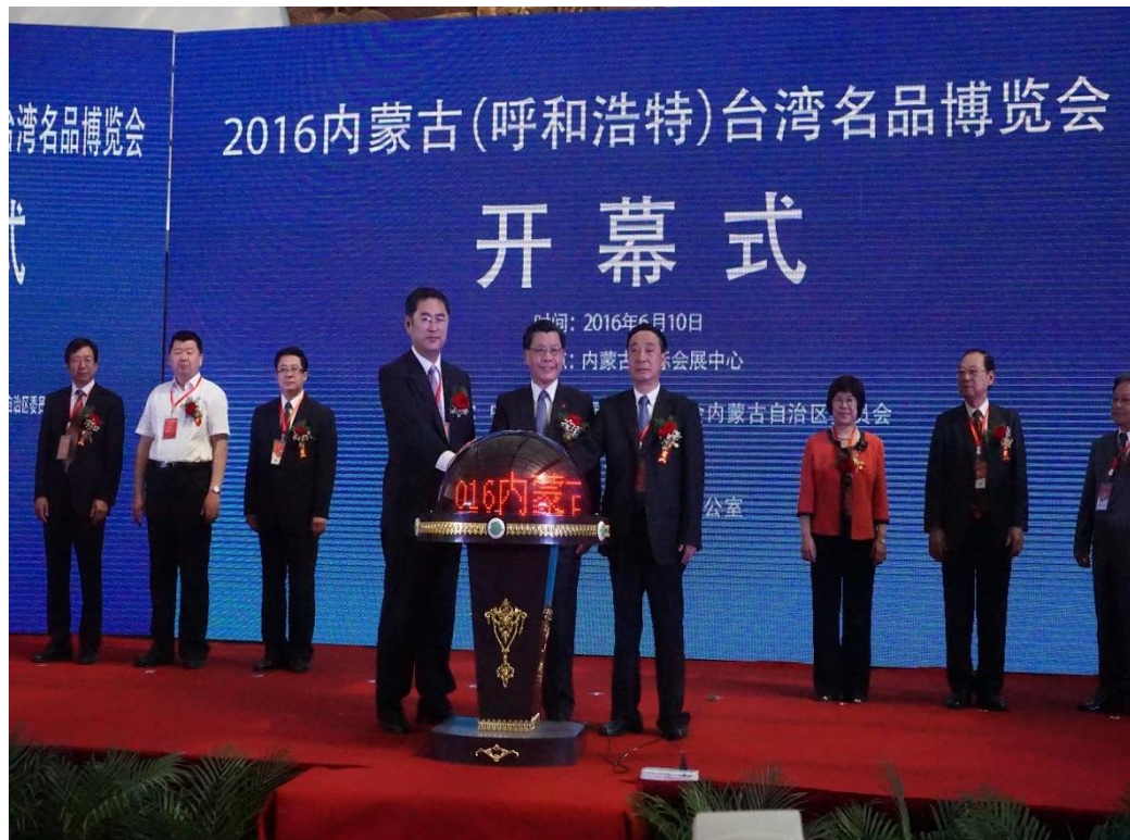
內蒙古(呼和浩特)台灣名品博覽會開幕典禮