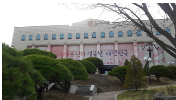
韓國國家選舉委員會利用建築物外牆進行宣導

為使選民瞭解本次選舉的投票日期及時間、投票流程等，韓國國家選舉委員會邀請藝人雪炫及 Apink 等擔任公益大使，拍攝宣導短片或平面廣告，透過電視、報章媒體、街道看板、LED 跑馬燈、公車車體廣告等方式，積極進行宣導。