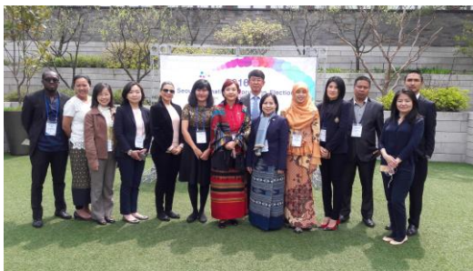
參訓人員於 2016 首爾國際選舉論壇場外合影

民主政府的本質是民有、民治、民享，儘管世界上有各種不同型式的民主，但公民皆是各民主國家政權移轉的關鍵