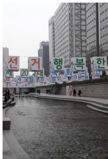
清溪川沿岸的選舉宣導標語及候選人照片