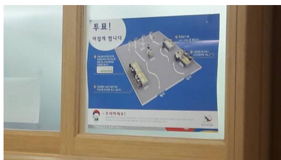
張貼於投票所外的投票流程圖