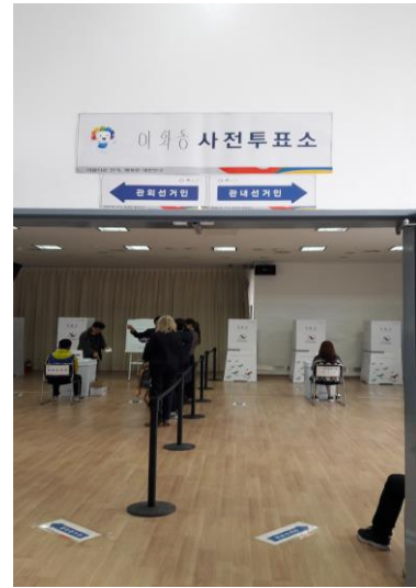
設置於活動中心之投票所 (進入投票所後區分為2道動線)

(2) 非屬於該選舉區內住民者(即不在籍投票者)，投票所工作人員先以電子掃描選舉人身分證，以確認身分證資料與機器螢幕上所顯示之個人資料是否一致。經確認選舉人身分無誤後，投票所工作人員即以電腦列印出選票及信封，發給選舉人。接著，選