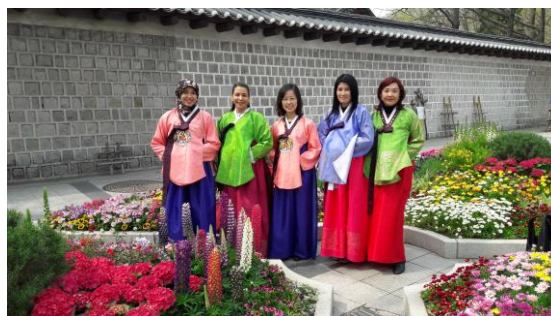
自由行程參訓人員前往首爾市參訪