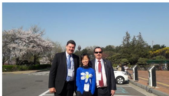
與巴西選委會參訓人員合影

能力，汲取他人經驗以為參考，從而增進選務人員的專業能力，強化選舉管理機關的治理能力。因之，A-WEB 鼓勵選舉管理機關間進行選務相關經驗、研究、科技及科技