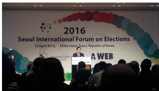
A-WEB 金秘書長於 2016 首爾國際選舉論壇開幕式致詞

在選舉過程中使用資通訊科技的頻率持續增加，主要係因為人們普遍地相信，透過改善選舉人投票方式、簡化