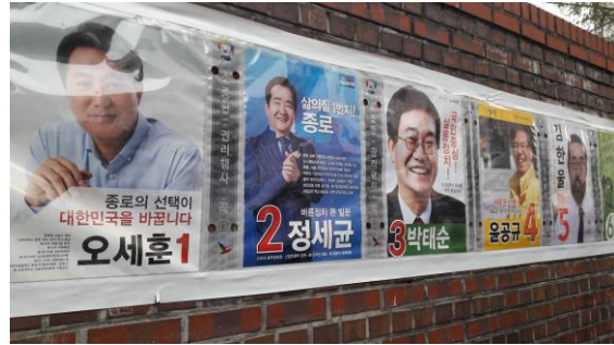
選委會統一張貼於投票所外的候選人海報

3. 國民之黨：選區議員提名 173 人、政黨候選人名單提名 18 人，共計 191 人。