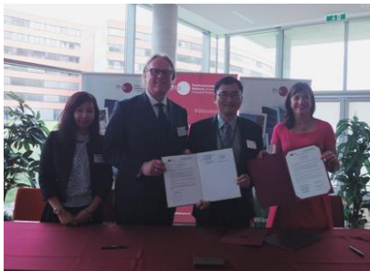
與薩爾茲堡專業高等學院簽約