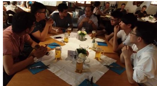
斯圖加特與本校在德國實習生餐敘