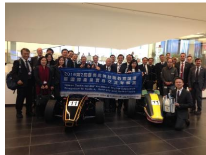
維也納校園專業高等學院合影