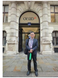
會議地點奧地利學術交流總署