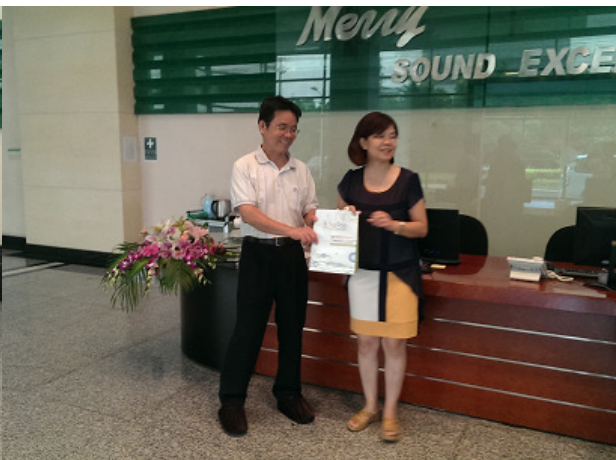
主任致贈本校紀念品與林總經理