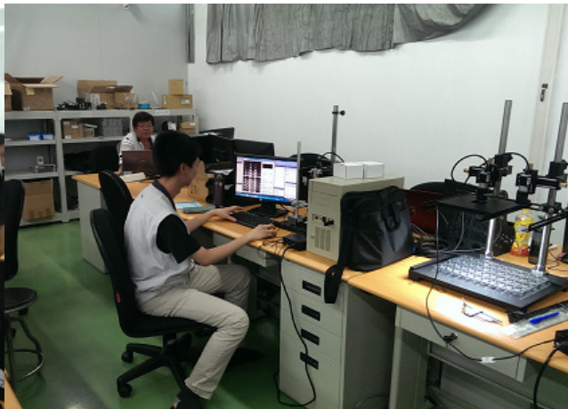
實習學生工作場所