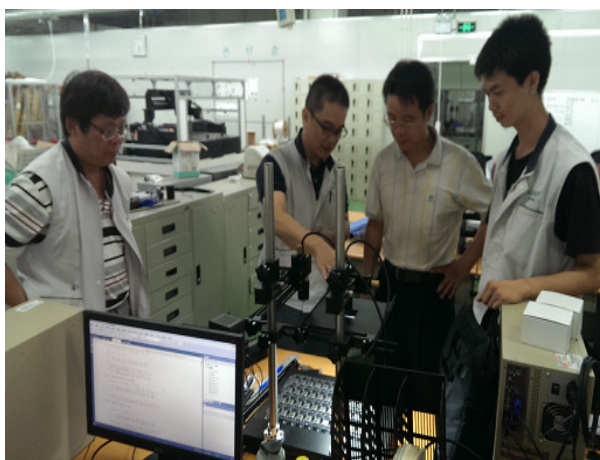
主任與實習導師及學生討論技術