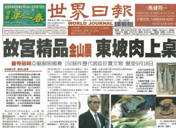
【圖廿三】六月十六日舊金山世界日報對「帝王品味」展覽所作之報導

王朝與九位帝后的文化思維與藝術見解，並據以探討渠等個人品味對當時以迄後世所產生的影響。其次，「中國古藝術品」與「中華瑰寶」巡迴展覽參展單位，皆集中於美國東西兩岸及中部人文薈萃之地，其他地區觀眾迄今無緣得見院藏歷代文物之璀璨光輝。鑒於文化藝術感通為促進不同民族相互瞭解