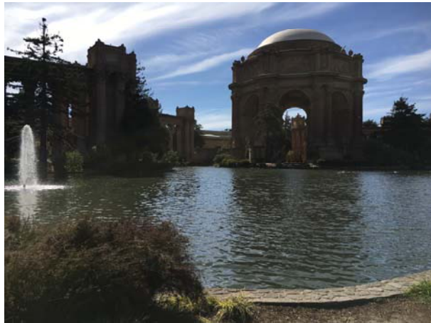
【圖十五】藝術宮一景

隨後，何副院長一行驅車前往附近海港區（Marina District）的藝術宮（Palace of Fine Arts）參觀。藝術宮落成於一九一五年，係為巴拿馬—太平洋萬國博覽會（Panama-Pacific Exposition）藝術作品展示目的而建。今日所見之藝術宮，是當年博覽會少數保存迄今，且唯一留存於原址的建築物，業經