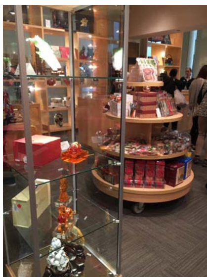
【圖廿二】本院文創商品於舊金山亞洲藝術博物館紀念品商店陳列情形

晚間餐會由展覽贊助者何鴻毅家族基金舉辦，亦為展覽開幕最後一項慶祝活動。應邀出席之貴賓，多為美國西岸及灣區附近的文化藝術界人士。何鴻毅先生親自到場參加，並頻向與會賓客致意，顯見他對展覽之重視。案何氏為故陸軍二級上將何世禮將軍哲嗣，早歲取得哥倫比亞大學（Columbia University）新聞學碩士後，曾於美國、香港從事報章雜誌文稿撰寫工作。休致後，何氏投身佛學推廣，先創辦加拿大東蓮覺苑，開設佛學研究講座，復成立加拿大東蓮覺苑基金，推動相關教義研究計畫。 9 二〇〇五年，何氏於香港成立何鴻毅家族基金，致力「推廣中華文化和佛教哲理」，並「贊助多項文化計畫」，如英倫維多利亞與亞伯特博物館（Victoria and Albert Museum）之佛教雕塑藝術常設展覽、皇家安大略博物館（Royal Ontario Museum）與溫哥華美術館（Vancouver Art Gallery）合作舉辦的「紫垣擷珍—故宮博物院藏明清宮廷生活文物（ The Forbidden City: Inside the Court of China's