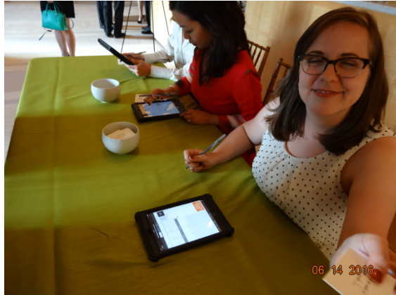
【圖廿四】舊金山亞洲藝術博物館同人操作活動管理軟體，辦理晚宴賓客報到及座次分配

舊金山亞洲藝術博物館為「帝王品味」展覽規劃的開幕慶祝活動簡單而隆重，絕少繁文縟節，除宴席安排採外包方式，由民間餐飲業者提供服務外，餘皆以最精簡人力，由館內同人任之。舉例而言，賓客於服務台之報到及座次分配，僅須二、三位工作人員手持智慧型電話或平板電腦，操作活動管理軟體（一名 Events