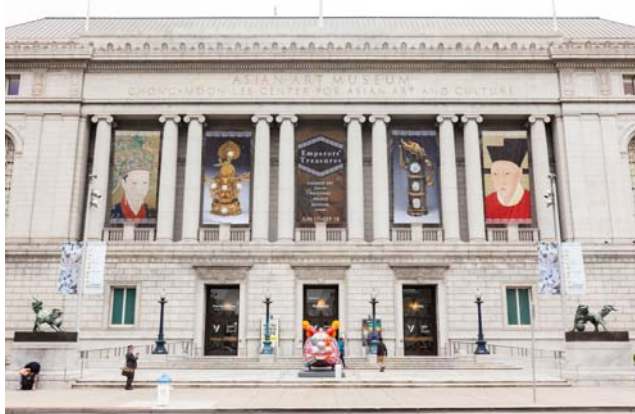
【圖八】舊金山亞洲藝術博物館正門入口高懸之「帝王品味」展覽宣

隨許館長步行至舊金山亞洲藝術博物館，參觀展覽會場。館外，舊金山亞洲藝術博物館製作的五幀大型宣傳布幔，已高懸於正門入口上方，各街道亦可見展覽旗幟。當日週一休館，館內並無遊客，所見皆工作人員忙於開幕活動前最後準備工作景象。