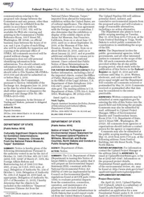
【圖六】美國《聯邦公報》刊登之「帝王品味」展覽訊息

確認三方瞭解、承諾之合約書既經簽署，本院即循〈文物資產保存法〉及其施行細則，辦理申請文物出國手續，並安排文物之囊匣箱件製作、狀況檢查報告輯印、借展品裝箱輸運等項。今年二月中旬，舊金山亞洲藝術博物館將其據美國公法九四一一五八號條文申辦，並經聯邦藝術暨人文學科審議委員會（Federal Council on the Arts and the Humanities）核准之聯邦政府賠償保證書寄達。當月下旬，本院致函文化部，說明「帝王品味」赴美展覽事宜。四月十五日，美國政府將「帝王品味」於舊金山亞洲藝術博物