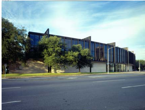
【圖三】休士頓美術館

(Harvard University) 美術系，曾服務於紐約大都會藝術博物館近三十載，所規劃籌辦的多項十九世紀與現代藝術展覽頗為美國文化界所重。他自二〇一二年接篆視事的休士頓美術館，係美國西南方收藏最豐富，內容最多元的文化藝術機構，也是每年參觀人數最多的美國十大博物館之一。