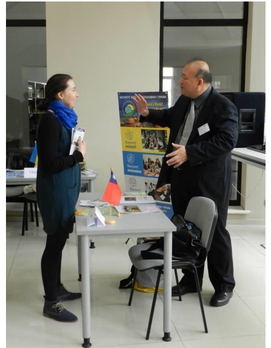
黃教授回應交換的疑問