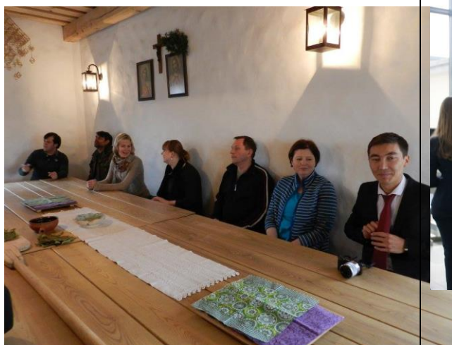
與國際事務處職員及國外來賓互動

參加國際週的國家來賓中，彼此間有一些互動及討論合作事宜。其中包括了建立夥伴學校及參訪。目前有可能建立合作的有捷克及巴西的大學。拜訪教育學院的院長，他對於臺灣很有興趣，希望未來能夠來嘉大拜訪。該校的研發處也基於該國將推動 STEM 的教育，也特別開會詢問臺灣在此領域的研究及推動經驗。此外，在國際事務處的協助下，兩校的教育學院正式簽下交換的合約。