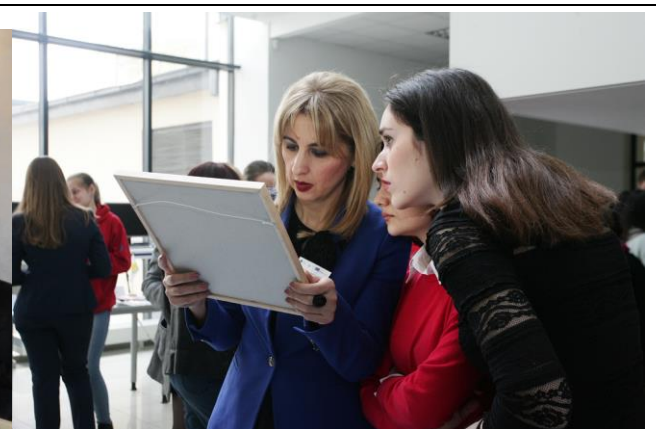
與其他大學的來賓互動