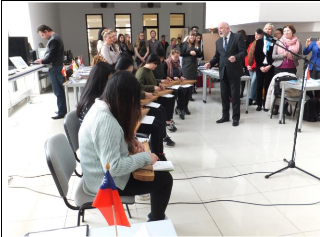
韓國交換生上台表演