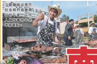
巴拉圭產出許多傳統手工藝品，是當地重要經濟活動。