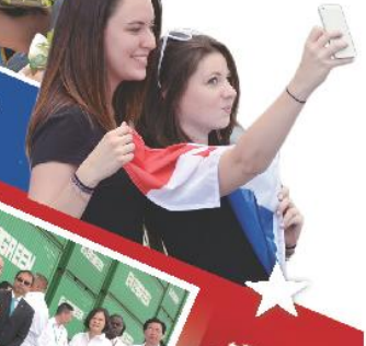
巴拿馬當地民眾參與竣工典禮，開心玩自拍。