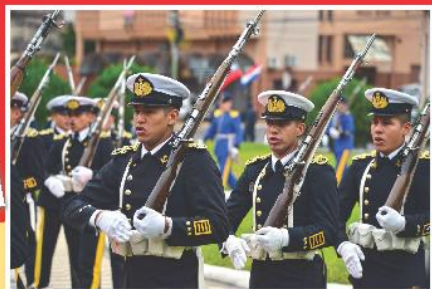
南美洲友邦巴拉圭以隆重軍禮歡迎蔡總統與我國訪問團到來。