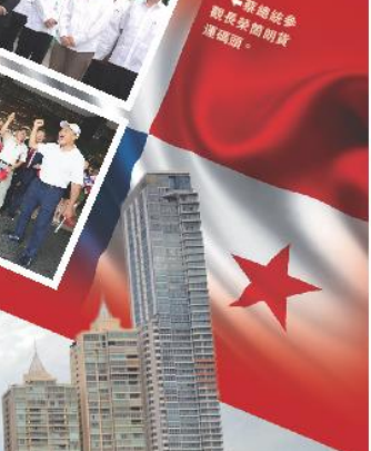
蔣總統參戰長榮開航運碼頭。