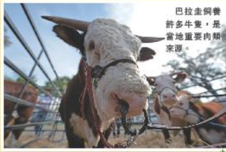
巴拉圭飼養許多牛隻，是當地重要肉類來源。