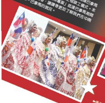
總統「英翔專案」於臺北時間26日抵達巴拿馬，並於昨日參加巴拿馬運河拓寬工程竣工儀式。本報特別開闢畫頁，將「英翔專案」抵達巴拿馬期間相關照片呈送給讀者，讓讀者更加了解我們在中南美洲的友邦—巴拿馬的現況。