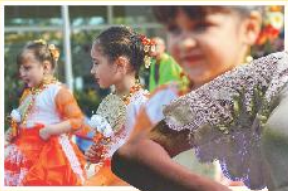
在許多場合上皆可見到巴拉圭民眾以當地熱情奔放的舞蹈迎賓，呈現在地風情。