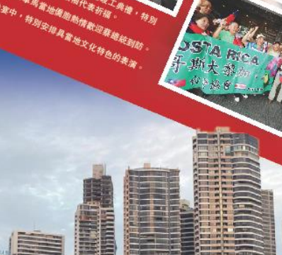
巴拿馬舉行運河拓寬竣工典禮，特別邀請當地各宗教領袖代表祈禱。 巴拿馬當地僑胞熱情歡迎蔣總統到訪，僑界晚宴中，特別安排具有當地文化特色的表演。