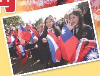
蔡總統訪問巴拉圭，受到當地民眾熱烈歡迎，並與巴國小朋友合影。