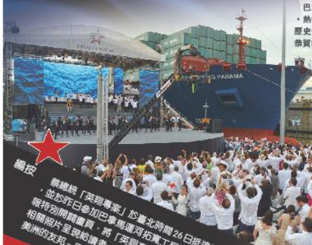
巴拿馬運河拓寬竣工典禮，熱情民眾擠爆現場，爭睹歷史性一刻；各國代表團也恭賀巴國再寫航運新頁。