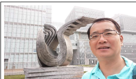
參訪北京聯合大學校園留影