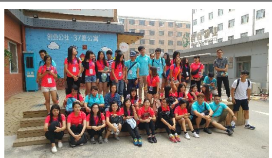
分組活動參訪北京創業公社公寓合影