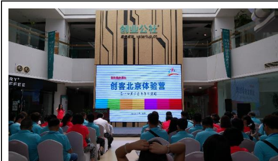
第 17 屆京台青年交流週 創客北京體驗營開幕儀式