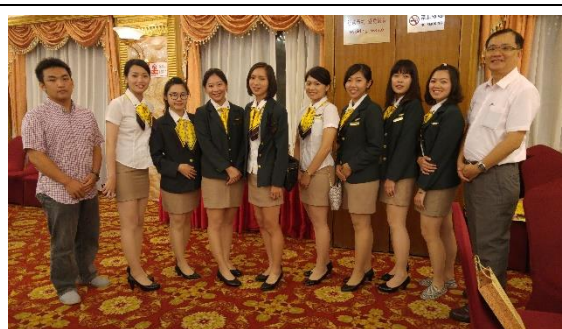
惜別展演晚會本校師生代表合影