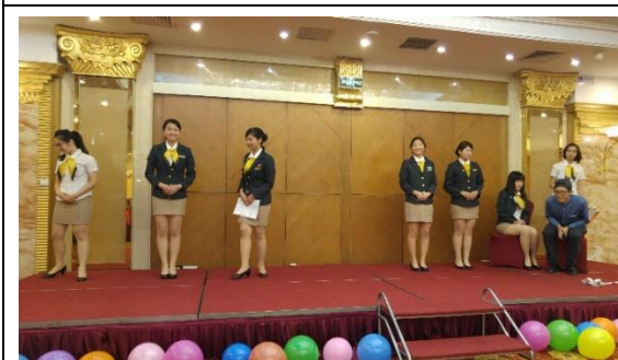
惜別展演晚會本校學生代表上台分享 餐旅專業訓練成果