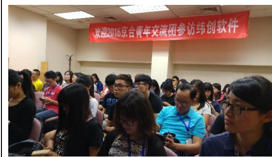
參訪北京台商企業 緯創軟件股份有限公司