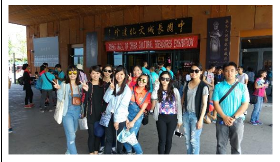
本校學生代表於慕田峪長城入口合影