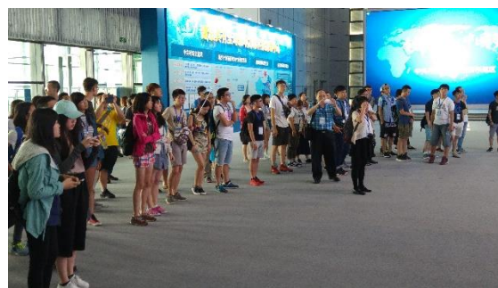
參訪北京中關村國家自主創新 示範區展示中心