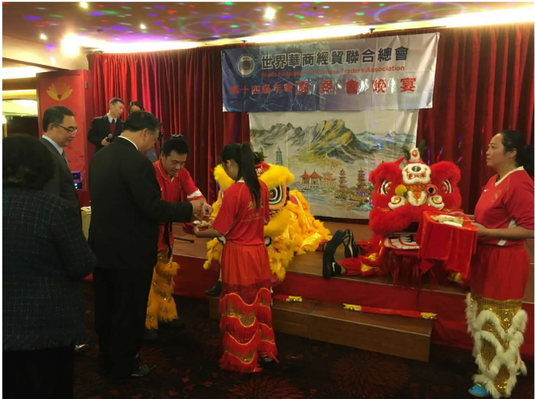
主持世界華商經貿聯合總會第 14 屆年會僑委會聯歡晚宴