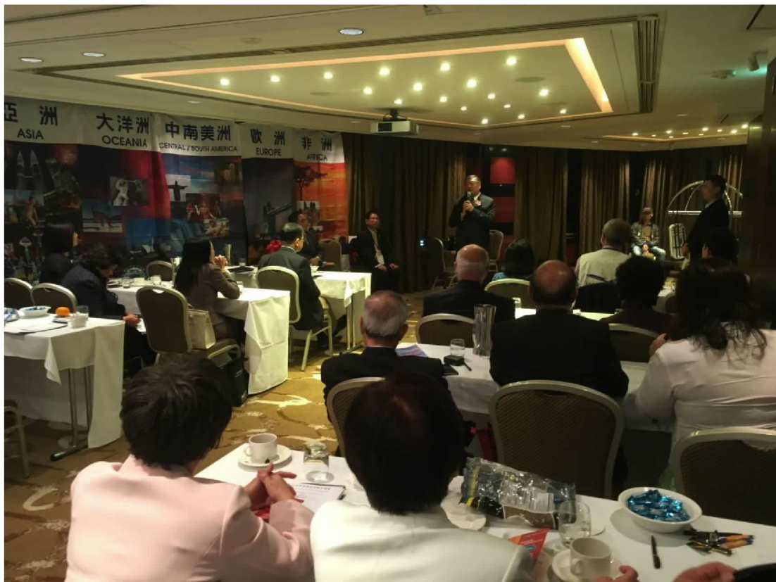
出席世界華商經貿聯合總會第 14 屆年會閉幕典禮致詞