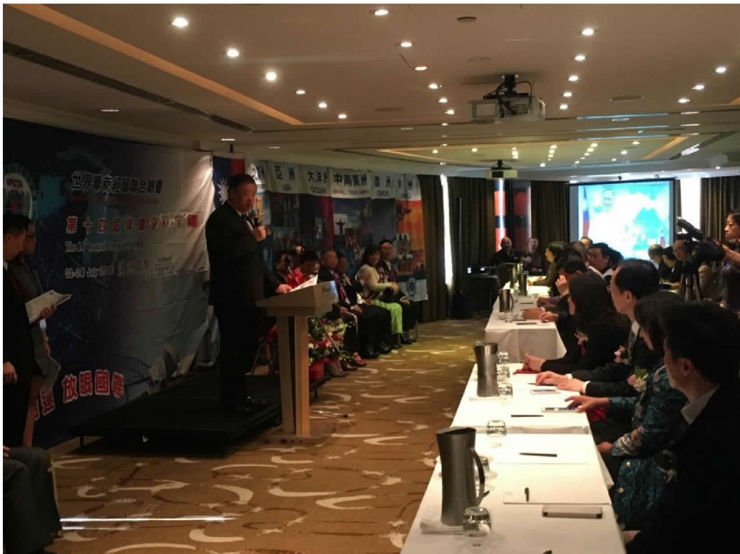
出席世界華商經貿聯合總會第 14 屆年會開幕典禮宣讀委員長賀電並致詞