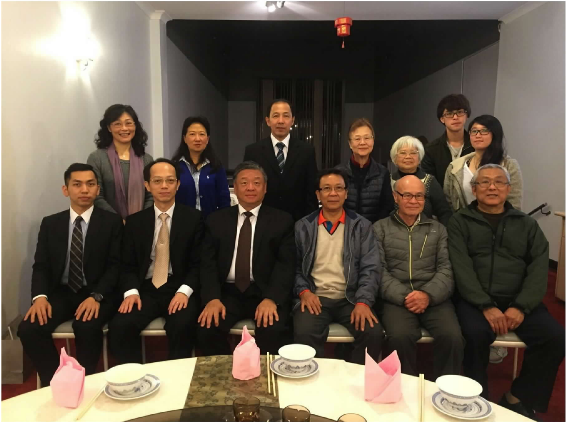
出席留臺僑生代表座談