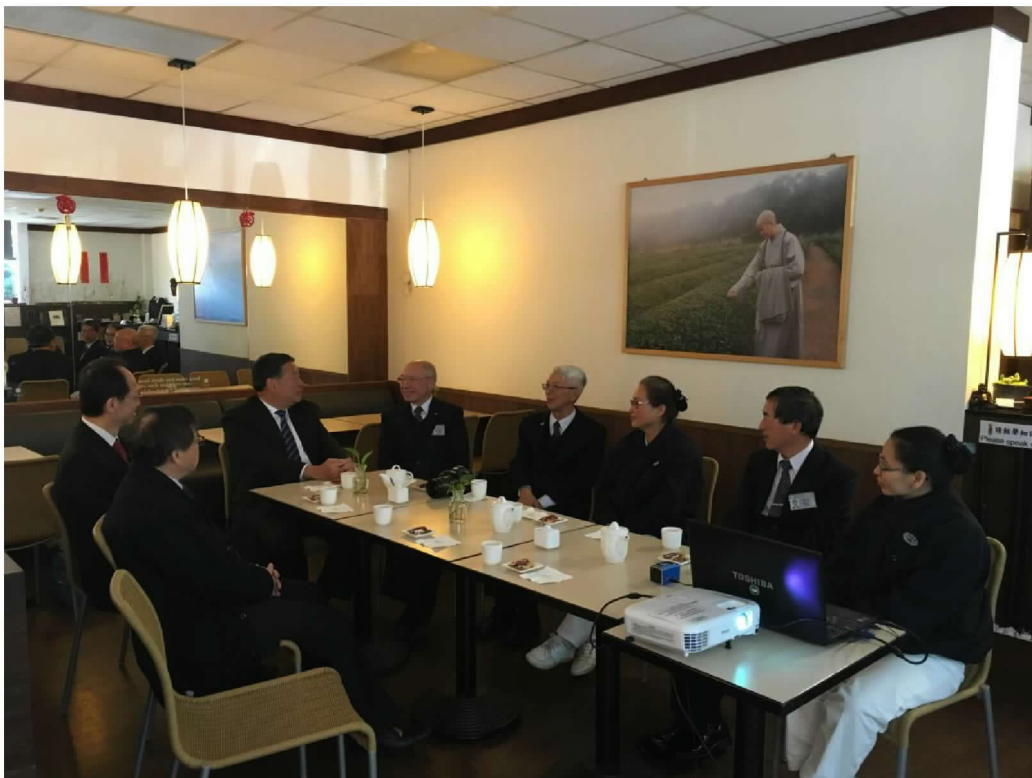
拜會佛教慈濟基金會澳洲分會