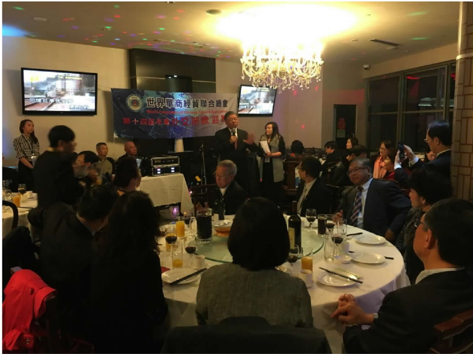
出席世界華商經貿聯合總會第 14 屆年會外交部歡迎晚宴