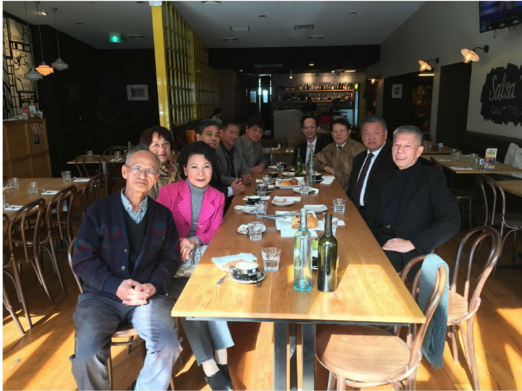
與雪梨地區臺籍僑團代表座談茶敘