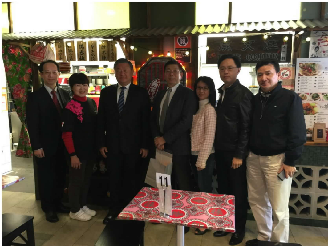
與雪梨地區臺商代表座談茶敘