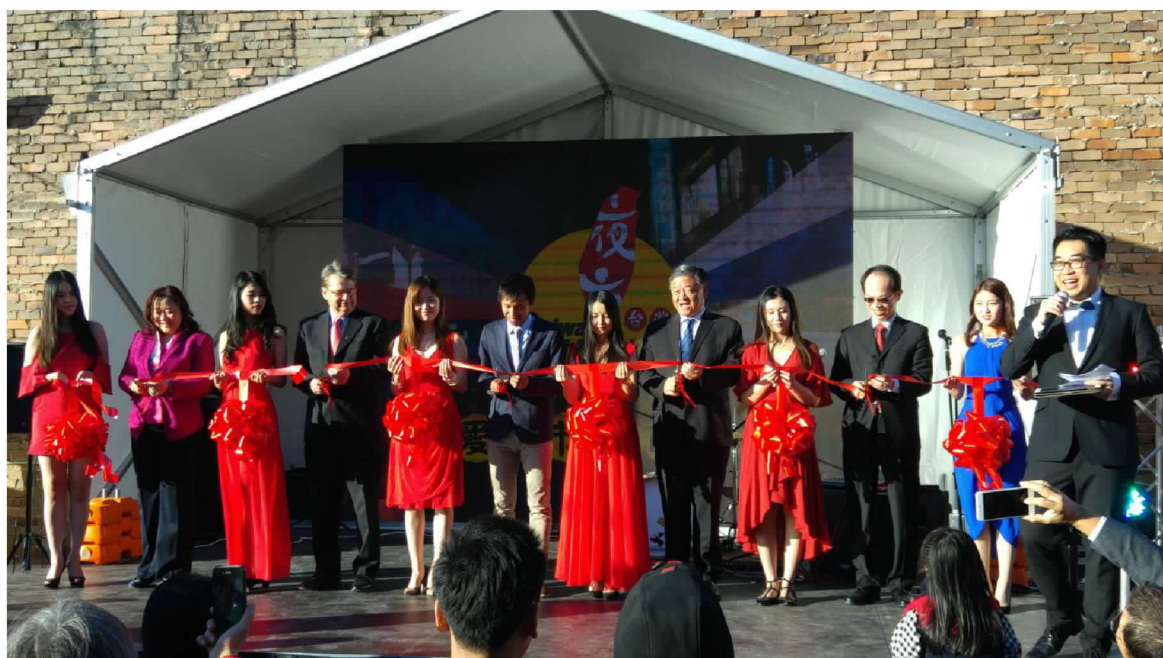
應邀出席「伊士活臺灣夜市 (Eastwood Taiwan Night Market)」開幕剪綵