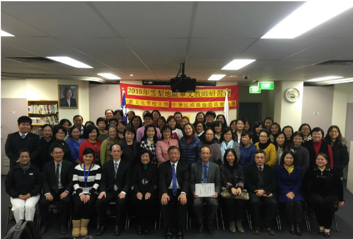
出席雪梨地區華文教師研習會結業式並頒發結業證書