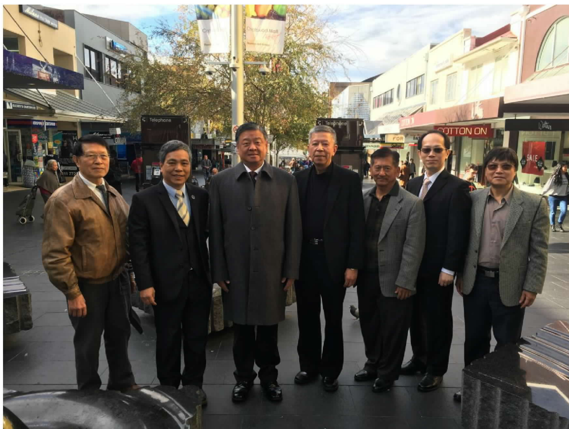
實地走訪 2016 雪梨臺灣日嘉年華舉辦場地，並了解籌備情形