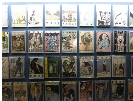
Figure 9：上海動漫博物館內陳列眾多先期作品

上海動漫博物館由上海張江文化控股有限公司投資，於 2010 年 4 月試營運，位於上海自由貿易試驗區的張江高科技園區內，是中國動漫產業集聚區「張江動漫谷」一期的重要規劃，總共有 3 層，樓地板面積約為 2,118 坪，分為位於 1 樓的動漫發展館（展示陳列區）、位於 2 樓的動漫體驗館（互動體驗區）與位於 3 樓的多功能劇場，館藏品超過 1 萬件。