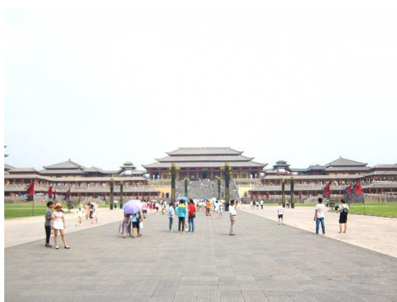
Figure 12：橫店影視城內以各朝代為單元，不同時帶的仿古建築遍佈橫店鎮內

整個橫店鎮其實就是一個影視城，其「明清宮苑」、「廣州街」、「香港街」、「清明上河圖」、「秦王宮」、「夢幻谷」、「江南水鄉·明清民居博覽城」、「華夏文化園」、「屏岩洞府」、「大智禪寺」、「紅軍長征博覽城」、「革命戰爭博覽城」、「國防科技園」等 13 個影視拍攝基地，