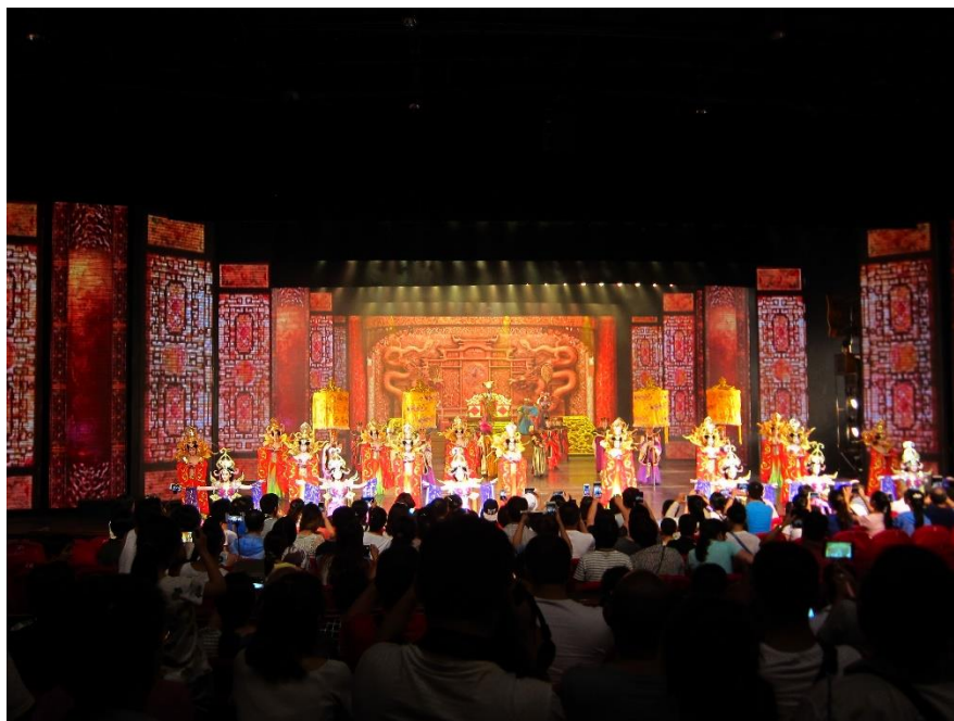
Figure 17：定目劇「宋成千古情」舞台設計華麗，場場爆滿

聚的「宋宮宴舞」、「岳飛奮戰沙場的「金戈鐵馬」、梁祝與白蛇傳千古絕唱的「西子傳說」、杭州絲綢之府與西湖龍井的「魅力杭州」等橋段，是宋城集團所經營以「宋朝」為主題的「杭州