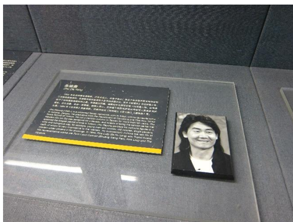
Figure 10：臺灣漫畫大師朱德庸個人資料也在館內陳列

動漫發展館主要展示陳列區漫畫、動畫與遊戲的古往今來歷史史料及相關雜誌、作品與製作器物，包括 24 位中國大陸著名漫畫家的 70 餘幅原作、等比例複製的 2 萬 5 千年前位於西班牙北部的