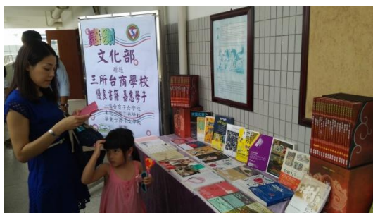
Figure 2：臺商眷屬帶著小孩先來挑選文化部的贈書

總會有不少臺商，帶著子女專程至現場選購臺版圖書，因為在中國大陸要購買青少年正體臺版圖書並不容易，僅能在回臺灣時選購，或託親朋好友帶往中國大陸。他也表示，自己也是個從臺南到臺北打拼的異鄉遊子，特別能感受每個異鄉遊子們思鄉情怯的心情，更何況離鄉背井十萬八千里，到中國大陸打拼的