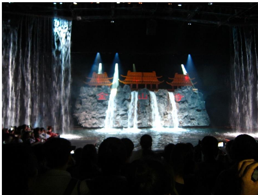
Figure 18：水淹金山寺視宋成千古情中重要的橋段之一

分為觀眾席、貴賓席與帶桌豪華沙發席三種，票價為人民幣 300 元（優惠票為人民幣 240 元）、人民幣 310 元（優惠票為人民幣 240 元）與人民幣 480 元，平日演出 2-3 場、假日演出 4-6 場，旺季時有時更會演出至 9