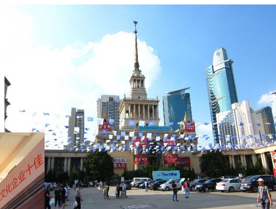
Figure 5：2016 年上海書展選在古色古香的上海展覽館舉辦，因為交通方便，場館幽雅，吸引大批民眾前往參觀過。大批剛出爐的新書都趕來試