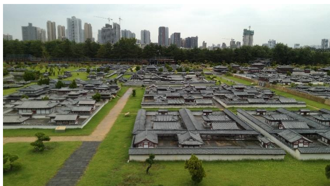
Figure 32：縮小比例的長安城市大明宮的一大特色

要把如此之多的單位和住戶搬遷，著實不易。陝西省委、省政府、西安市委、市政府等單位最後拍板，通過由政府主導、市場化運作的方式解決問題。120 億人民幣的預算，2007 年開始遺址保護工程，歷經抗爭、溝通、取得居民諒解