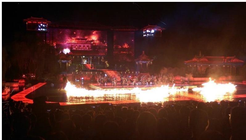
Figure 26：盛大的「長恨歌」場景，水火都是來真的

由於是戶外演出，為了不破壞華清宮遺址景色，因此所有的戶外演出設施全部採取隱蔽式設計，包括九龍湖可升降舞臺，白天全部隱蔽在湖面下、4 組 6 公尺高，供演出專用的燈光音響架，白天全部隱蔽在地面下、舞臺兩側 4 組多種特效設施，白天全部隱蔽在湖水、山體及景觀中，座位亦是可伸縮式。軟硬體資源的投入甚為可觀，每年也才能因此有條件吸引大批遊客前來。自 2007 年正式公演以來，已演出超過 1,500 場，成為西安旅遊的「金字招牌」。