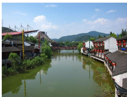
Figure 16：杭州宋城內小橋流水，美不勝收

《宋城千古情》定目劇是一齣大型的歌舞劇，用鉅資打造出的絢爛聲光效果與先進舞臺科技，融合華麗的服裝、道具、場景、歌舞、雜技，直白的呈現出發生在杭州與西湖的歷史與特色，包括古杭州先民創造出良渚文化的「良渚之光」、定都杭州的南宋王朝四方輻輳、萬物所