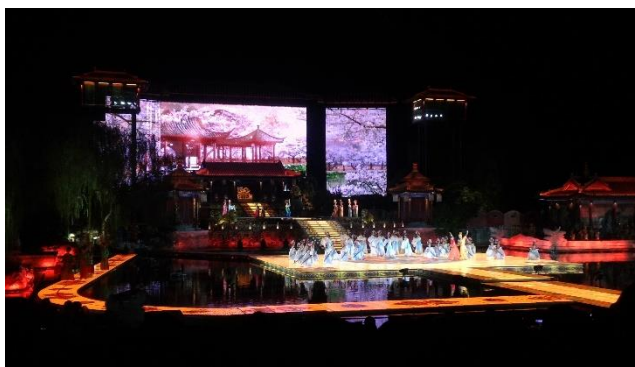
Figure 25：在華清池遺址演出的實景定目劇「長恨歌」，舞台設計與服裝都很華麗，觀眾讚不絕口

《長恨歌》定目劇是一齣以唐朝詩人白居易所作長篇敘事詩「長恨歌」為創作藍本，在故事發生地華清宮遺址演出的實景舞劇，企圖重現「長恨歌」的動人篇章，透過鉅資打造出的絢爛聲光效果、實景投影技術與先進舞臺科技，融合華麗的服裝、舞蹈，依白居易「長恨歌」貴妃受寵、馬嵬驚變、玄宗皇帝思念、仙界尋妃四個段落，演繹「楊家有女初長成」、「一朝選在君王側」、「夜半無人私語時」、「春寒賜浴華清池」、「驪宮高處入青雲」、「玉樓宴罷醉和春」、「仙樂風飄處處聞」、「漁陽鼙鼓動地來」、「花鈿委地無人收」、「天上人間會相見」等 10 幕。