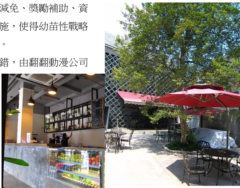
Figure 15：翻翻動漫公司在園區內設置了相當優閒的生活空間，要讓作者無後顧之憂地創作

他山之石，可以攻錯，由翻翻動漫公司規劃整體生活環境吸引動漫人才進駐的經驗可知，像此種產業園區應規劃完善的基礎建設與環境，藉此吸引人才、培育人才，最終讓人才自行發光發亮，進而提升產業整體的質與量，值得借鏡。