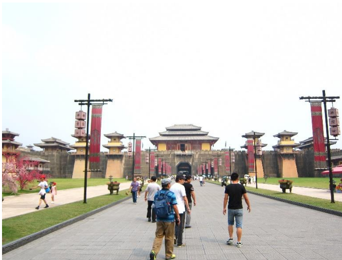
Figure 11：橫店影視城是中國大陸 5A 級旅遊景區

絕對有其道理，未到橫店影視城前，從報章媒體所得資料，不外乎是橫店影視城是目前中國大陸最大的影視拍攝基地、美國《好萊塢》雜誌稱其為「中國好萊塢」、一天內超過 50 個劇組同時拍攝等，與中國大陸其他影視拍攝基地相比，應該就是一片