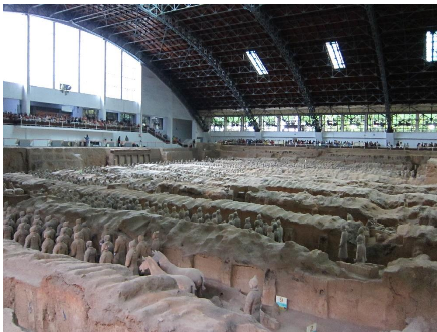
Figure 28：兵馬俑聲勢浩大，遊客更是擠得水洩不通

膩、明快，陶俑裝束、神態各異，具有鮮明的個性和強烈的時代特徵。俑坑內出土的青銅兵器有劍、鉞、矛、戈、戟、殳、弩機以及大量的箭鏃等。大部分兵器歷經兩千多年依然鋒刃銳利，表示當時已經有了很高的冶金技術。1980 年，在秦始皇陵西側還出土了兩乘大型彩繪銅車馬，每乘車前駕有四馬，車上