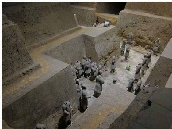
Figure 27：秦兵馬俑博物館內坑道挖掘後，均盡量維持原貌

秦兵馬俑坑發現於 1974 年，被譽為「世界第八大奇蹟」、「二十世紀考古史上的偉大發現之一」。三個兵馬俑坑成品字形排列，總面積 2 萬多平方米，坑內放置與真人真馬一般大小的陶俑、陶馬 7,000 餘件，具有很高的藝術價值。兵馬俑的塑造，是以現實生活為基礎而創作，藝術手法細