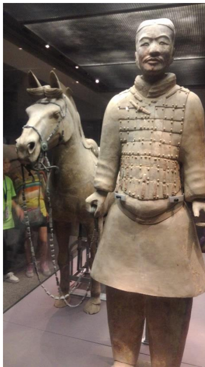
Figure 29：依真人比例 1:1 製作的兵馬俑，神韻維妙維肖

2010 年 10 月 1 日，中國大陸所謂的十一國慶黃金週的第一天，占地 3,386 畝、位於秦始皇陵核心區的秦始皇陵遺址公園正式對外開放，主要參觀點包括秦始皇陵封土、已確定的主要建築遺址、陪葬坑等。秦始皇陵遺址公園的對外開放彰顯出中國大陸對遺址保護工程的重視，然而也突顯出亟欲販賣祖宗財的渴望，因此在文化資產的保護與參觀人數的平衡點上，選擇了商業包裝。