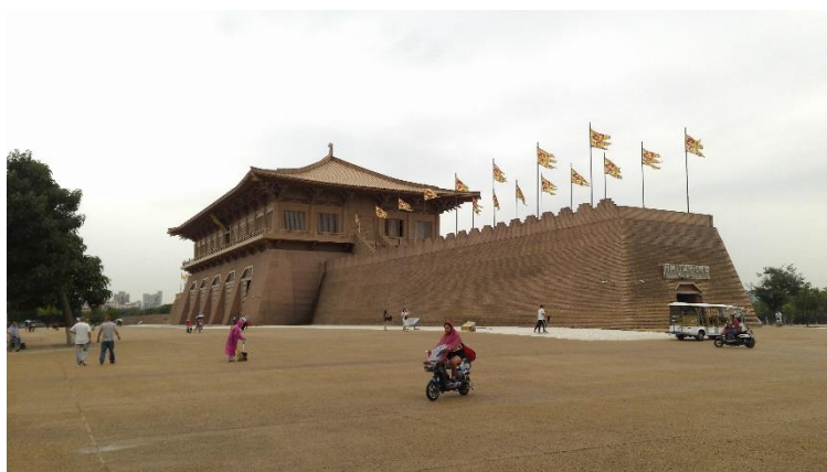
Figure 30：唐大明宮入口牌樓氣度恢宏

公元 634 年始建於唐朝京師長安(今西安)北側龍首原的大明宮，是當年大唐帝國的宮殿，是當時的政治中心和國家象徵。占地 3.2 平方公里，其面積相當於 3 個凡爾賽、4.5 個北京故宮、12 個克里姆林