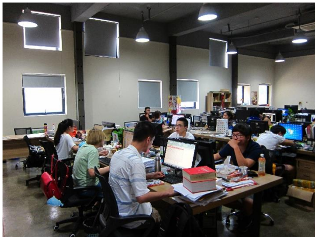
Figure 14：翻翻動漫公司吸引動漫人才在優良的環境下創作

翻翻動漫位於「杭州創意良渚基地」的「玉鳥流蘇創意園」內，基地範圍主要是以良渚文化遺址（良渚博物館）及部分良渚鎮為主，整體規劃舒適、閒逸、具文化感。翻翻動漫所在建築由政府興建（非舊建築），但以租金優惠提供予該