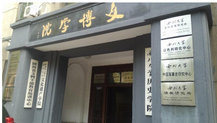
Figure 23：陝西西北大學文博學院下轄歷史學院及文化遺產學院等，為中國考古界培育出許多人才

西安是中國號稱計畫總值高達21兆美元的「一帶一路」中的「絲綢之路經濟帶」的門戶(起點)，扮