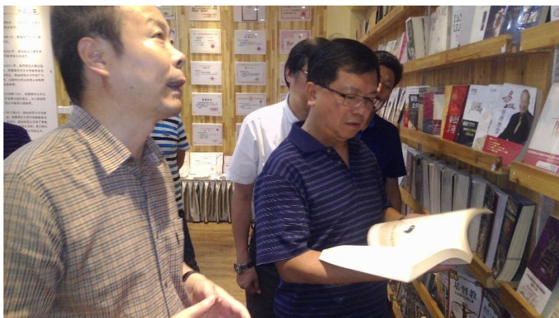
Figure 21：陝西師範大學出版總社也引進許多臺版書

具的爭議性，後續單行本的引進工作被各方保守勢力阻撓而擱淺，此後陝西施大出版社在日本漫畫市場長時間均無建樹 8 ，轉而繼續關注其核心領域—教育與學術出版。