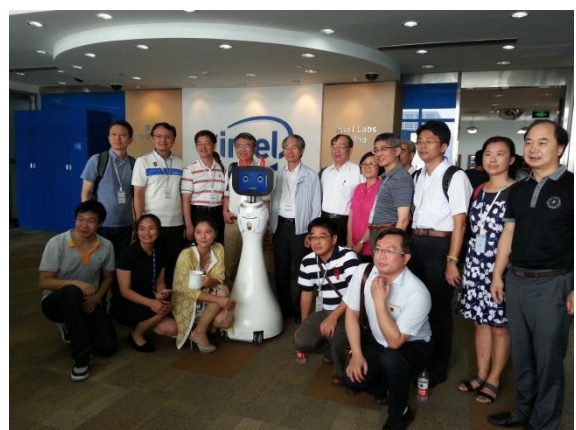
實地教學-英特爾中國研究院