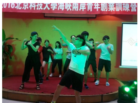
各校準備節目表演