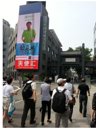
實地教學-中關村創業大街