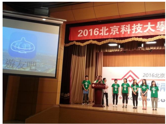
各小組上台彙報分享