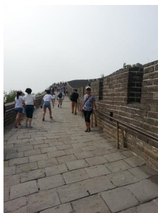
文化參訪-八達嶺長城