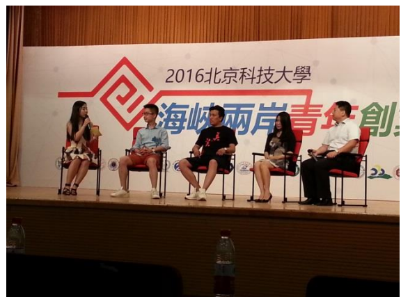
創業沙龍-創業青年才俊分享