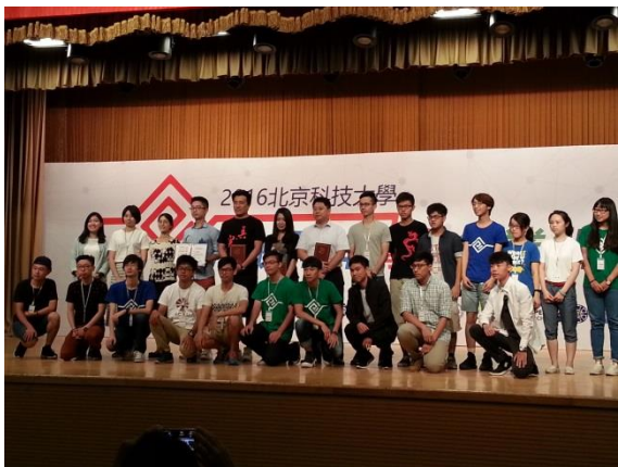
青年才俊與現場師生代表合影