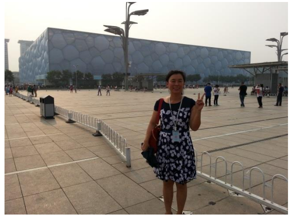
實地教學-奧林匹克公園(水立方)