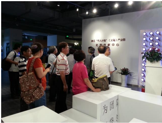
實地教學-義創空間