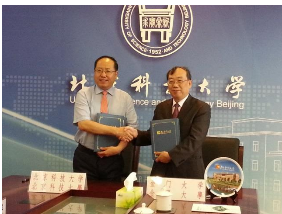
本校與北京科大簽訂學術交流合約