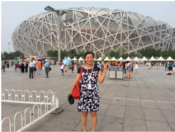
實地教學-奧林匹克公園(鳥巢)