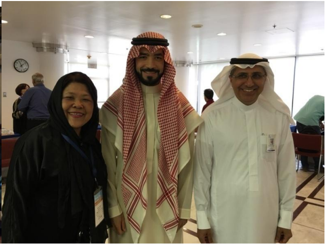
沙烏地阿拉伯朱拜爾貿易洽談會