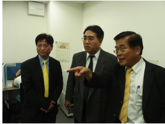
古源光校長與兵教大教師交換意見