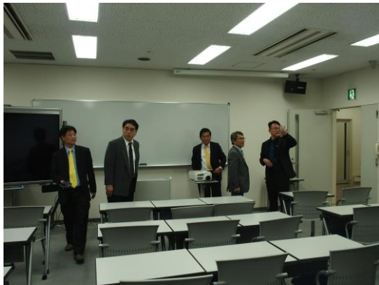
本校代表團參訪視聽教室