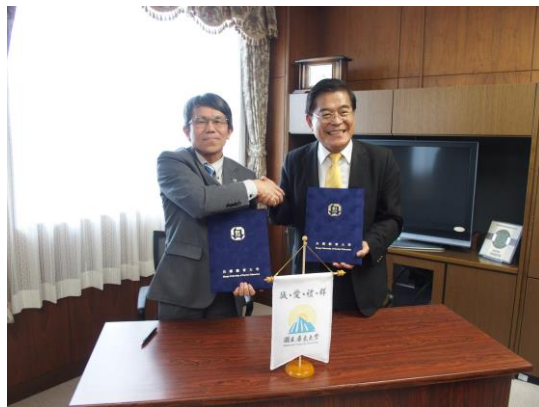
兩校校長相互握手致意