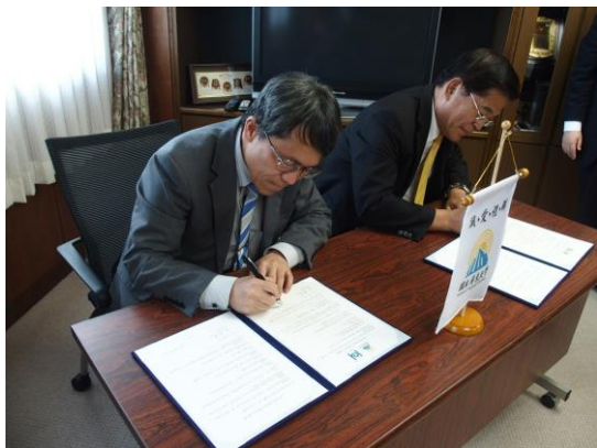
兩校校長簽署學術交流協定