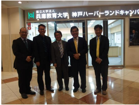
本校代表團參訪兵庫教大神戶校區