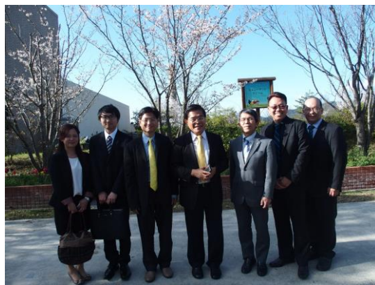
福田校長與代表團於校園內合影