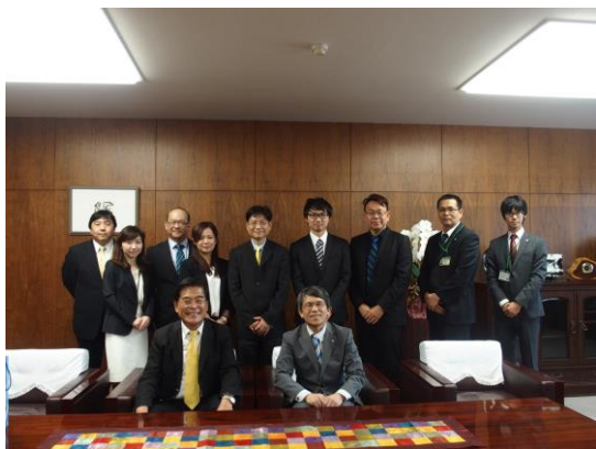
全體人員於貴賓室合影