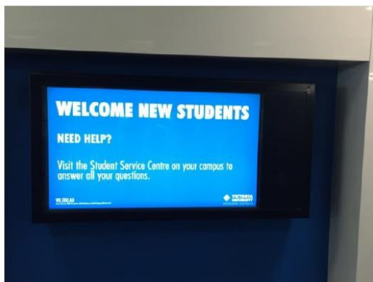
圖二十五、維多利亞大學互動裝置