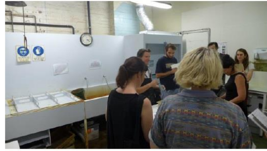
圖十九、RMIT 上課實況(一)