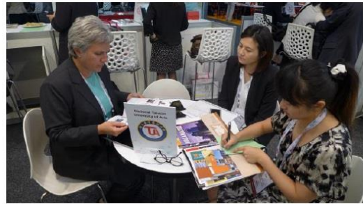
圖十三、與西密西根大學代表會晤實況