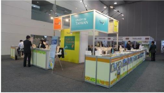
圖五、Study in Taiwan 攤位