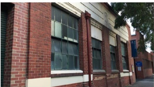
圖二十三、墨爾本大學藝術學院建築外觀