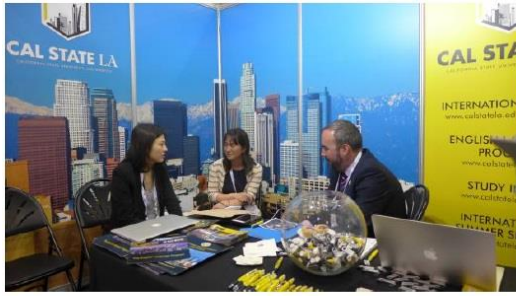
圖十、與美國加州州立大學洛杉磯分校 會晤實況