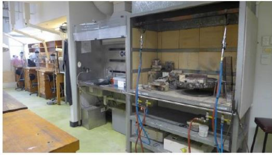
圖十八、工藝工作坊