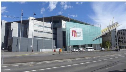
圖一、澳洲墨爾本會展中心外觀(一)

亞太教育者年會（Asia-Pacific Association for International Education）設立於 2004 年，為亞洲及太平洋地區第一個國際型教育組織，旨為提供高等教育及相關組織溝通平台，期望能藉此推動各組織間的師生及職員交換、獎學金、學術合作等跨地區交流機會。本屆亞太教育者年會為第 11 屆，此次活動由墨爾本大學（The University of Melbourne）、墨爾本皇家理工大學（RMIT University, officially Royal Melbourne Institute of Technology）、迪肯大學（Deakin University）等共 9 所澳洲大學共同籌辦，為期四天並於澳洲墨爾本會展中心（Melbourne Convention and Exhibition Centre, MCEC）舉行。