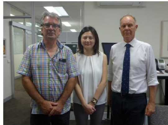
圖十五、與 RMIT 藝術學院院長及教授合影