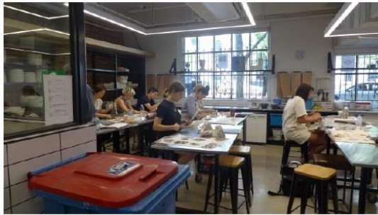
圖二十、RMIT 上課實況(二)