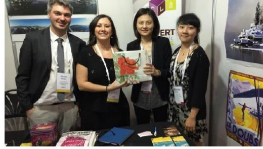
圖十一、與法國姊妹校馮師-韋帝大學代表合照