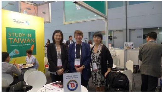
圖十二、與佛羅里達大西洋大學代表合照