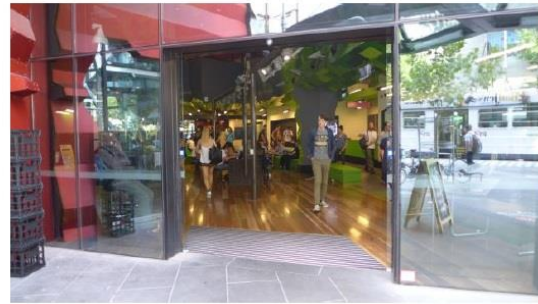
圖二十一、RMIT 學生交流中心