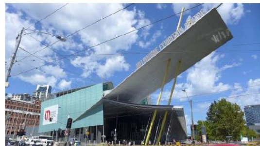
圖二、澳洲墨爾本會展中心外觀(二)