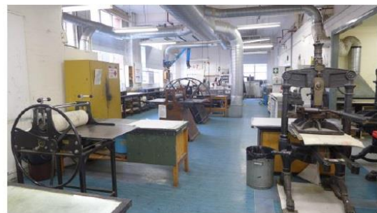
圖十七、RMIT 版畫印刷中心