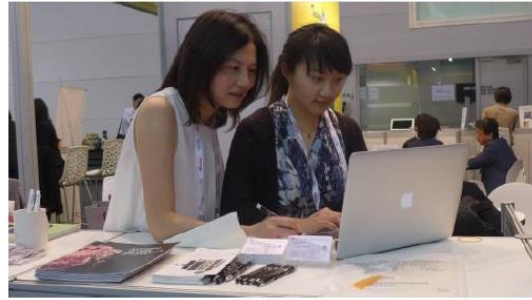
圖六、現場前置工作實況

因應本校學生的第二外語多為英語，且表演學院學生多次反應沒有太多相關科系的姊妹校可做交換的選擇，故本次參展主要的目標鎖定為美國、加拿大、澳大利亞及紐西蘭的高等文化藝術領域多元發展的校院。在公佈參展人員名單後，即主動 email 寄送目標校院於會場面談的邀請，其中約有 6 分之 1 的信件回覆並進行安排會晤，以及 RMIT University 的校園參訪。此次會議面談交流情況，依據時間先後排序紀錄如後：