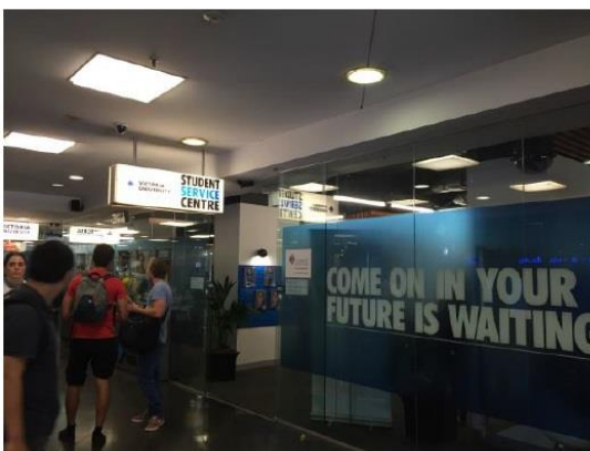
圖二十四、維多利亞大學學生服務中心