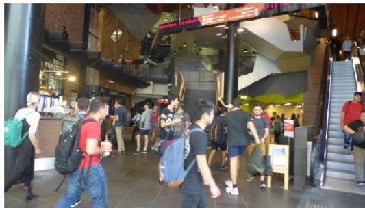
圖二十二、RMIT 管理學院