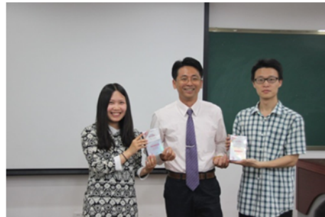
↑06/06 致贈紀念品予主辦單位 2