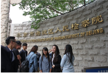
↑06/03 學生參觀人民檢察院活動 5