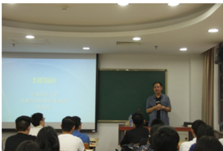
↑06/03 學生聆聽中國法律職業介紹活動 2