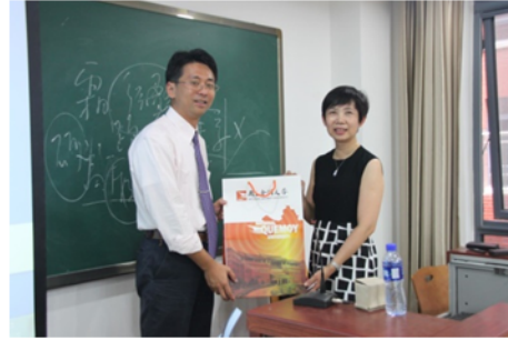
↑06/06 致贈紀念品予研習授課教師