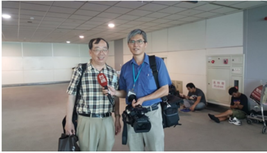
↑06/03 黃校長接受台視記者對本校招生政策訪問