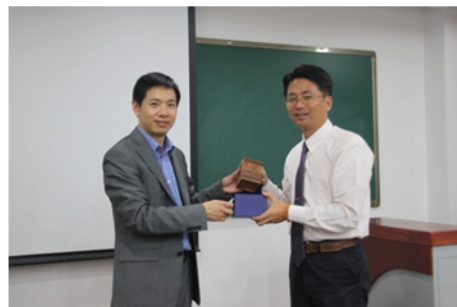
↑06/06 致贈紀念品予主辦單位 4