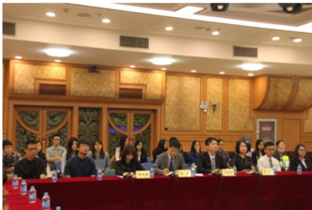
↑06/03 學生參觀人民檢察院活動 2