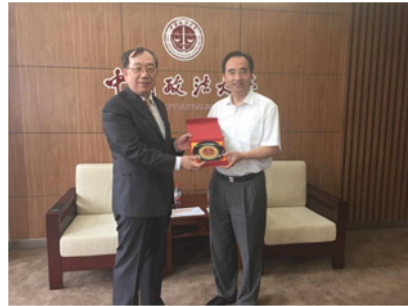
↑06/04 兩校校長互贈紀念品