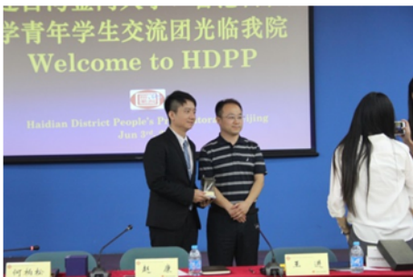
↑06/03 學生參觀人民檢察院活動 4