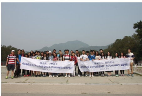
↑06/04 參訪學生集體大合照 1