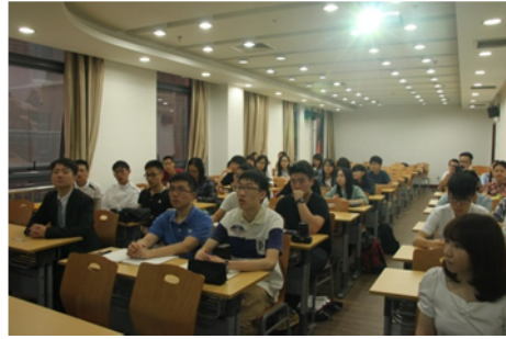
↑06/03 學生聆聽中國法律職業介紹活動 1