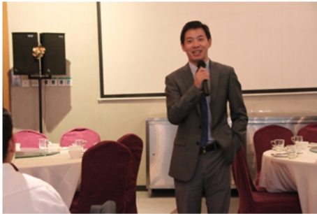
↑06/03 學生參加歡迎晚宴 2