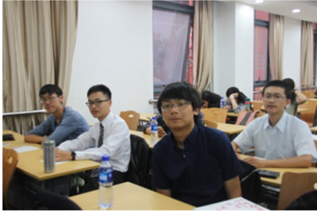
↑06/06 學生參與研習活動 1