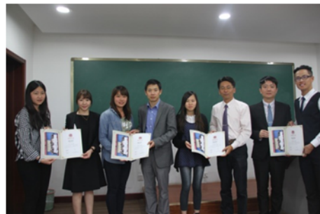
↑06/06 頒發研習結業證書予學員 2