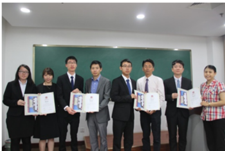
↑06/06 頒發研習結業證書予學員 1