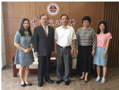
↑06/04 兩校校長與交流學生合照