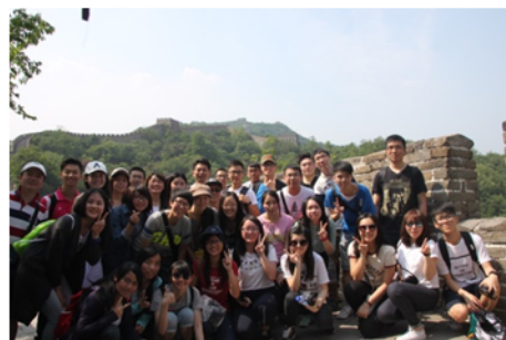
↑06/04 參訪學生集體大合照 2