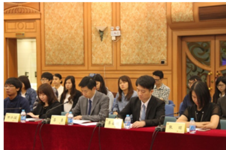
↑06/03 學生參觀人民檢察院活動 3