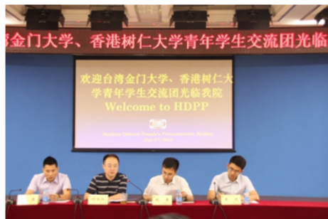
↑06/03 學生參觀人民檢察院活動 1