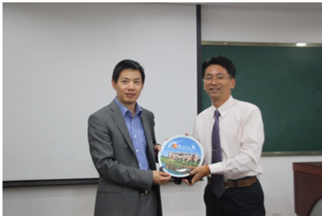
↑06/06 致贈紀念品予主辦單位 1