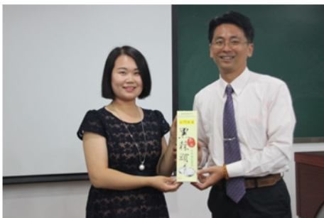
↑06/06 致贈紀念品予主辦單位 3