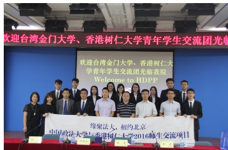
↑06/03 學生參觀人民檢察院活動 5