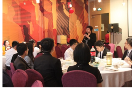
↑06/03 學生參加歡迎晚宴 1