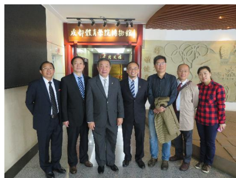
成都體育學院的特色：體育博物館