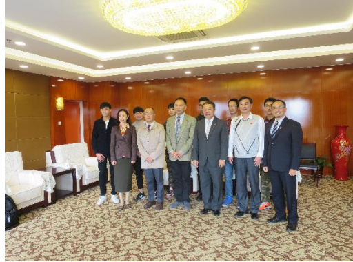
與北京首都體育學院鐘秉樞校長等人合影