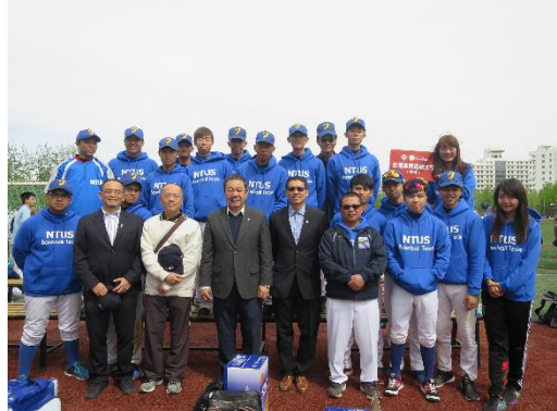
出席首屆「海峽兩岸大學生棒球賽」