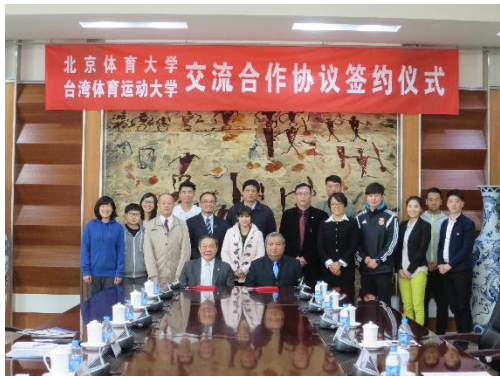
與北京體育大學池建校長等人合影