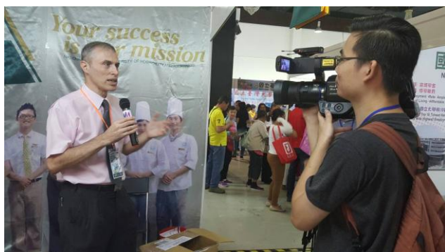
圖 5：高士景組長接受展場媒體採訪