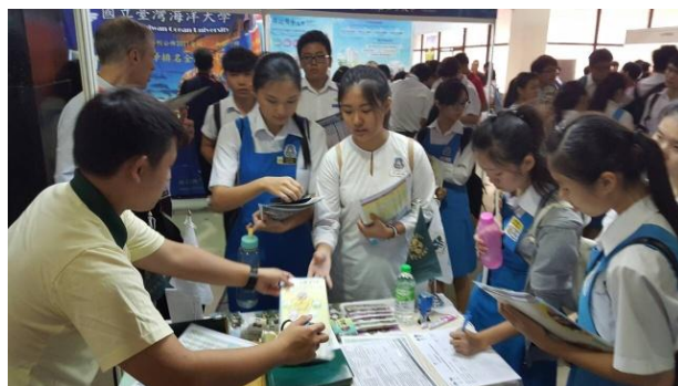
圖 4：吉隆坡教育展盛況