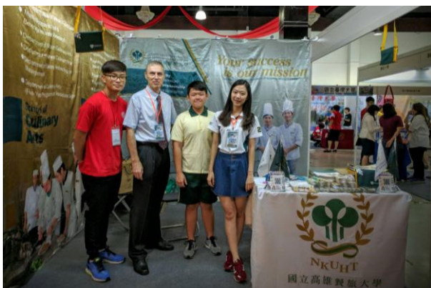
圖 3：教職員及當地僑生合影(2)