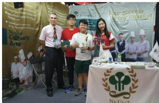
圖 2：教職員及當地僑生合影(1)