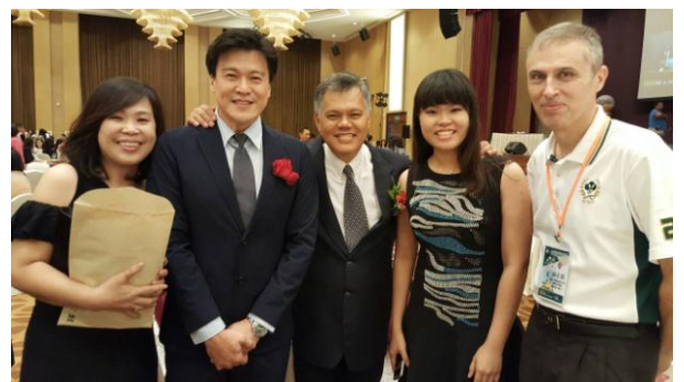
圖 4：檳城留臺校友會文華之夜