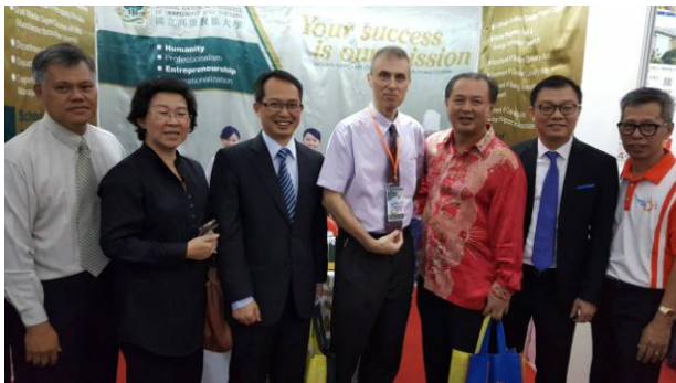
圖 3：與檳城留臺校友會一同合影