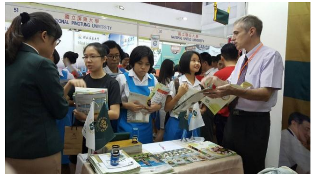
圖 2：檳城教育展盛況