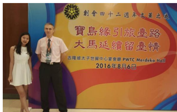
圖 6：留臺聯總 42 週年文華之夜