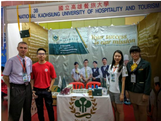
圖 1：教職員及當地僑生合影