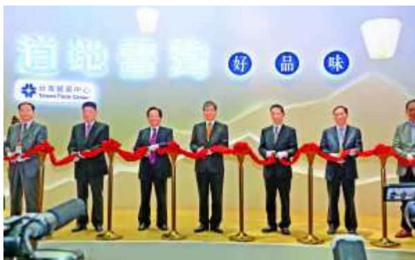
第十八届海交会“台湾精品馆”开幕剪彩