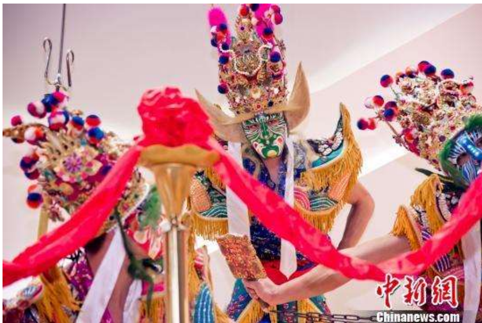
台湾独有的阵头文化“官将首”现身开幕式。