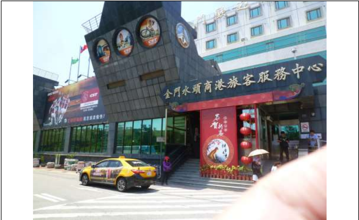
參展團考察金門水頭商港旅客服務中心