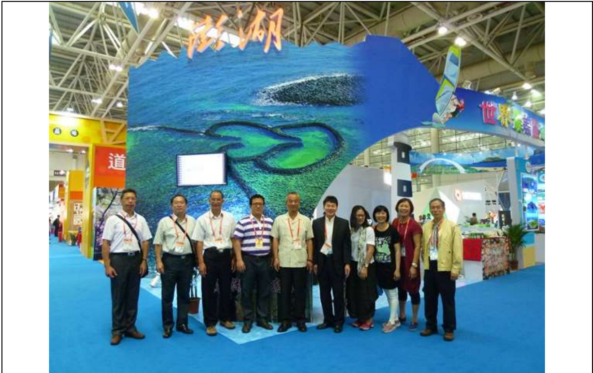
澎湖地區參展團於第十八屆海峽兩岸經貿交易會展澎湖館合影