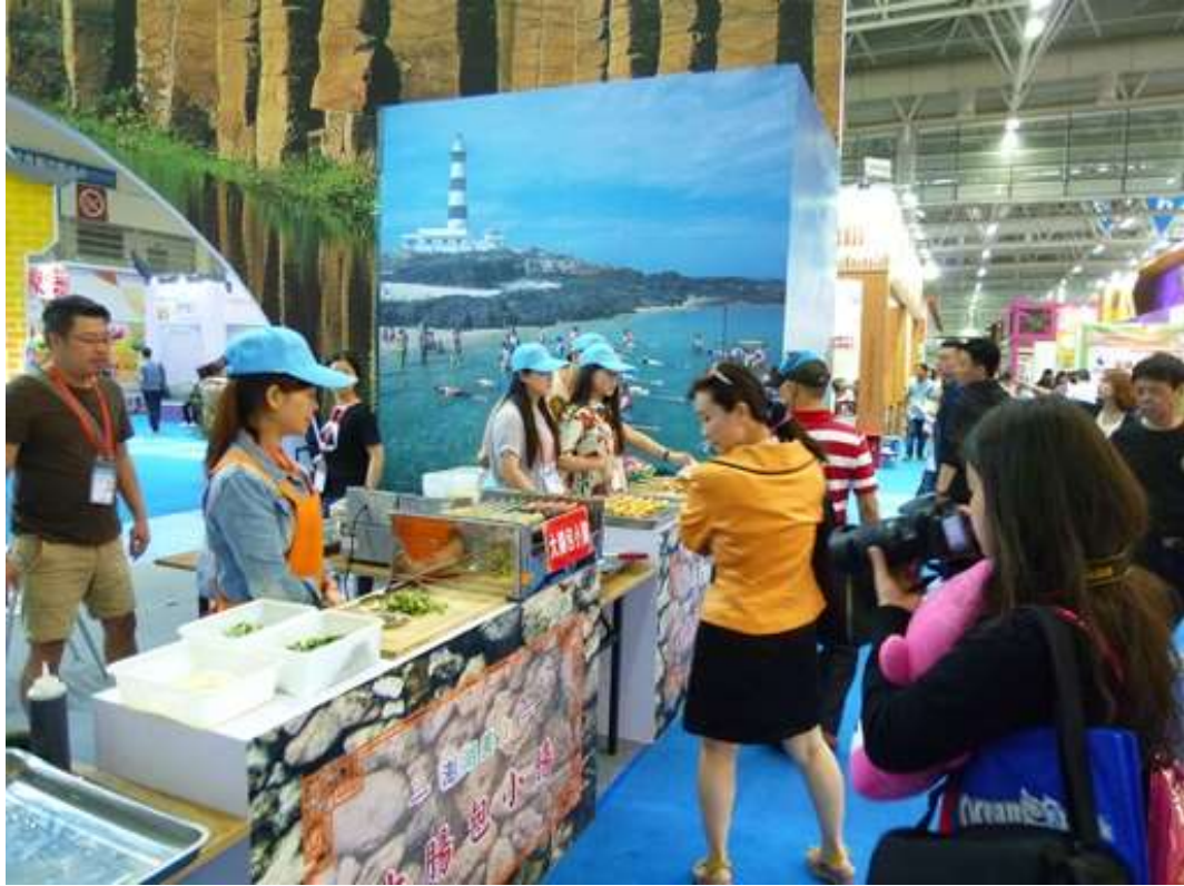
澎湖特色美食吸引人潮