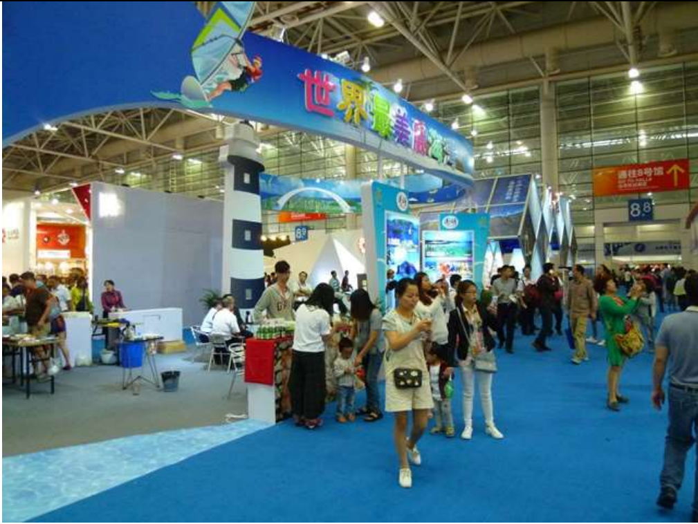
以「世界最美麗海灣-澎湖館」專業造型呈現澎湖整體觀光意象及文化內涵