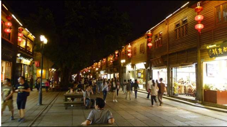
參展團考察福州市區三坊七巷景點