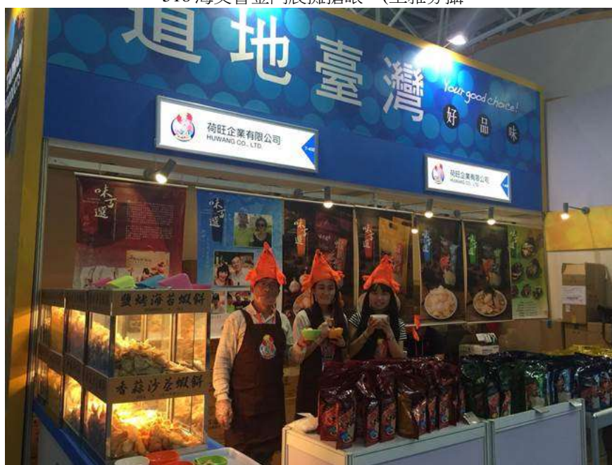
戴著蝦子造型帽子的業者行銷道地台灣蝦餅。