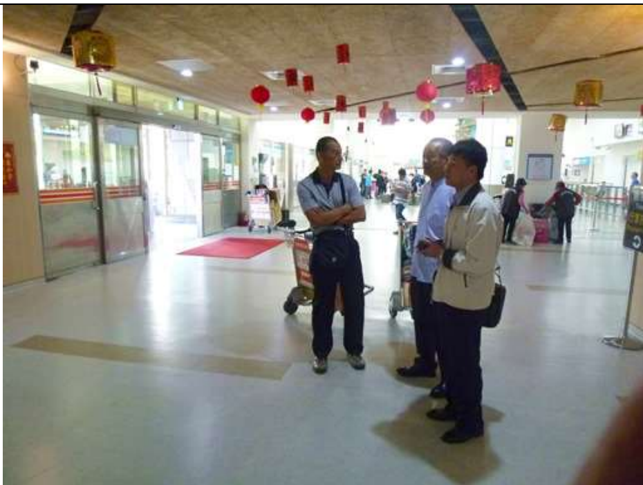
參展團員以「小三通」之模式，實際體驗、考察其便利性與各服務機能