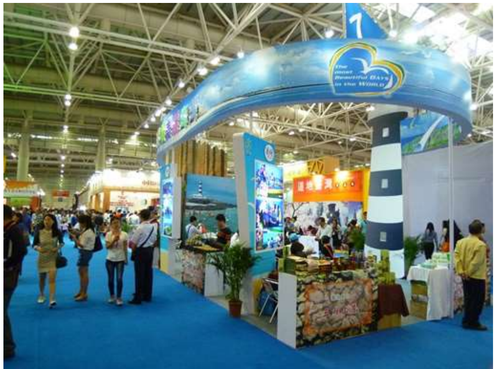
展館之佈置呈現澎湖多元之自然及人文資源