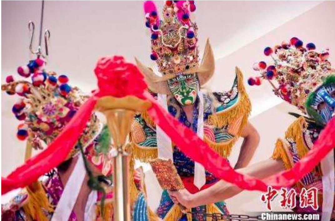
台湾独有的阵头文化“官将首”现身开幕式。