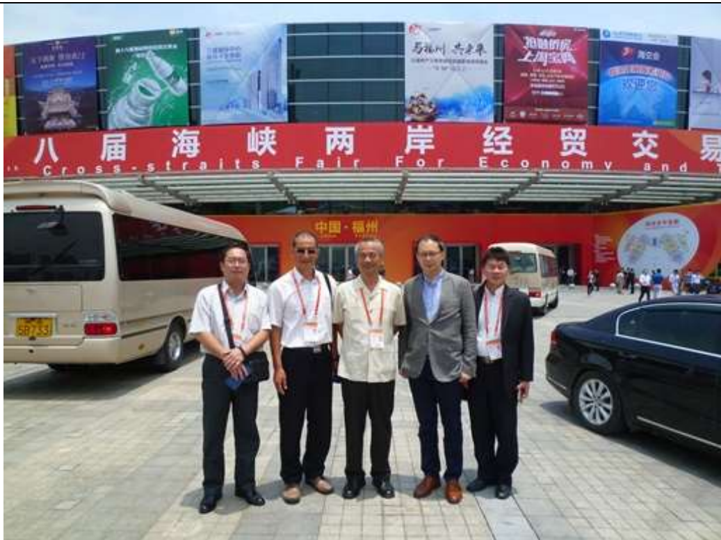
澎湖地區參展團於第十八屆海峽兩岸經貿交易會展館前廣場合影