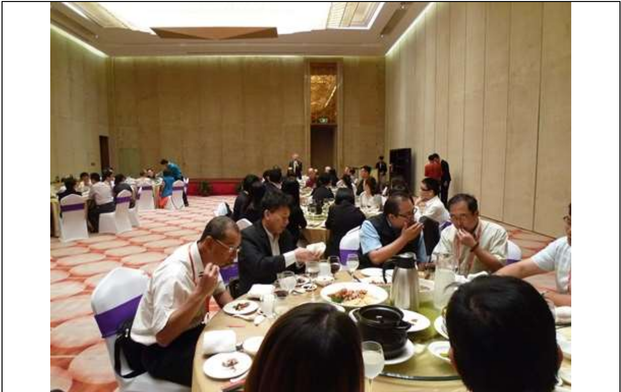
參展團出席大會所主辦之迎賓招待會活動