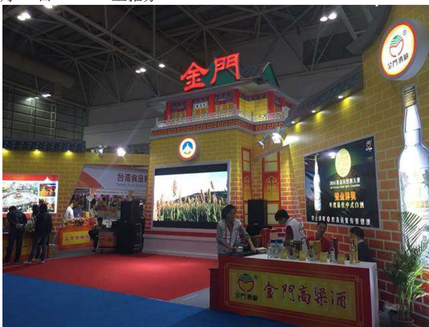
518 海交會金門展攤搶眼。