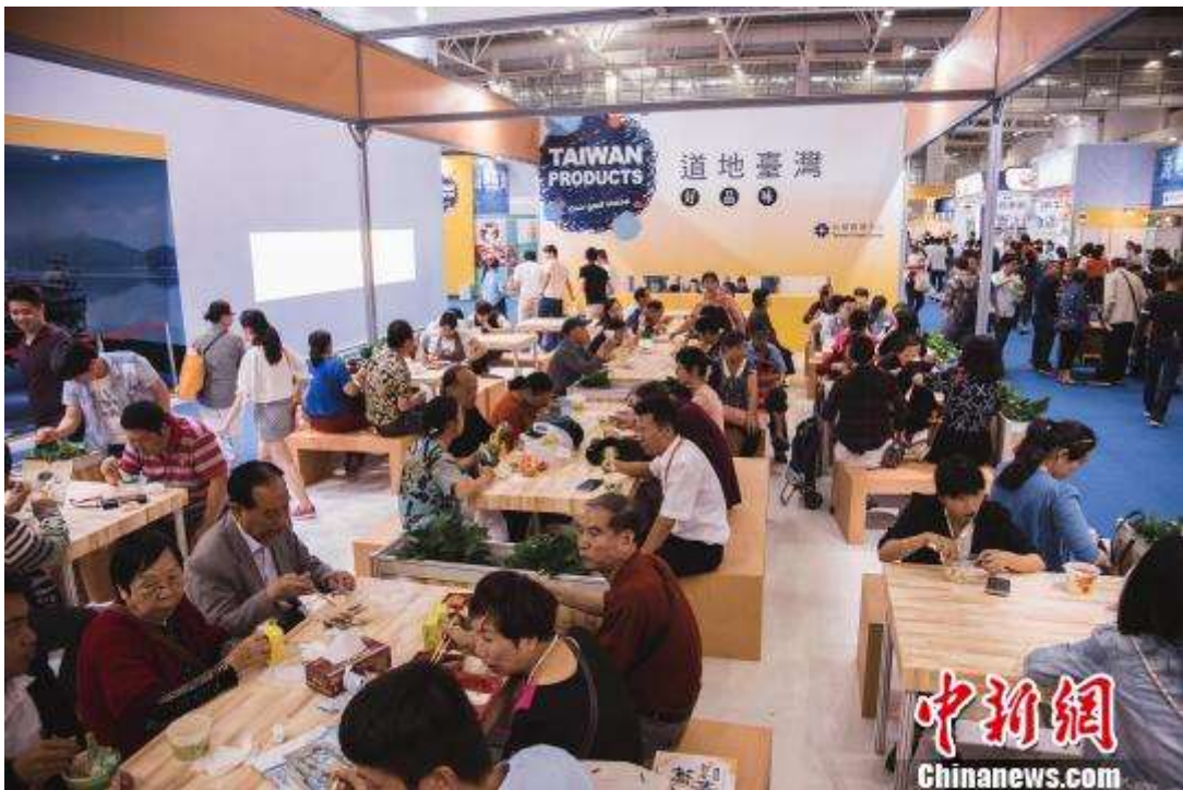
众多市民现场品尝台湾美食。